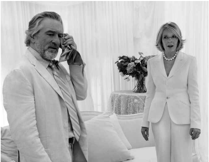
Wie gaukelt man hochreligiösen Fanatikern einen keuschen Lebenswandel vor? Robert de Niro weiß die Antwort in „The Big Wedding“. Neu im Ciné Belval, Ciné Waasserhaus, Kursaal und Utopolis.

The Hangover III USA 2013 von Todd Phillips. Mit Zach Galifianakis, Ed Helms und Bradley Cooper. 100'. O.-Ton, fr. + nl. Ut. Ab 12. Utopolis, Di. 19h30