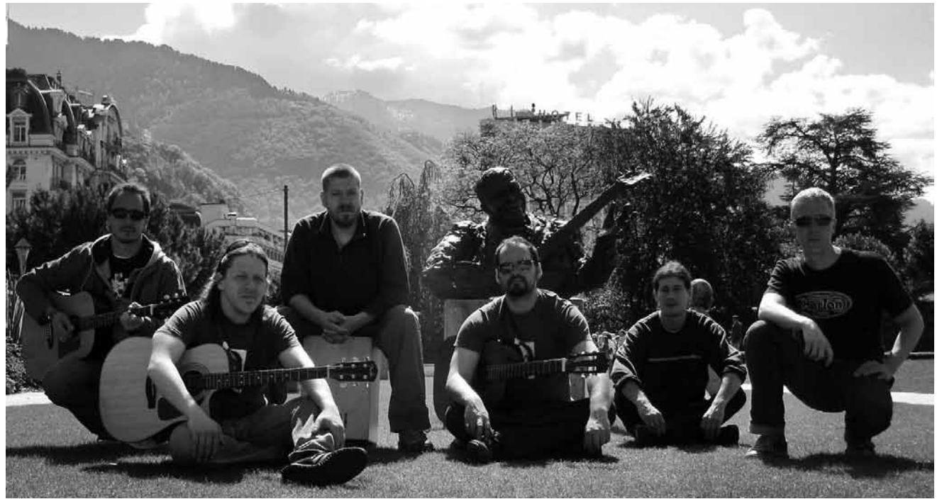
Auch Ungarn haben den Blues ... was die T. Rogers Blues Band am 3. Oktober in der Schungfabrik in Tetingen beweist. Im Vorprogramm: Sacred Numbers.