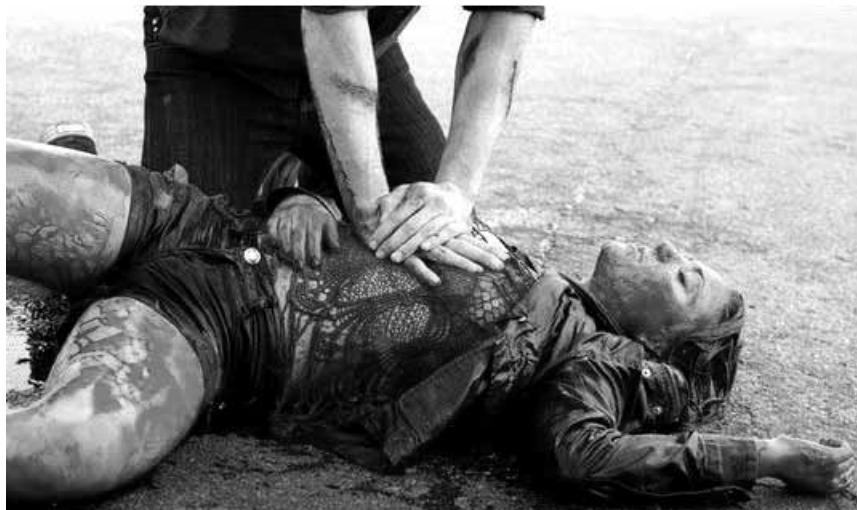
Auch eine Konsequenz des Klimawandels: Es regnet plötzlich gefräßige Haie in Kalifornien. „Sharknado“, am Montag im Utopolis Belval, im Rahmen der „Horror Week“.

Dwight ist ein am Strand lebender Rumtreiber. Nachts bricht er in Häuser ein, deren Besitzer sich im Urlaub befinden. Hier schläft er und sucht im Abfall nach Essensresten.