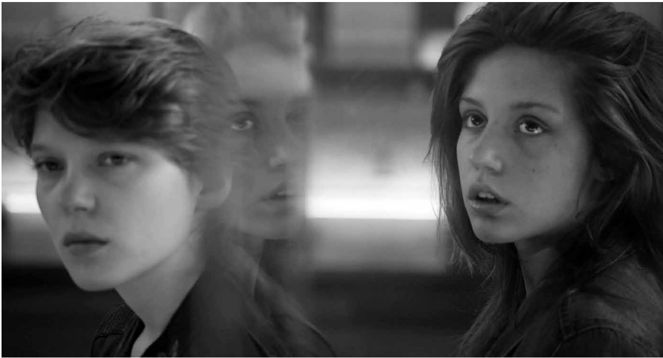
D'une nullité déconcertante : « La vie d'Adèle ».