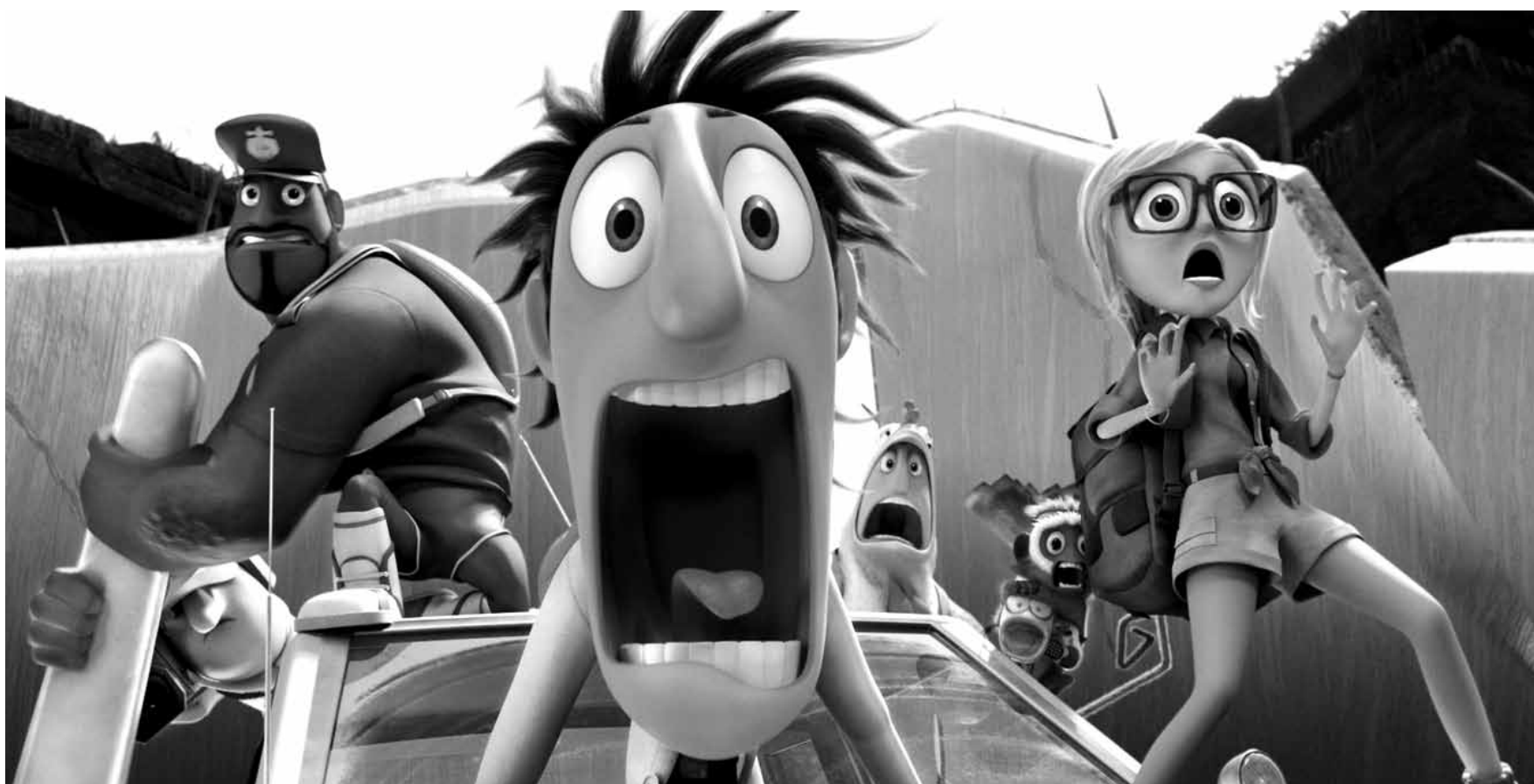
Das Erfindergenie Flint Lockwood muss neue Aufgaben meistern in „Cloudy with a Chance of Meatballs 2“. Neu in den Kinos.