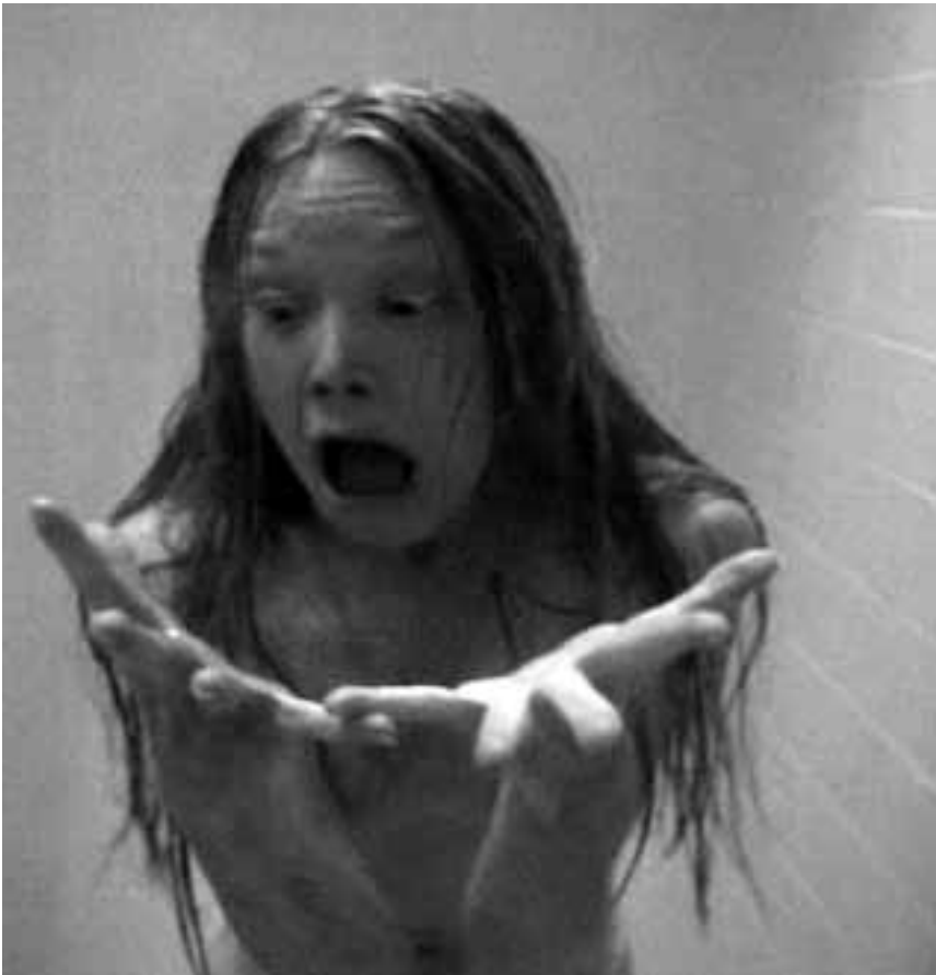
Pour les comparatistes : ce dimanche, la Cinémathèque montre la première version de « Carrie », réalisée par Brian de Palma en 1976.

Isabelle et son frère Théo, restés seuls à Paris pendant les vacances de leurs