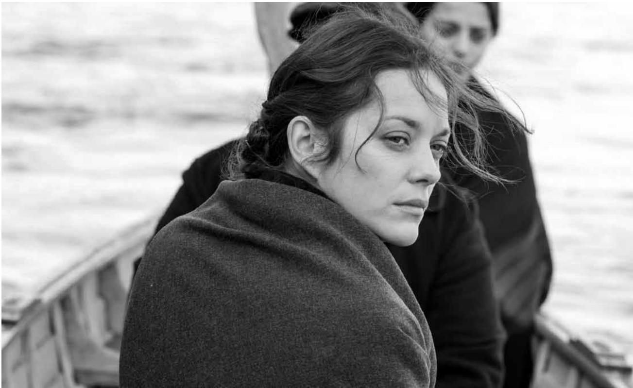
Eine Schwalbe macht noch keinen Sommer. Selbst mit einer Oskar-prämierten Schauspielerin wie Marion Cotillard kann es in die Hose gehen, wenn Drehbuch und Regie versagen.