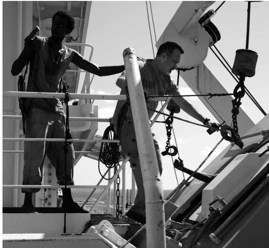
Ein Piratenfilm, aber bestimmt kein lustiger ... „Captain Philipps“, mit Tom Hanks. Neu in den Kinos.

Peeta und Katniss haben die gefährlichen Hungerspiele überlebt. Die grausame Regierung unter Präsident Snow zwingt die beiden Gewinner jedoch, für Propagandazwecke zu posieren