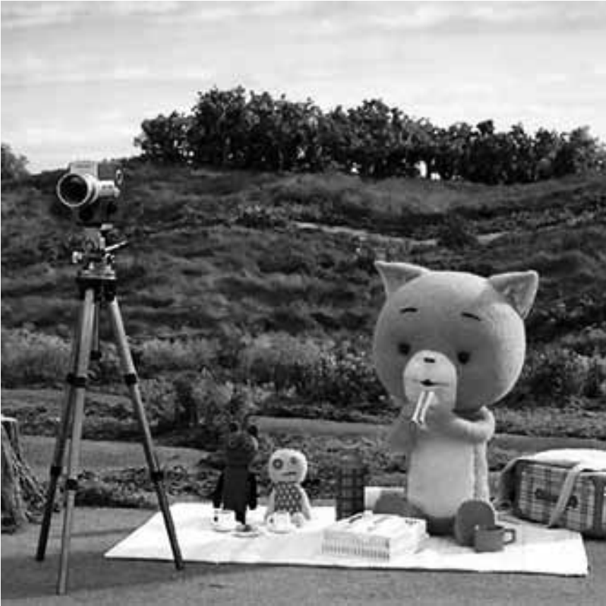
Pour les très petits - « Le petit chat curieux », de Tsuneo Goda. Ce dimanche à la Cinémathèque.

Alors que les morts dominent la surface de la terre, une base souterraine abrite un projet scientifique et militaire destiné à étudier les morts-vivants en vue d'une possible rééducation. Le Dr Logan parvient effectivement à éduquer un mort-vivant, qu'il a surnommé comme son père.