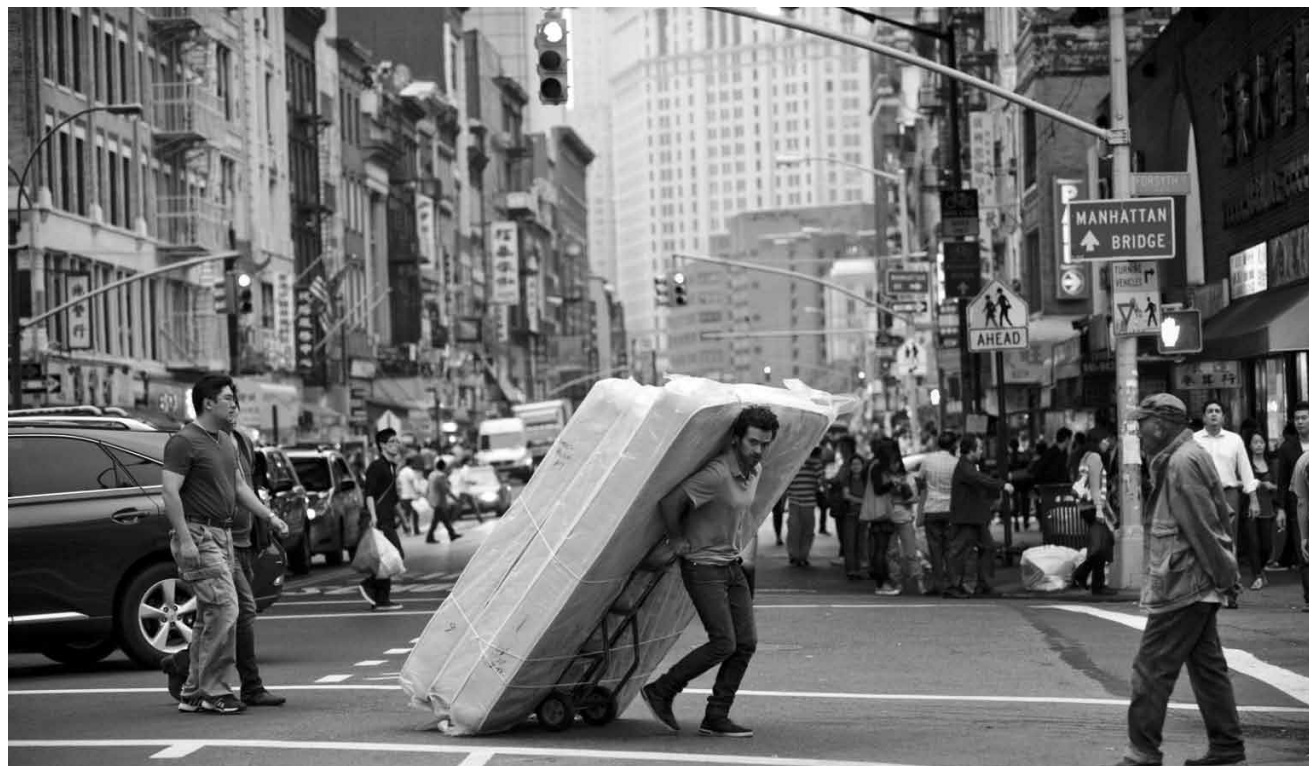
Et un troisième clap ! « Casse-tête chinois », le nouveau film de Cédric Klapisch est la dernière partie de la trilogie commencée en 2002 avec « L'auberge espagnole ». Nouveau à l'Utopia.

Σ Le film ne valait pas la peine, et on comprend mal comment un tel navet a pu remporter la Palme d'or. (lc)