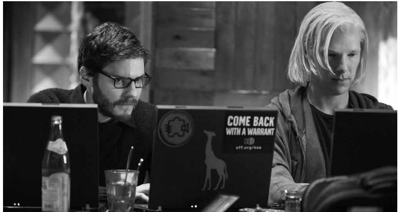
Julian Assange ist noch nicht mal tot, hat aber schon einen Biopic: „The Fifth Estate“ erzählt die bewegte Geschichte von Wikileaks. Neu im Utopolis Kirchberg.

Durch eine Prophezeiung fällt das Königreich Arendelle in einen ewig währenden Winter. Um gegen das kalte Schicksal des Reichs anzukämpfen und den Frostzauber aufzuheben, schließt sich die Königstochter Anna mit dem schroffen Kristoff zusammen, einem draufgängerischen Bergbewohner. Zusätzlich stehen ihnen noch das treue Rentier Sven und der tollpatschige Schneemann Olaf zur Seite. Ihr Vorhaben kann ihnen nur gelingen, wenn sie Annas Schwester Elsa, die mittlerweile als Schneekönigin bekannt ist, ausfindig machen und besiegen.