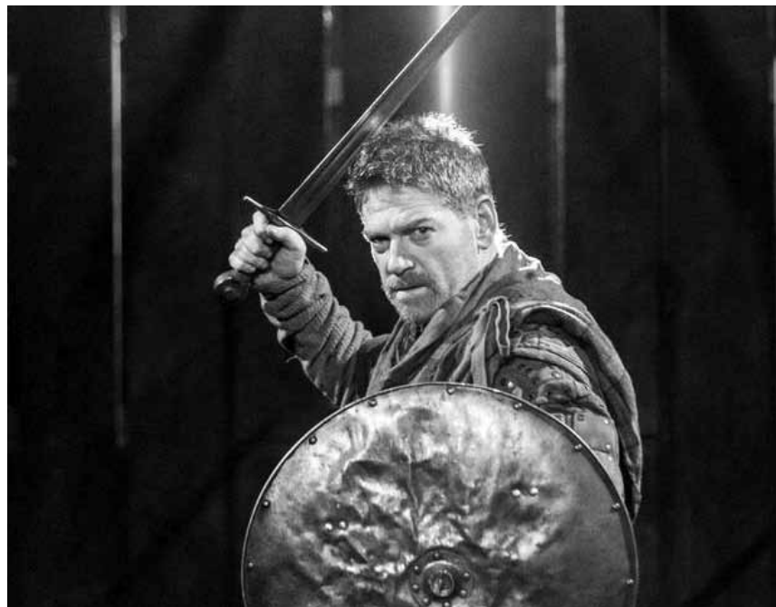
Le pauvre « Macbeth » ne sait pas comment se laver de son péché et court à sa perte. Projection à l'Utopia ce mardi de la pièce du National Theatre London, avec Kenneth Branagh.