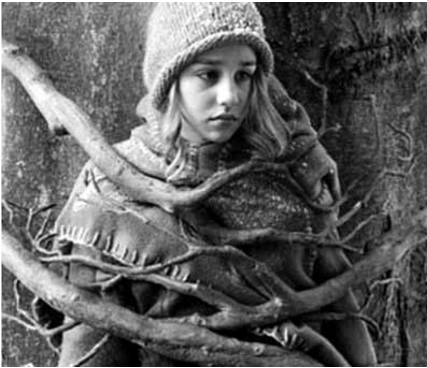
„Die Legende vom Weihnachtsstern“ ist wohl das Richtige, um auch die Kleinen in Festtagsstimmung zu kriegen. Neu im Ariston, im Ciné Waasserhaus und im Kursaal.