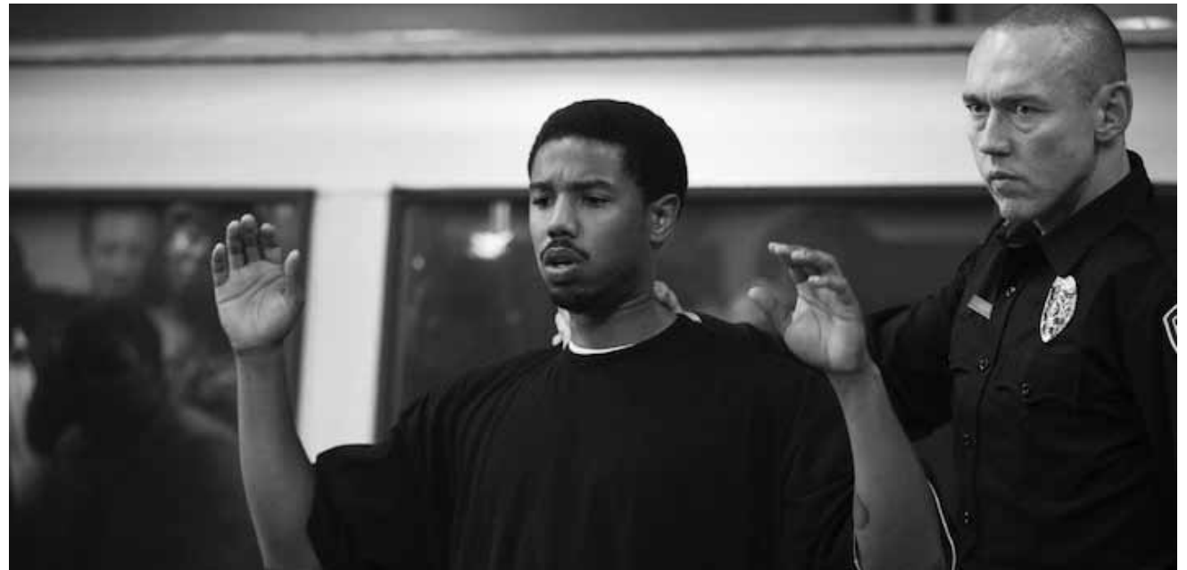
Beim Sundance-Festival ausgezeichnet: „Fruitvale Station“, ist ein Drama über Alltagsrassismus der gefährlich eskaliert. Neu im Utopia.

Hautnah und persönlich begleitet der Film die Entwicklung des Teenie-Schwarms vom Jungen zum Mann.