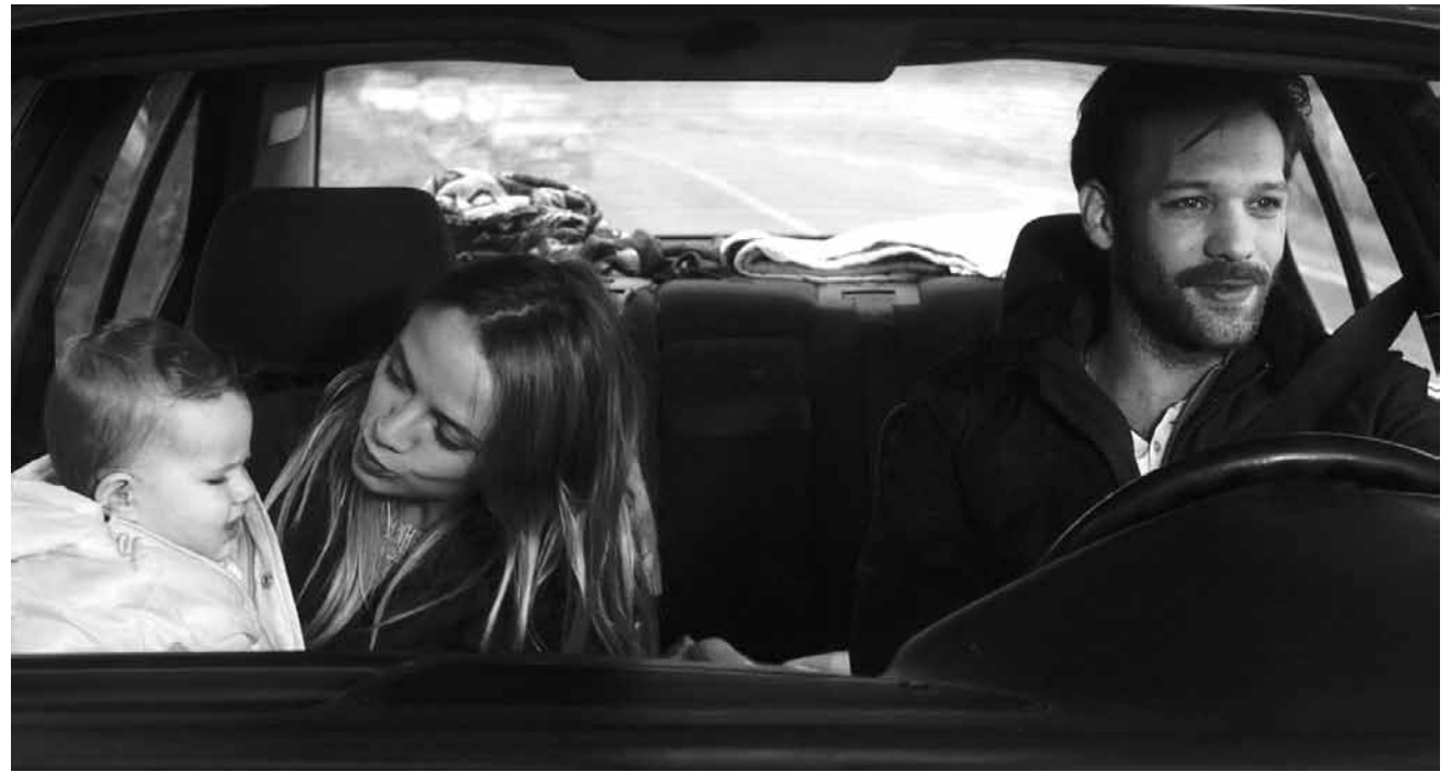
L'histoire de « Suzanne » est une tragédie entre adolescence, maternité et amour fou. Nouveau à l'Utopia.

Ça se passe là-haut, dans les Alpes là où la neige est immaculée, les chamois courent les marmottes et les sommets tutoient les nuages. Ça se