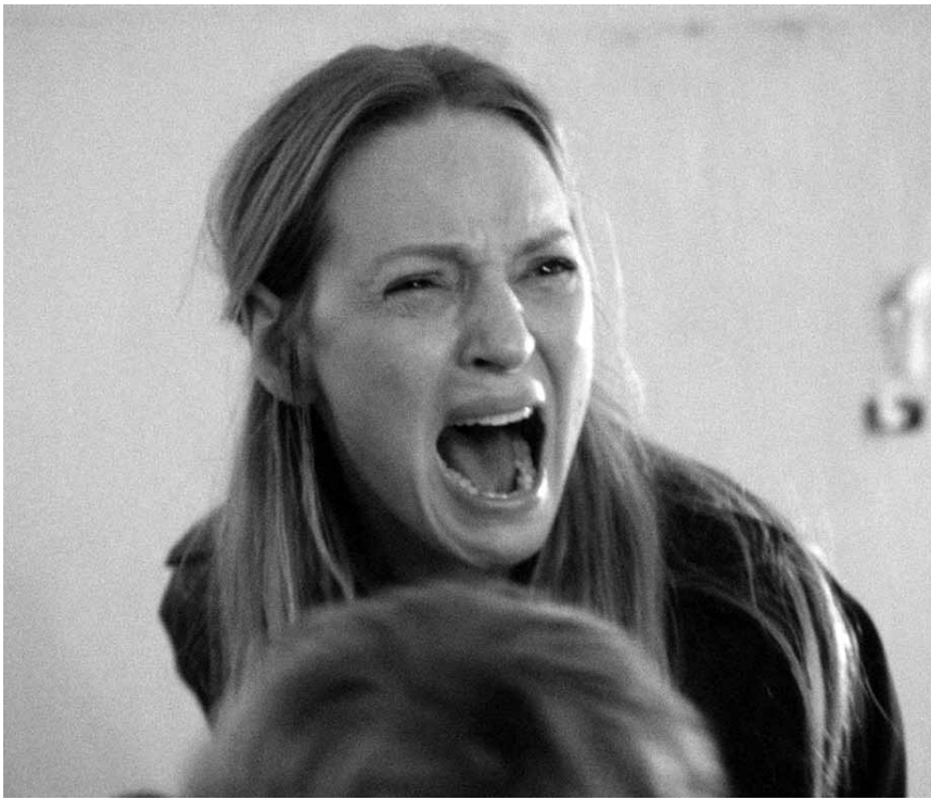
Un petit rôle pour une grande actrice : Uma Thurman dans « Nymphomaniac ».