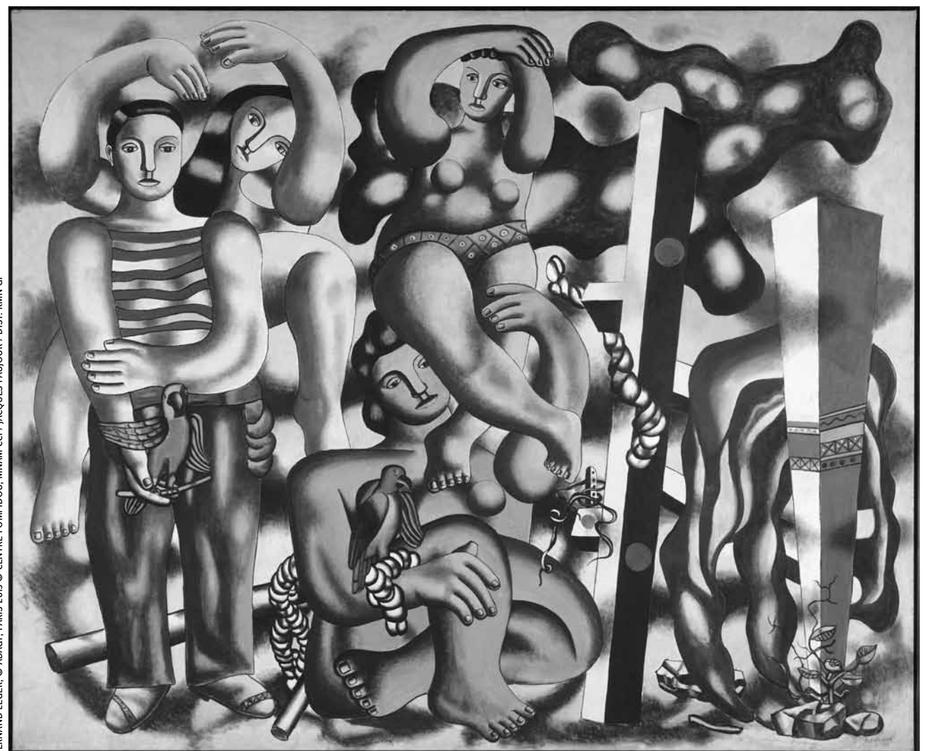
FERNAND LÉGER, © ADAGP, PARIS 2013 © CENTRE POMPIDOU, MNAM-CCI / JACQUES FAUJOUR / DIST. RMN-GP

L'exposition « Phares » est composée de plus de 1.000 oeuvres et propose ainsi une escapade à travers l'histoire de l'art du 20e siècle. A découvrir jusqu'au 1er février 2016 au Centre Pompidou.