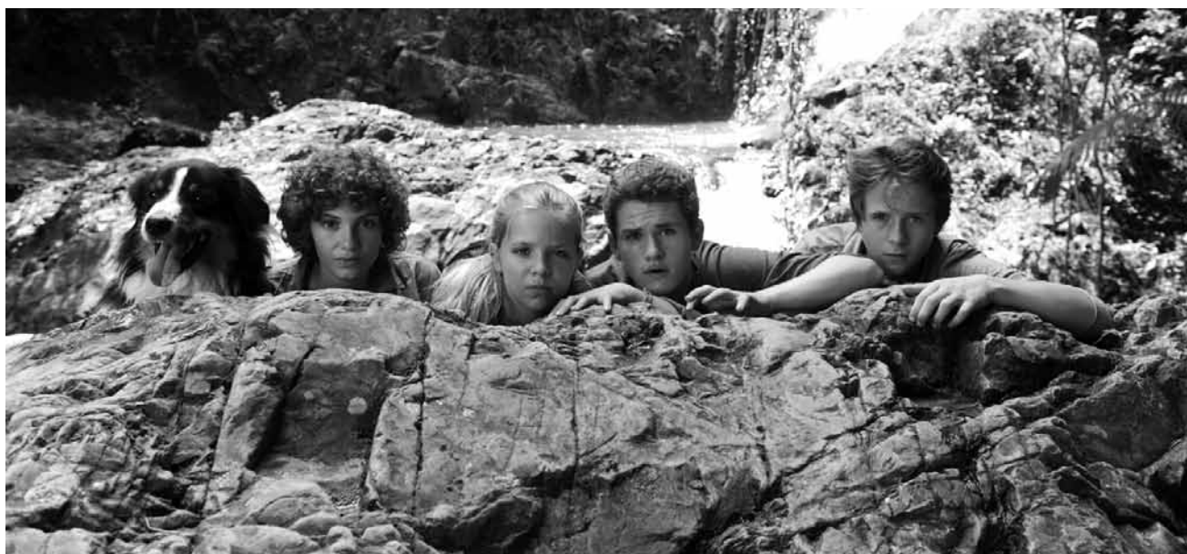
Diesmal stoßen die jungen Hobbydetektive auf ein versunkenes Schiff: „Fünf Freunde 3“, neu im Utopolis Kirchberg.

Magazins. Dem grauen Alltag versucht Walter durch Tagträume zu entfliehen, in denen er heldenhafte Abenteuer erlebt und die ganz große Liebe findet. Doch dann begegnet er seiner neuen Kollegin Cheryl und plötzlich ist die große Liebe Realität geworden. Doch Walter traut sich nicht, Cheryl anzusprechen.