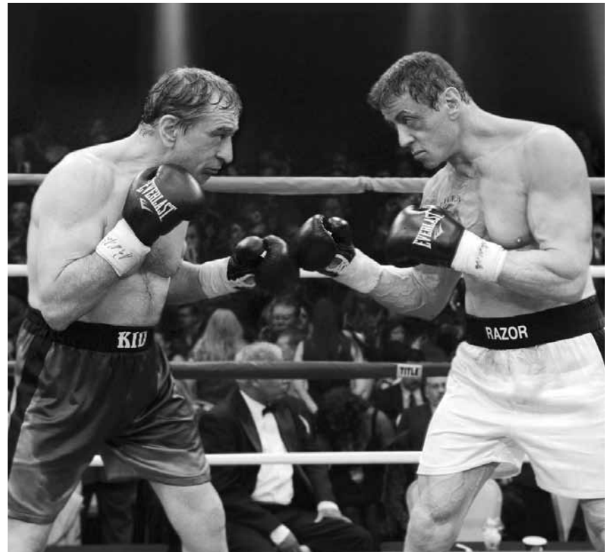
Feste druff! In „Grudge Match“ dürfen Sylvester Stallone und Robert De Niro noch mal die Boxhandschuhe anziehen. Neu im Utopolis Belval und Kirchberg.