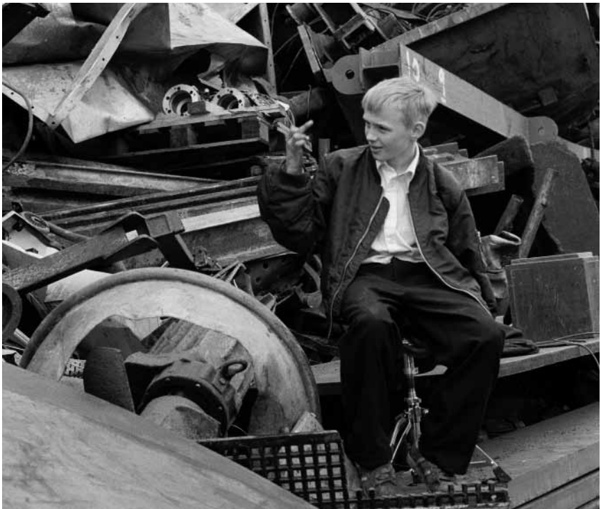
Das englische Sozialkino ist weit mehr als Ken Loach, wie Clio Barnards „The Selfish Giant“, eindrucksvoll beweist. Neu im Utopia.

Choregraphies de George Blanchine, sur les musiques de Fauré, Stravinsky et Tchaïkovsky. 150' avec deux entractes. Retransmission en direct du Théâtre Bolshoï de Moscou.