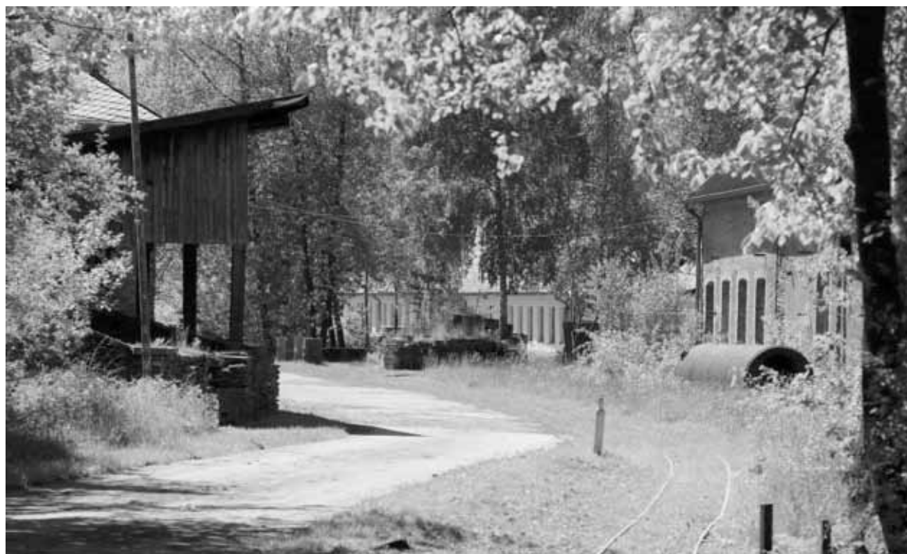
De Festival „Koll an Aktioun“ mat Musek, Streetart, Ausstellungen an villem méi fënnt den 7. an den 8. Juni am Schiefermusée zu Maarteleng statt.

My first solo , stage de danse pour adolescent-e-s à partir de 13 ans,