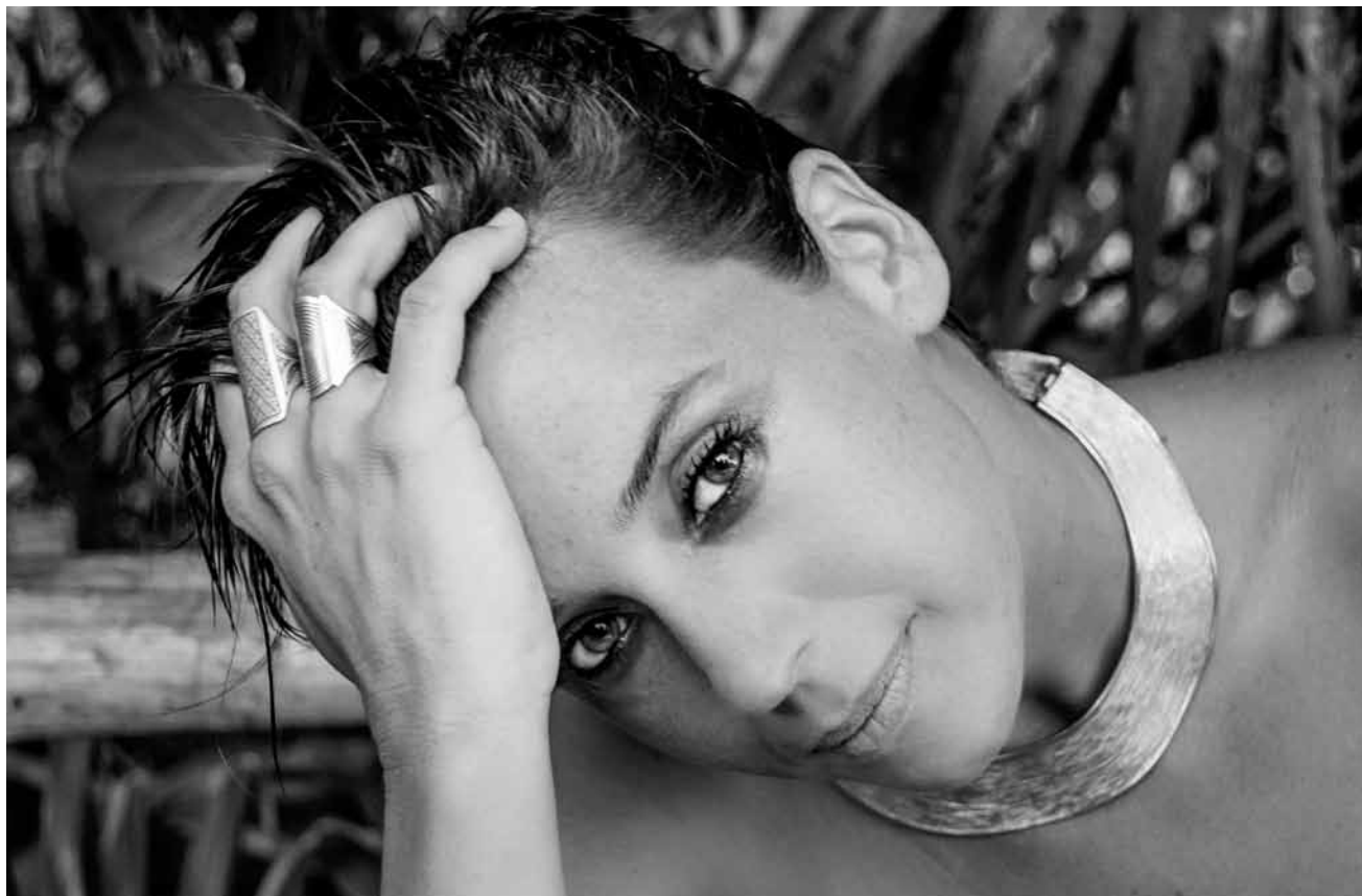
„Cat Power“ - was muss man da noch hinzufügen? Die Ausnahmesängerin wird am Sonntag, dem 1. Juni, sehnlichst in der Rockhal erwartet.

ans, Musée national d'histoire et d'art, Luxembourg, 15h (F). Tél. 47 93 30-214.