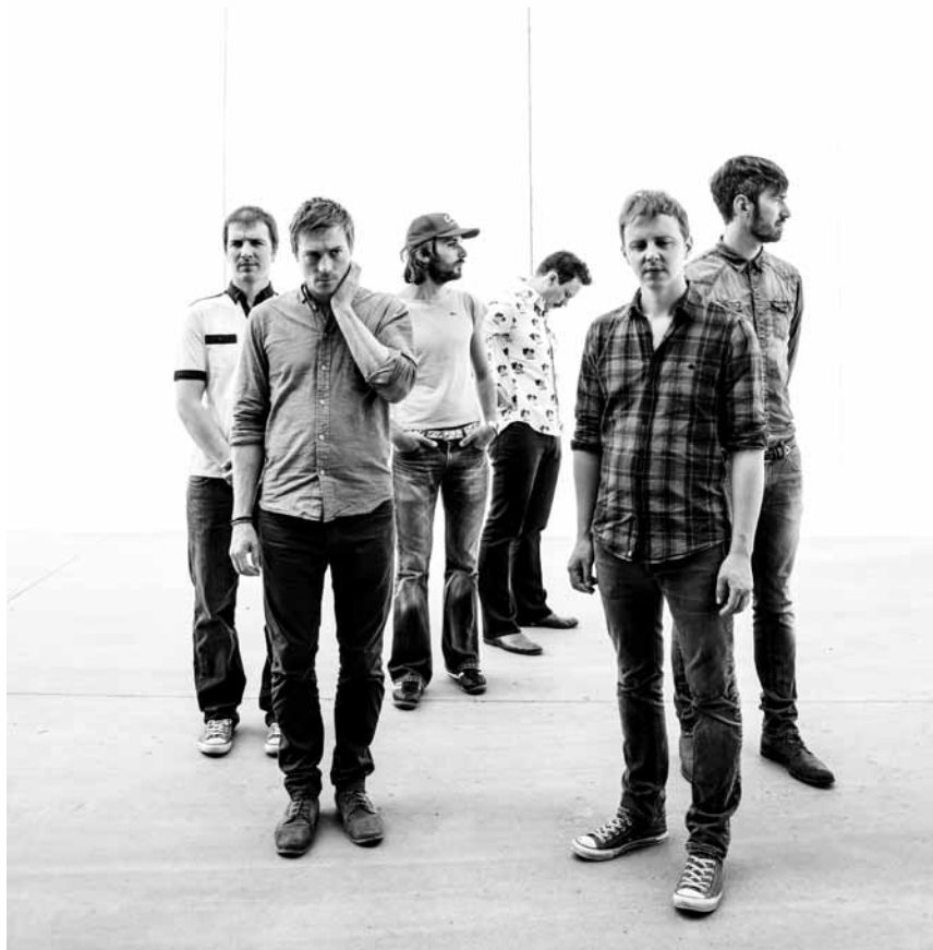
Zur allgemeinen Überraschung keine Frauen-Band : Girls in Hawaii.