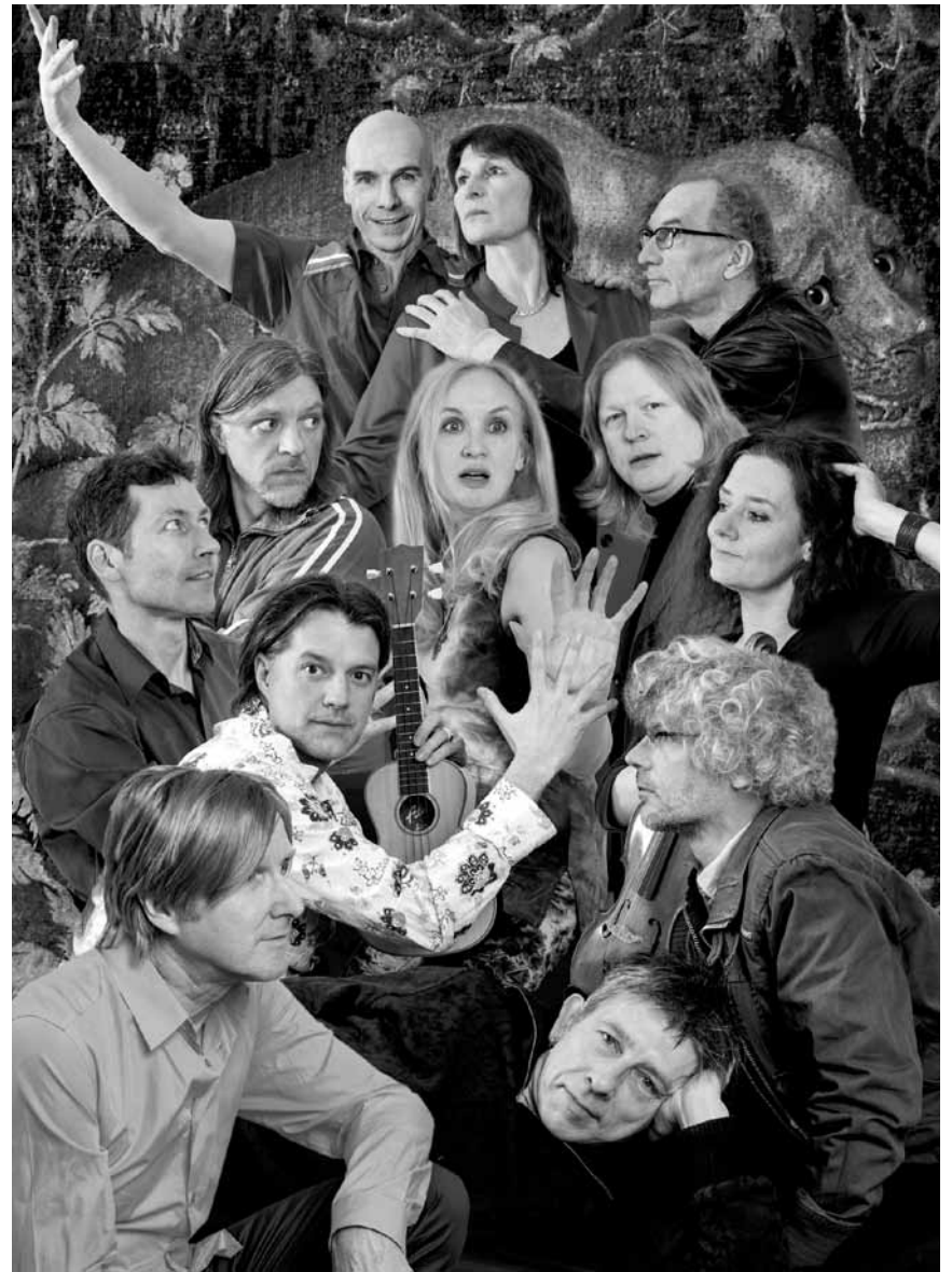
„17 Hippies“ und keiner zuviel - das Balkan-Folk und Klezmer Ensemble wird an diesem Freitag, dem 30. Mai, den Festivalclub Römerkastell in Saarbrücken zum Beben bringen.