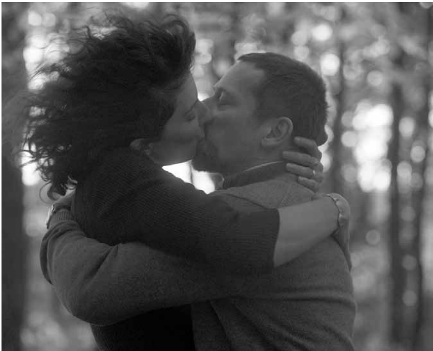
Amour, intrigues et poison : « La chambre bleue », d'après le roman de Georges Simenon. Nouveau à l'Ariston et au Ciné Waasserhaus.

zu Stein, womit sie nicht nur ihr Heimatland verlor, sondern auch ihre Güte.