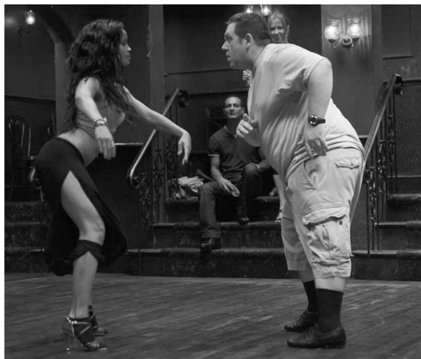
Trotz Frustspeck: Die Salsa-Leidenschaft hat ihn wieder gepackt. Nick Frost in „Cuban Fury“ - neu im Utopolis Kirchberg.

■■■■ = excellent ■■■ = bon ■■ = moyen ■ = mauvais