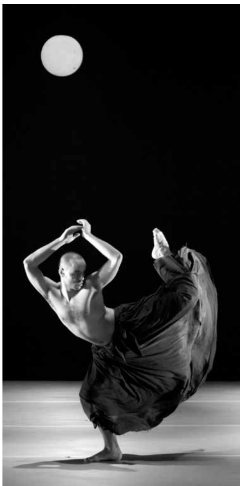
Virtuos: Die Kibbutz Contemporary Dance Company.

An diesem Sonntag, dem 5. Oktober, um 17h im Kulturzentrum Kinneksbond, Mamer.