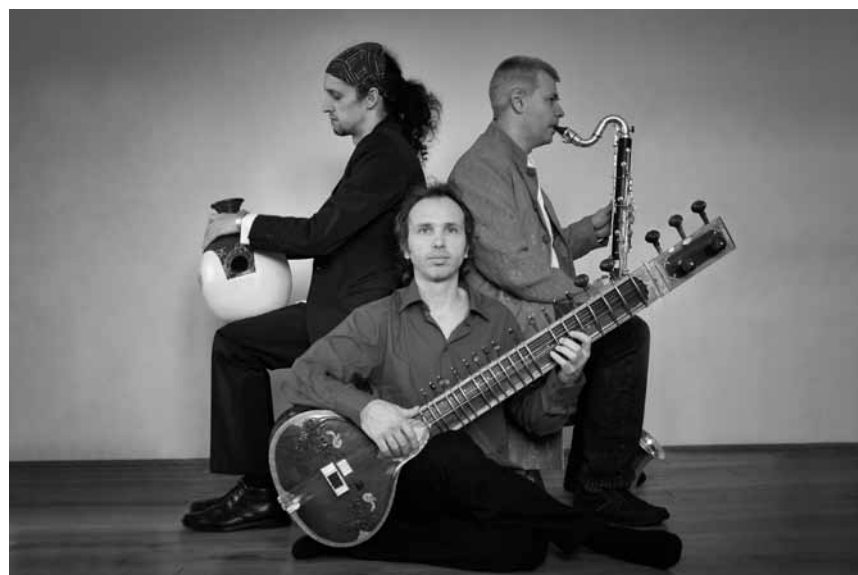
Funky Sitar ? Est-ce possible ? - Le trio « Indian Air » se chargera de résoudre la question, ce dimanche 5 octobre sur la place de l'Hôtel de Ville de Dudelange dans le cadre de la Fête des Cultures.