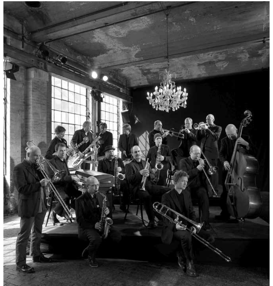
Am 3. Oktober gehts rund im CCRN - oder Neimënster, oder wie auch immer - die „hr-Bigband“ wird das Haus jedenfalls zum Swingen bringen.

Carmen , Oper von Georges Bizet, Theater, Trier (D), 19h30. Tél. 0049 651 7 18 18 18.