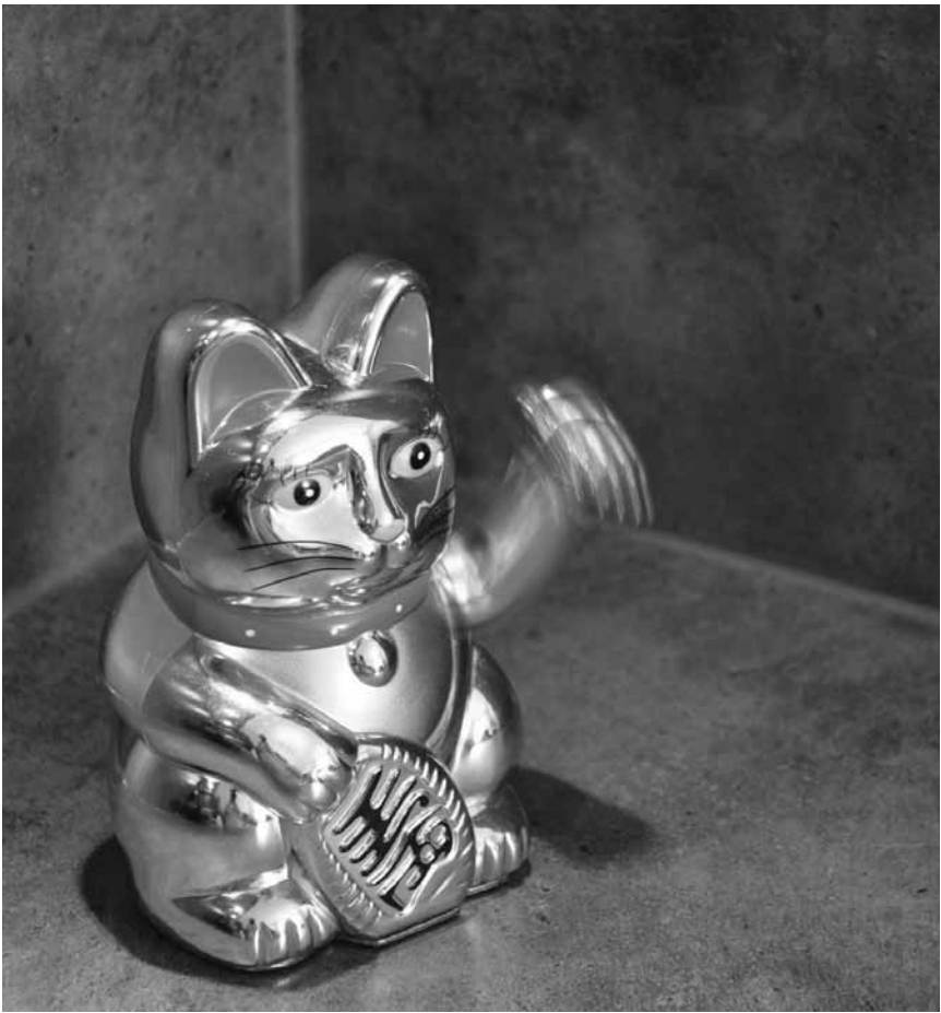
Highlight der Saison im Kasemattentheater: „Der goldene Drache“ nach einem Stück von Roland Schimmelpfennig hat am 11. November Premiere, wird aber auch noch am 14., 17. und 19. November gezeigt.

Aida, das Tufa-Musical, Tufa, Großer Saal, Trier (D), 20h. Tél. 0049 651 7 18 24 12.