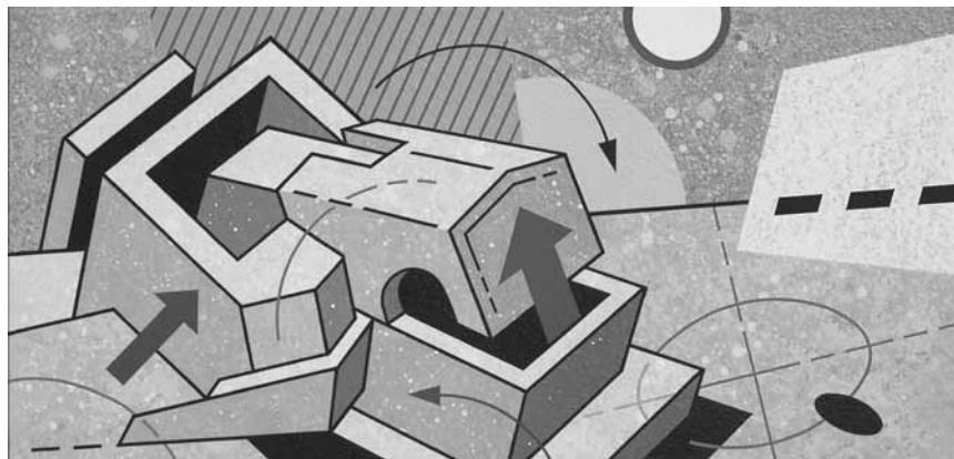
Les figures géométriques forment la base de son travail. L'artiste luxembourgeois Gilbert Peckels expose jusqu'au 30 novembre à l'Aalt Stadhaus de Differdange.