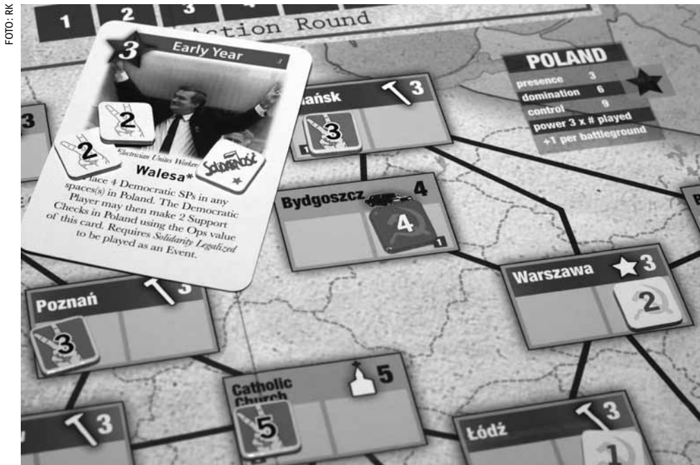
Der Mann aus Eisen. Vom Danziger Werftarbeiter zum Trumpf im Ärmel der Demokraten.