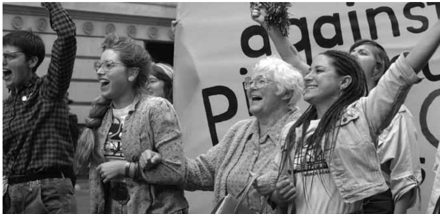
Une belle leçon de solidarité.