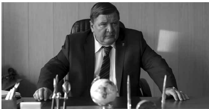
Le combat de Kolia pour un bout de terre près de la mer, au nord de la Russie. « Leviathan » - Nouveau à l'Utopia.

dans laquelle tout est opaque, jamais vraiment défini, insaisissable et éphémère. (Esther Fernandes Villela)