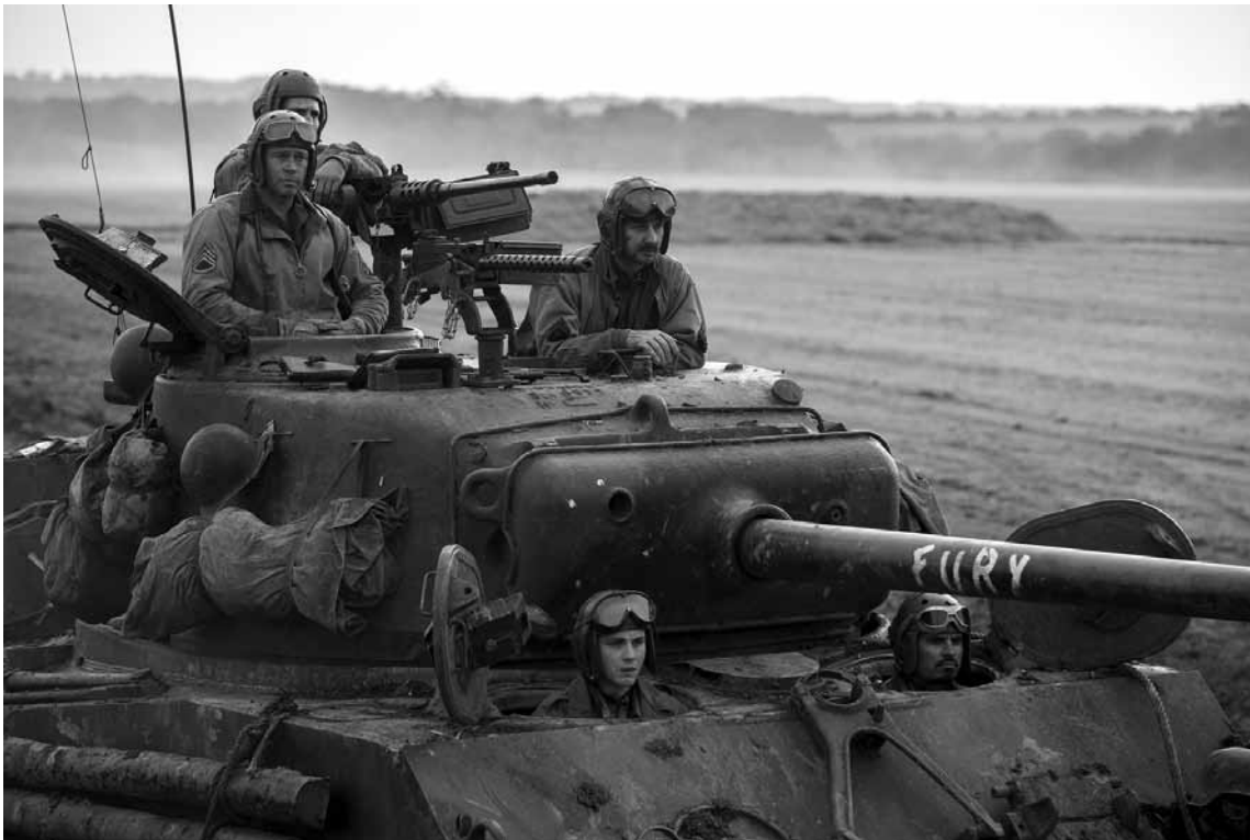
Des hommes, des vrais - l'équipe de « Wardaddy » (Brad Pitt) dans « Fury ».