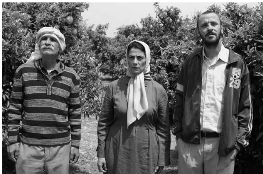
Eran Riklis stimmiges Drama „Zitronenhain“ thematisiert den israelisch-palästinensischen Konflikt. Am 7. November in der Cinémathèque.

einem Polizeikrankenhaus. Davon sehr betroffen will Woods eine Vortragsreise in die USA machen, wird aber vor dem Abflug von der Polizei festgehalten.