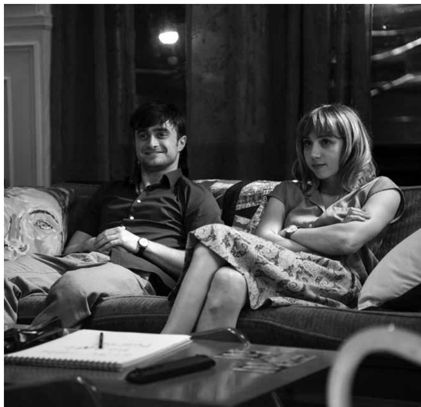
„Laß uns gute Freunde sein!“ - der Alptraum aller Verliebten! „What if“ dreht um Klischees und kommt trotzdem nicht allzu klischeehaft daher. Neu im Kinopolis Kirchberg.

Utopolis Kirchberg, Fr., Mo. + Di. 12h, 17h, 19h30 + 22h, Sa. + So. 17h, 19h30 + 22h, Sa. auch 24h.