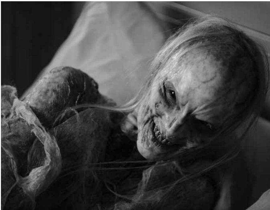
Klassisch oder subtil? In „Haunt“ muss ein Teenager feststellen, dass sein neues Heim mit einem Fluch belegt ist ... Im Ariston und im Ciné Wasserhaus.