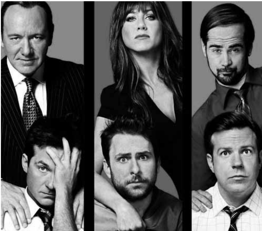
Da will man zum Unternehmer werden und der böse Kapitalismus hindert einen daran... „Horrible Bosses 2“ - neu in den Kinos.

Hector and the Search for Happiness CDN/D/GB/SA 2014 von Peter Chelsom. Mit Simon Pegg, Rosamund Pike und Toni Collette. 120'. O.-Ton, fr. + nl. Ut. Ab 6. Utopia, Sa. 21h15, Mo. 19h.