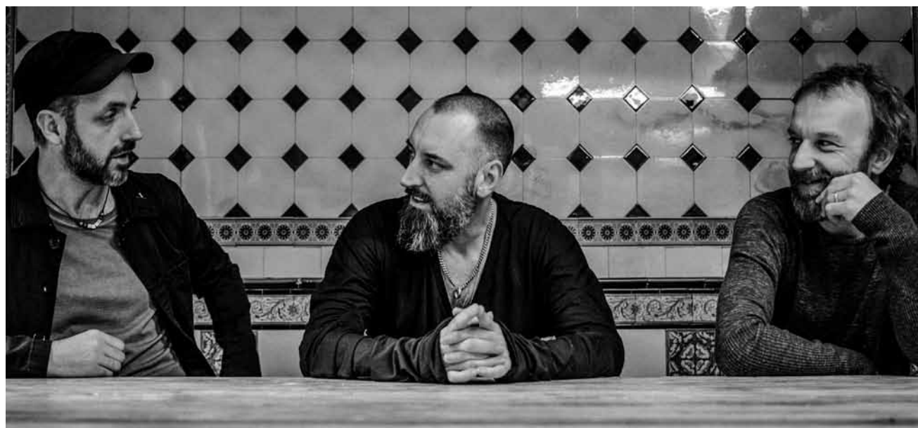
Der Bluesrock lebt ... auch wenn die Jungs von Fink ihm manchmal etwas Electronica untermischen - am 27. Februar im Atelier

Lou Koster - Suite dramatique, Ouverture légère et Waltz suite , interprétées par l'orchestre Estro Armonico sous la direction de Jonathan Kaell, salle Robert Krieps au Centre culturel de rencontre Abbaye de Neumünster, Luxembourg , 20h. Tél. 26 20 52-444.