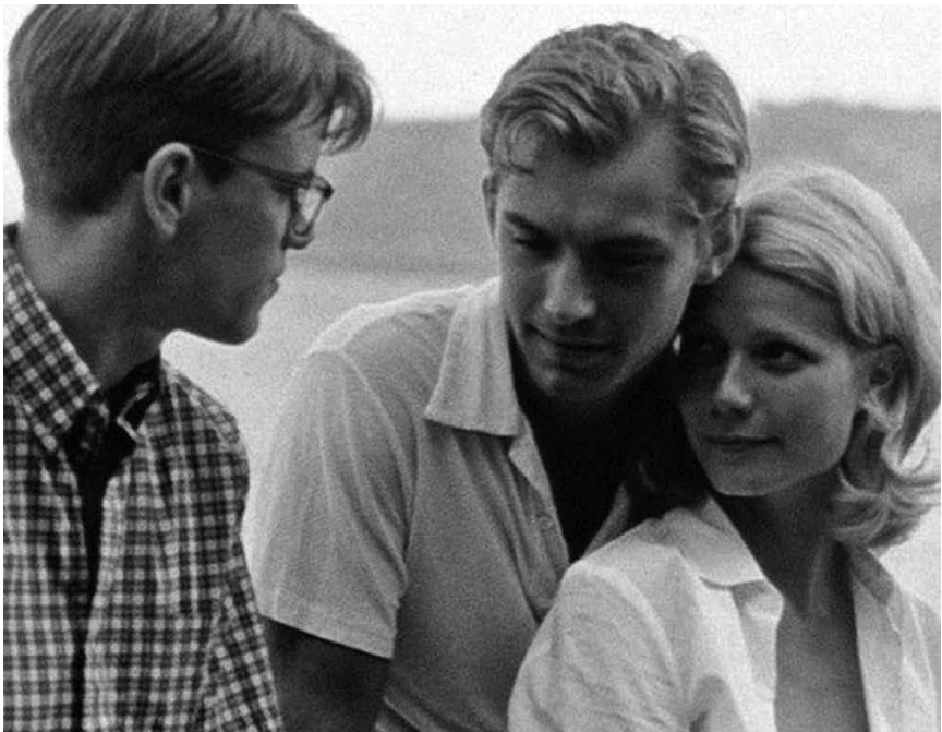
Un des films qui ont fait démarrer la carrière mondiale de Matt Damon : « The Talented Mr. Ripley » - à l'Utopia dans le cadre du cycle « Film and Popular Culture ».