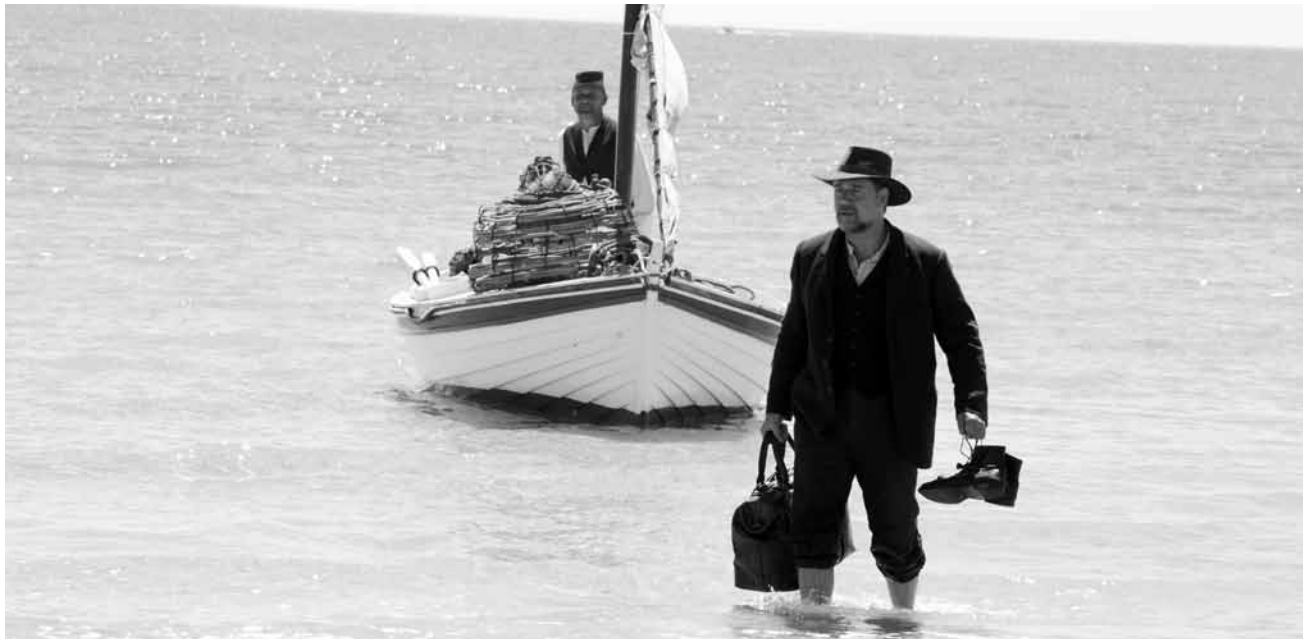
Die Suche nach seinen in der Schlacht von Galipoli verlorenen Söhnen bringt einen australischen Farmer zurück auf das Schlachtfeld: „The Water Diviner“, neu im Utopolis Belval und Kirchberg.

anschließend seinen Verletzungen erliegt, explodiert der Unmut. XX (...) le film est loin de l'hagiographie larmoyante et épique qu'on pouvait redouter en s'installant dans la salle. Si on y ajoute le fait que la réalisatrice (...) fait osciller son film entre deux perspectives (...), on obtient en principe une tranche d'histoire passionnante. (lc)