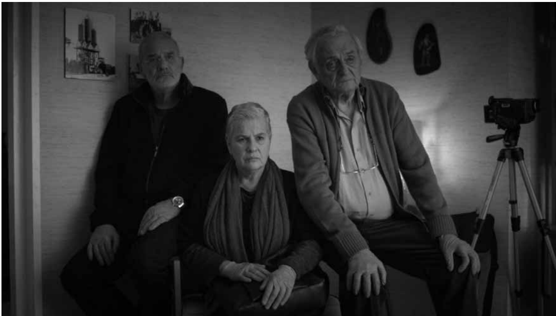
Schwerer Stoff, witzig umgesetzt - „Mita Tova“ glänzt mit schwarzem Humor.