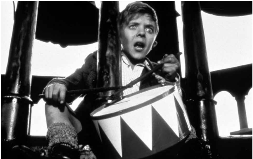
Für die einen ein Kindheitstrauma, für andere wohl einer der besten Schlöndorff-Filme aller Zeiten: „Die Blechtrommel“ - nach dem Roman von Günter Grass, an diesem Sonntag in der Cinémathèque.

Am Tage ist Theresa eine gutgelaunte und erfolgreiche Lehrerin, die vorrangig mit tauben Kindern arbeitet. Nachdem sie sich aber vor kurzem in eine unglückliche Affäre gestürzt hat, die für sie schmerzhaft endete, zieht sie jetzt immer nach ihrer Arbeit durch die Bars der Stadt und versucht ihren Kummer im Alkohol zu erstickten. Dabei gerät sie in einen verhängnisvollen Kreislauf.