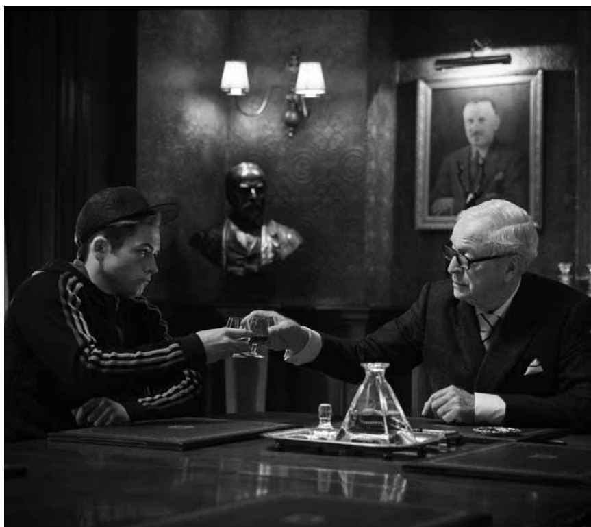
Kampf gegen die Jugendarbeitslosigkeit auf britisch : „Kingsmen - The Secret Service“ - im Utopolis Kirchberg.

d'introspection qui est propre à ce réalisateur versatile, mais aussi à cause des acteurs (...) qui ont trouvé le bon équilibre entre expression des sentiments et crédibilité. (lc)