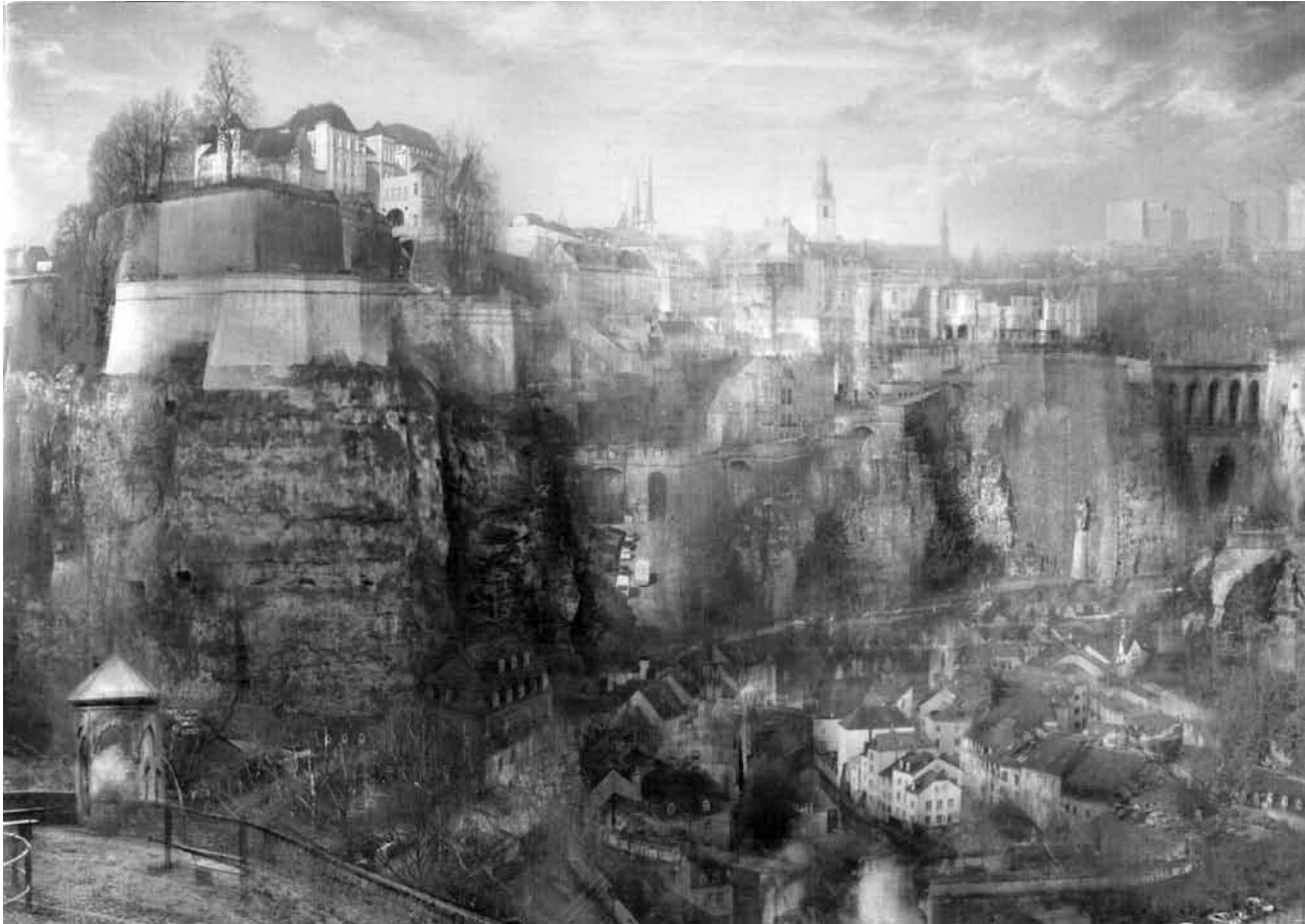
Hiroyuki Masuyama transcende de vieux tableaux en les transposant dans un contexte contemporain - son exposition « From London to Venice » est à voir à la galerie Clairefontaine jusqu'au 25 juillet.