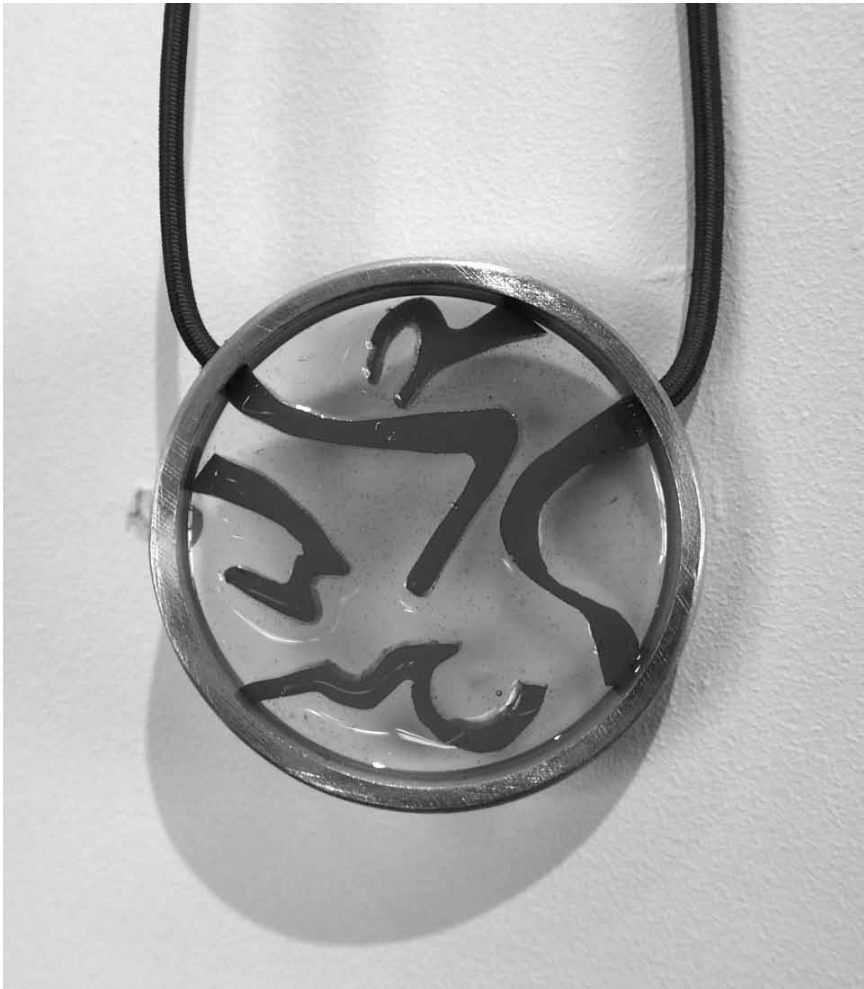
Que du beau à voir à Arlon ! L'académie des Beaux-Arts y présente ses bijoux de création à voir à... l'espace Beau Site bien sûr - et cela jusqu'au 28 juin.