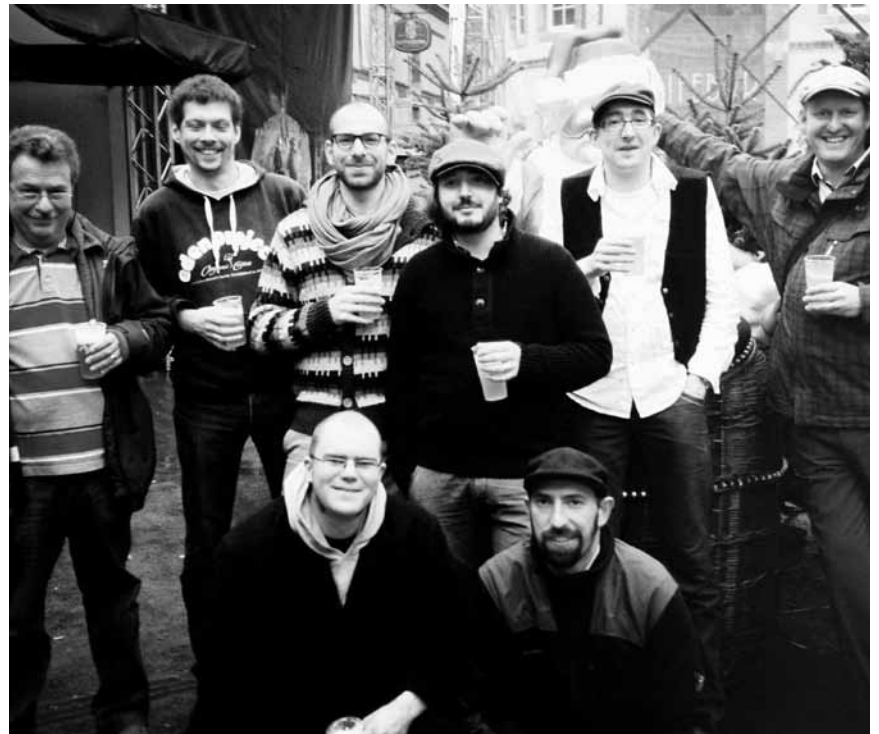
Nicht nur für Insektenliebhaber ein echter Leckerbissen: Benny & the Bugs spielen am 12. Juni zusammen mit Sabanquar Chaos Piraten, d'Strëpp vun der Fanfare „La Réunion“ und Kids an Youth on Stage im Kulturhaus Niederaanven.