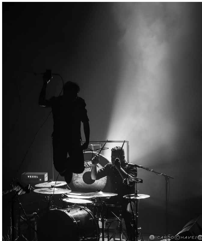
Artiste versatile et prolifique de la scène blues portugaise, The Legendary Tigerman, visitera le centre culturel Neimënster ce samedi 18 juillet.

Elastophobics , jazz, brasserie Le Neumünster (Centre culturel de rencontre Abbaye de Neumünster), Luxembourg , 11h30. Tél. 26 20 52 98-1.