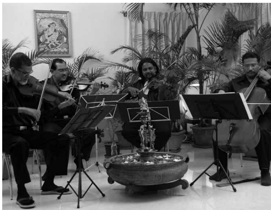
Le Madras String Quartet fait le pont entre Orient et Occident, à voir le 24 juillet au centre culturel de Cappellen.

Blues'n'Jazz Rallye , Grund et Clausen, Luxembourg , 18h.