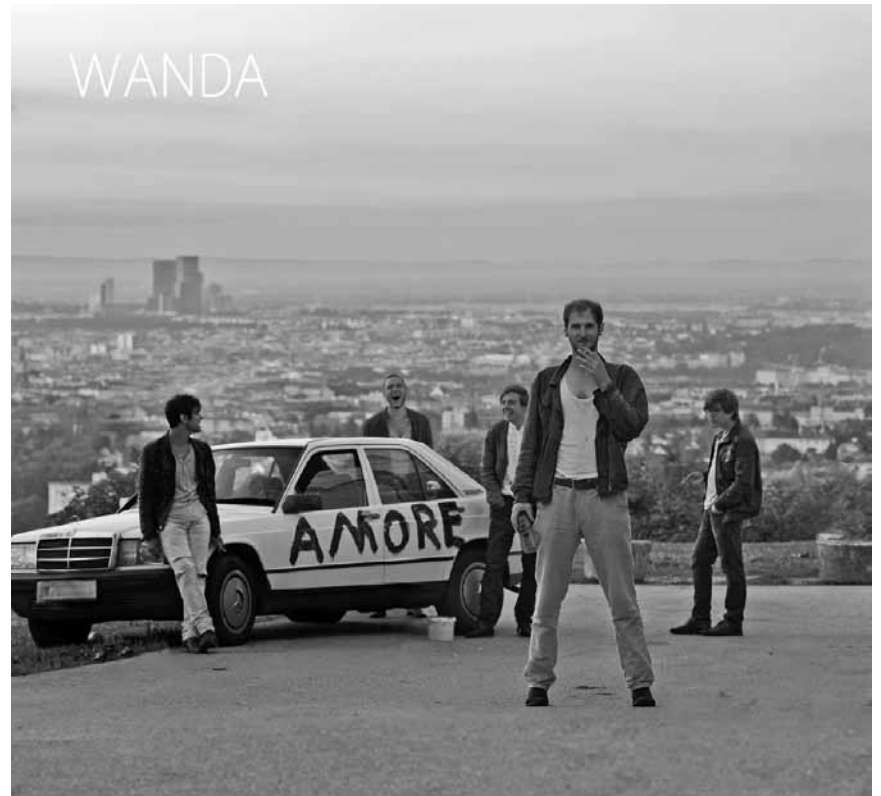
Con Amore! Wanda, la douce sensation viennoise du moment.