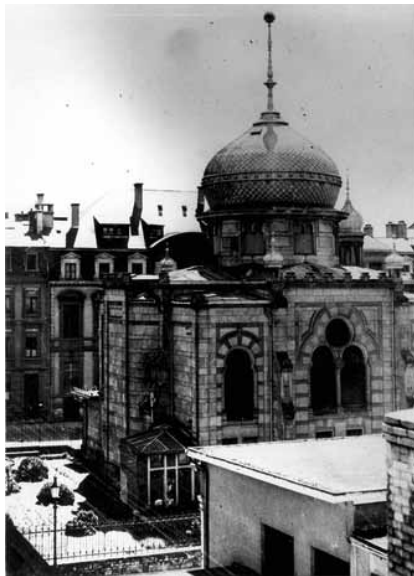
Abriss der hauptstädtischen Synagoge, 1941.