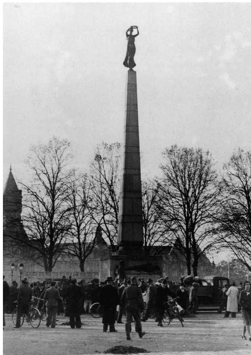
Vorbereitungen zum Abriss der „Gëlle Fra“, 18.10.1940.