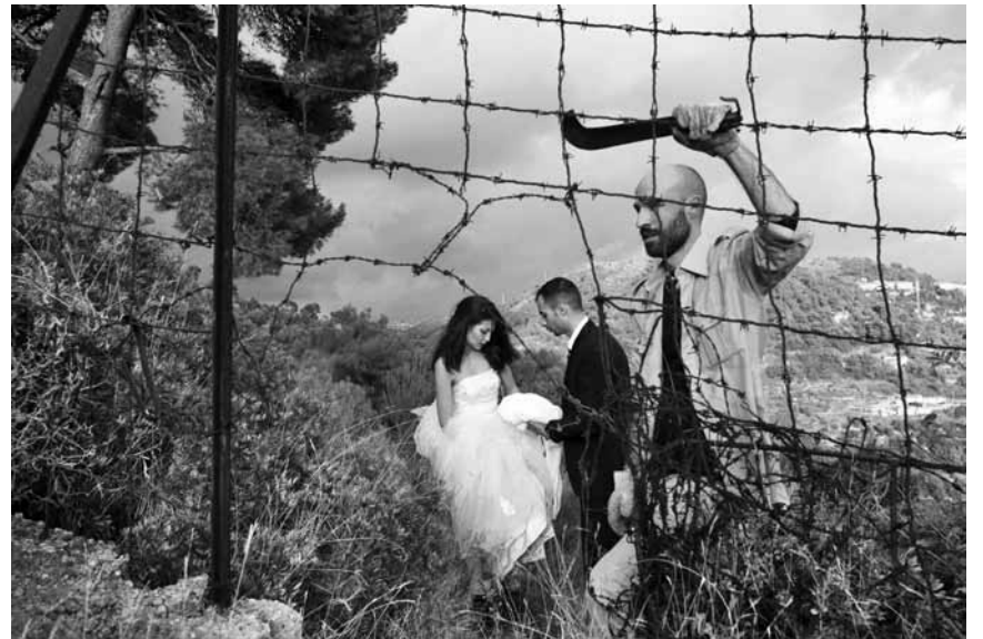
Défier la forteresse Europe en feignant un mariage : c'est l'histoire vraie à l'origine de « Io sto con la sposa », au Starlight dans le cadre du Festival du film italien de Villerupt.

Peppino vit dans un village de montagne. À Rome, les responsables politiques ne trouvent pas d'accord pour élire un nouveau président de la République. Pour temporiser, les parlementaires glissent dans l'urne des noms farfelus, jusqu'au moment où Giuseppe Garibaldi obtient la majorité. Or il y a bien un Giuseppe Garibaldi vivant, qui est donc élu, et ce n'est autre que... Peppino.