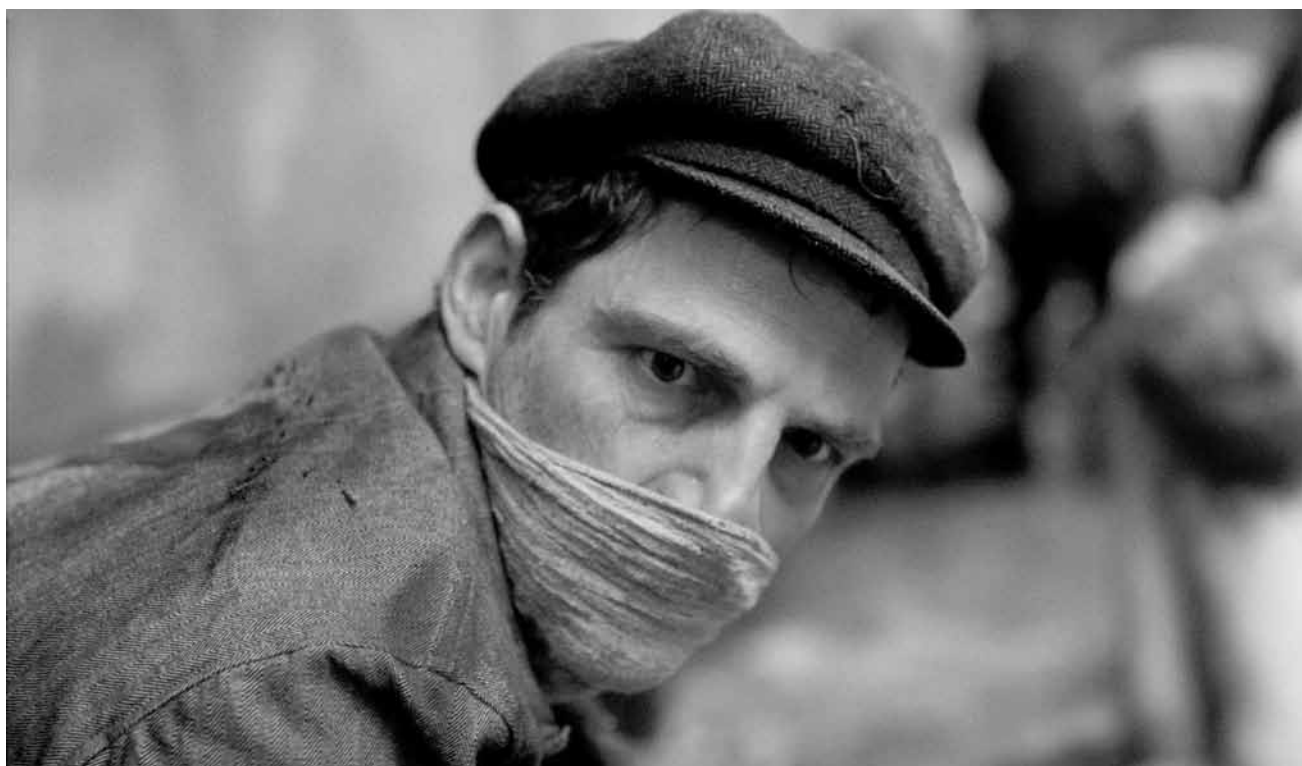
In der Hölle von Auschwitz versucht ein Gefangener seine Seele zu retten: „Saul Fia“ - unter anderem auch ausgezeichnet mit dem „Prix de la critique“ des diesjährigen CinÉast- Festivals in Luxemburg. Neu im Utopia.

le monde entier sous le nom de Peter Pan.