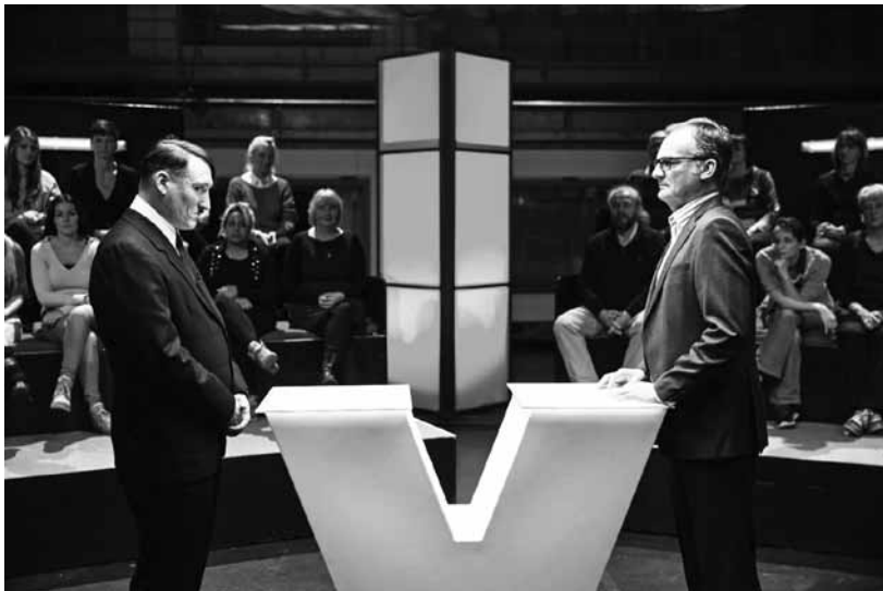
Selbst Frank Plasberg findet Hitler nur mäßig komisch.