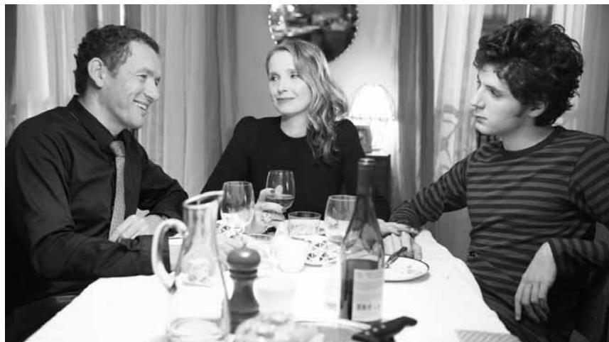
Un film sur les « first world problems » dans le monde des quadras blasés parisiens : « Lolo », nouveau à l'Utopolis Kirchberg.

Als eine junge Mutter von ihren Eltern gefragt wird, ob ihre Enkel eine Woche bei ihnen verbringen können, treten Rebecca und Tyler freudig die Zugfahrt zur abgelegenen Farm ihrer Großeltern an. Dort angekommen, verbringen die vier zunächst einen harmonischen und spaßigen Tag miteinander. Lediglich die strenge Vorgabe des Großvaters, das Zimmer nach 21.30 Uhr nicht mehr zu verlassen, lässt die beiden Kinder etwas stutzig werden. Wenig später müssen sie feststellen, dass die Regel nicht ohne Grund existiert. Als die Geschwister nachts merkwürdige Geräusche hören und deren Ursprung