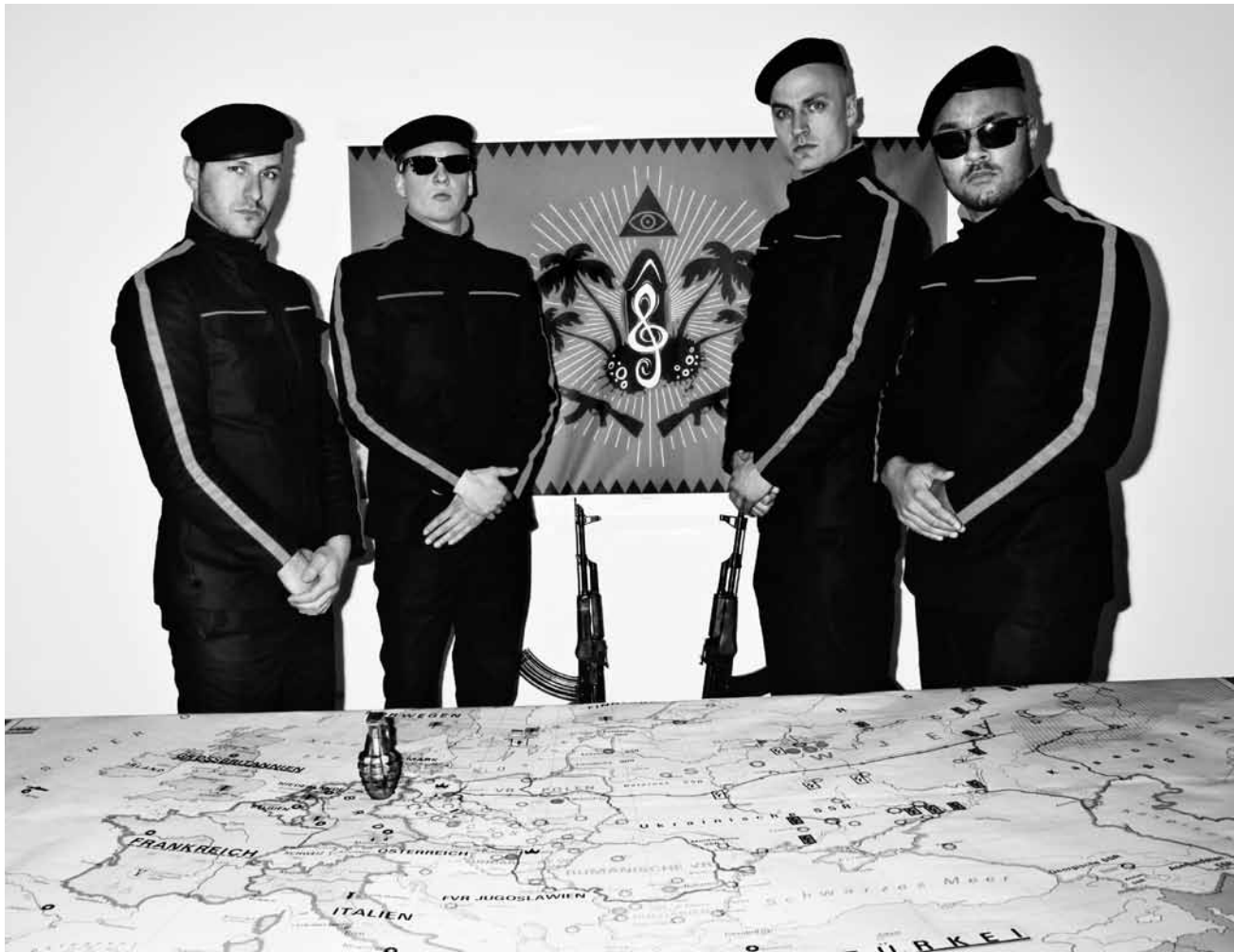
Militante Provokateure: K.I.Z.