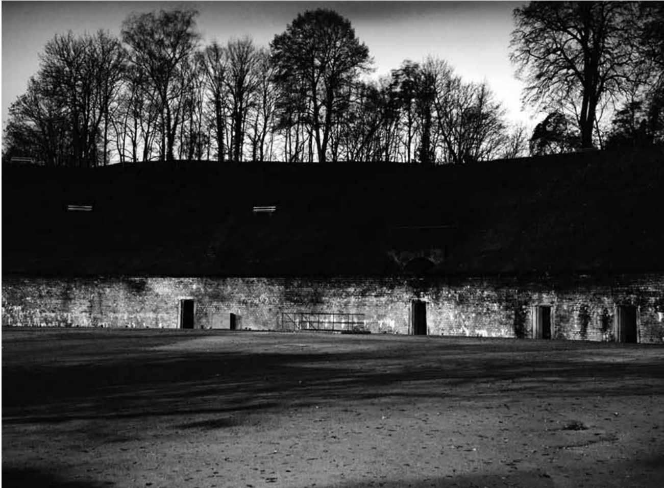
Eine neue Wissenschaft ist geboren: „Trierologie Pt.2“ von York Wegerhoff - bis zum 30. April in der Galerie der Tufa.

Yoichiro Sato : An Impertinent Innocence photographies, Sofronis Arts (12, rue Münster, tél. 621 30 05 90), jusqu'au 13.5, me. 14h - 18h, sa. + di. 11h - 18h, sur demande et réservation les autres jours de la semaine via le formulaire de contact du site www.sofronisarts.lu