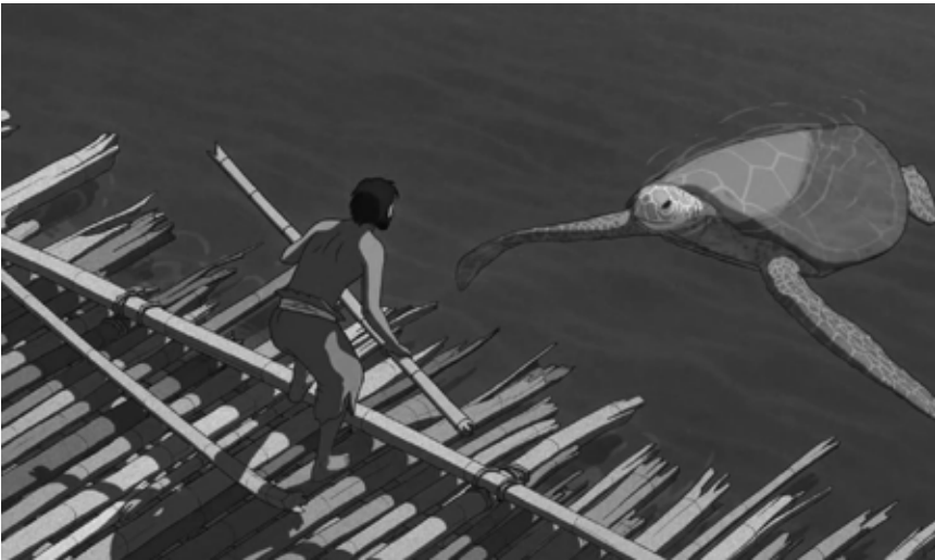
L'histoire d'un Robinson pas comme les autres : « The Red Turtle », nouveau à l'Utopia.

kennen. Es stellt sich aber heraus, dass Dima in Wirklichkeit als Geldwäscher für die russische Mafia arbeitet, nach einem Attentat auf einen Freund um sein Leben fürchtet und in England beim britischen Geheimdienst Asyl suchen will. Die Freundschaft mit dem unauffälligen und harmlosen Perry soll ihm dabei helfen. ✖ Les ficelles sont plutôt épaisses et la réalisation, à la limite du pilote automatique mode « thriller ». La musique omniprésente finit notamment par agacer dans sa volonté de forcer les sentiments. Une adaptation mineure de John le Carré donc, sans véritable esthétique ni profondeur humaine, et qui séduira au mieux les inconditionnels de l'ex-espion britannique. (ft)