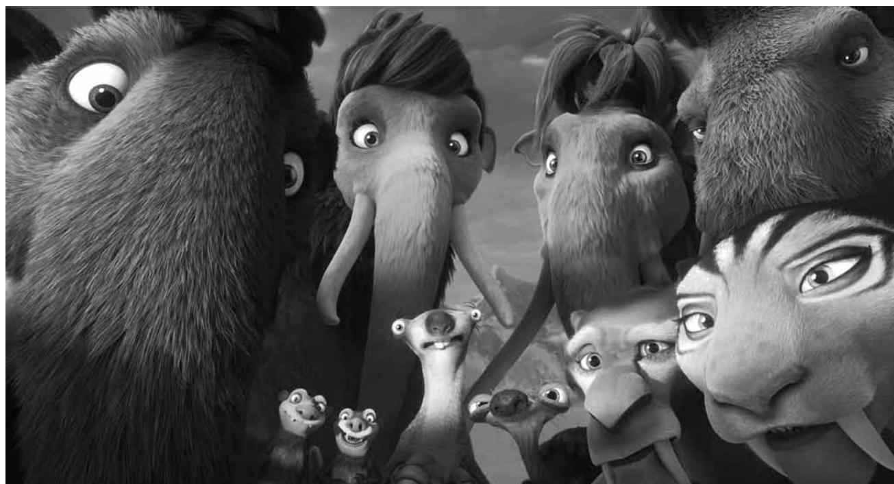
„Ice Age: Collision Course“ in der fünften (!) Fortsetzung müssen sich die Eiszeittiere mit Außerirdischen auseinandersetzen - neu in den Sälen.

Nachdem sein leiblicher Vater Li auf der Bildfläche erscheint, nimmt er Po mit in sein ebenso entlegenes wie paradiesisches Dorf voller tollpatschiger Pandas. Doch die Idylle wird durch den mit übernatürlichen Kräften ausgestatteten Schurken Kai bedroht, der sich ein fürchterliches Ziel gesetzt hat: Er will jeden einzelnen