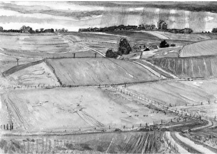
Aux amateurs de beaux prés humides : « Wet Meadowland », d'Alan Johnston, à la galerie d'art municipale de Diekirch, jusqu'au 29 mai.

The Family of Man (montée du Château, tél. 92 96 57), Clervaux, me. - di. + jours fériés 12h - 18h.