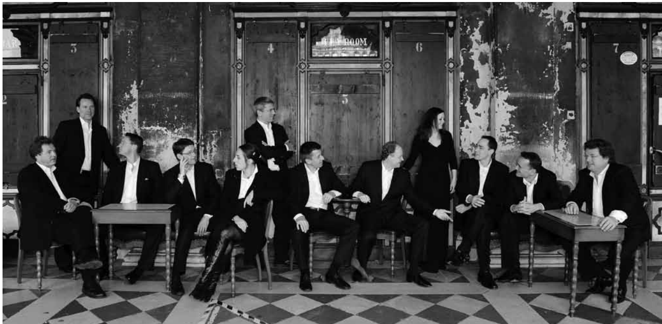
Erst öffnen „Die 12 Cellisten der Berliner Philharmonie“ am 29. Mai in der Philharmonie ihre Notenkiste für die Kleinen um dann am Abend - unterstützt vom Duo Ispasíon - für die Großen zu konzertieren.