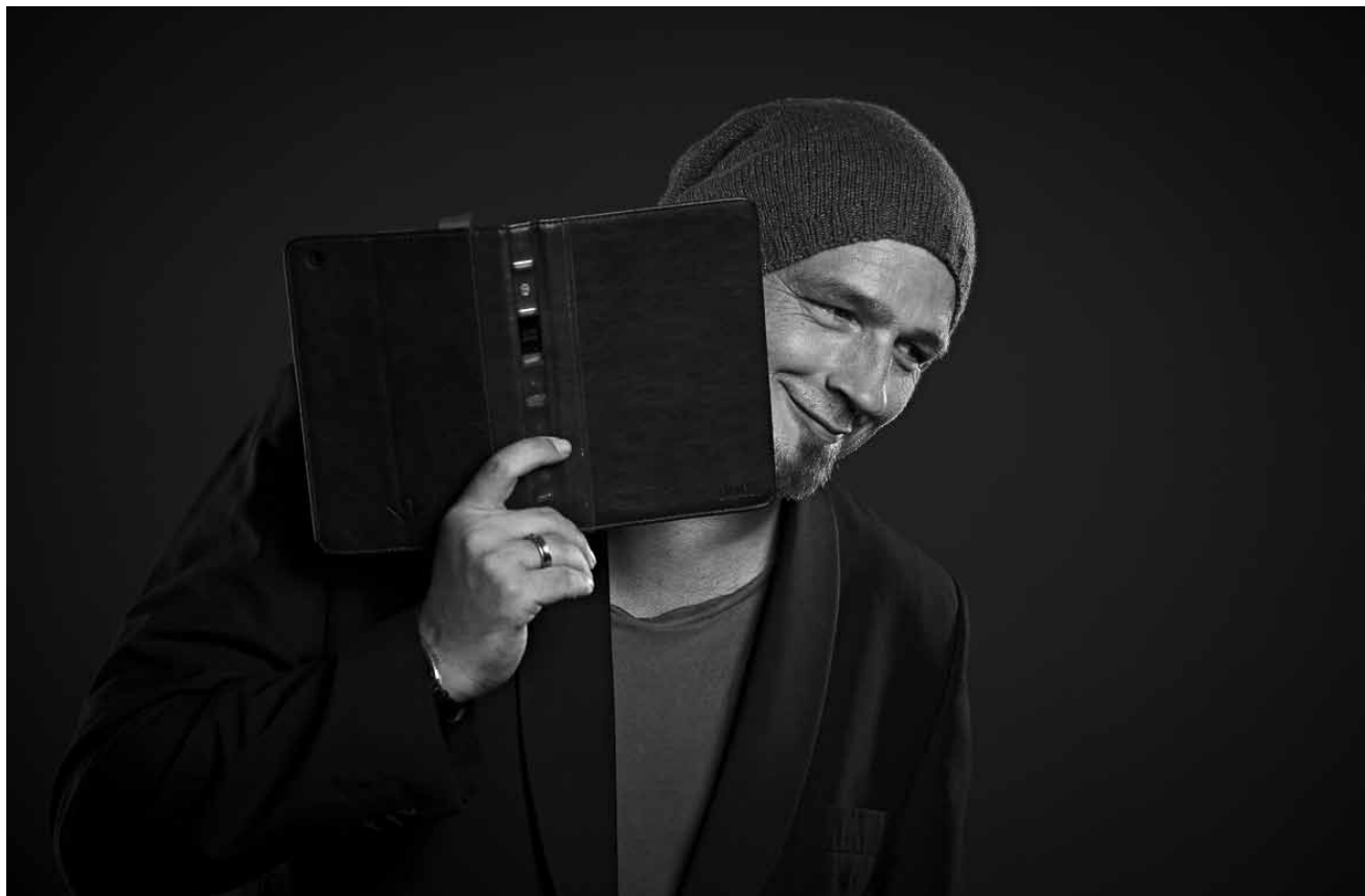
Kommt flapsig rüber, zielt aber meistens ins Schwarze: Der Comedian Torsten Sträter macht am 27. Mai im Cube 521 in Marnach halt.

Alte Feuerwache, Saarbrücken (D) , 19h30. Tel. 0049 681 30 92-0.