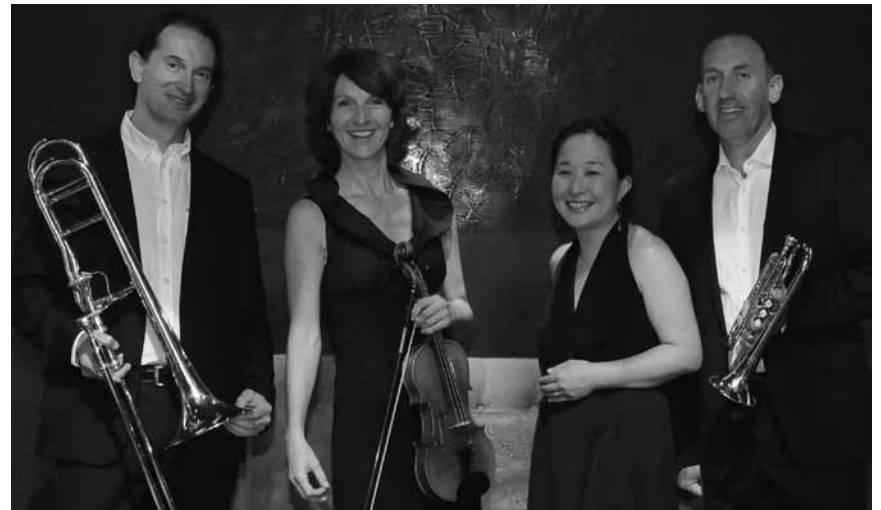
Ça bouge au Cube 521 à Marnach avec l'« Ensemble Mouvance » qui y interprétera entre autres des morceaux de Saint-Saëns et de Debussy - ce samedi 28 mai.