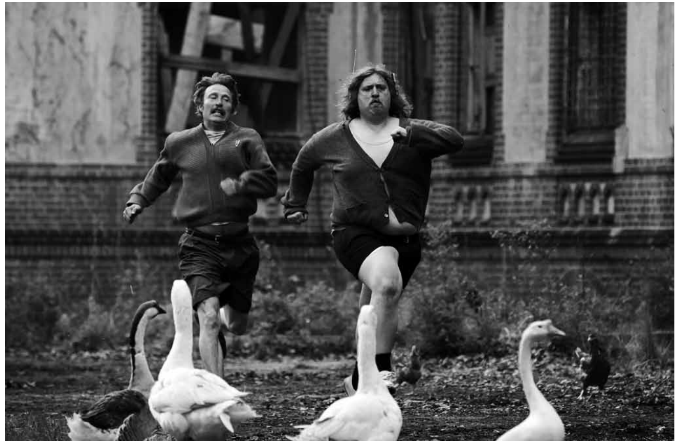
In dieser abgedrehten dänischen Komödie wird Geflügel bei weitem nicht nur geworfen: „Mænd & høns“ - neu im Utopia.

Seit Kindertagen sind Milly und Jess unzertrennliche Freundinnen und