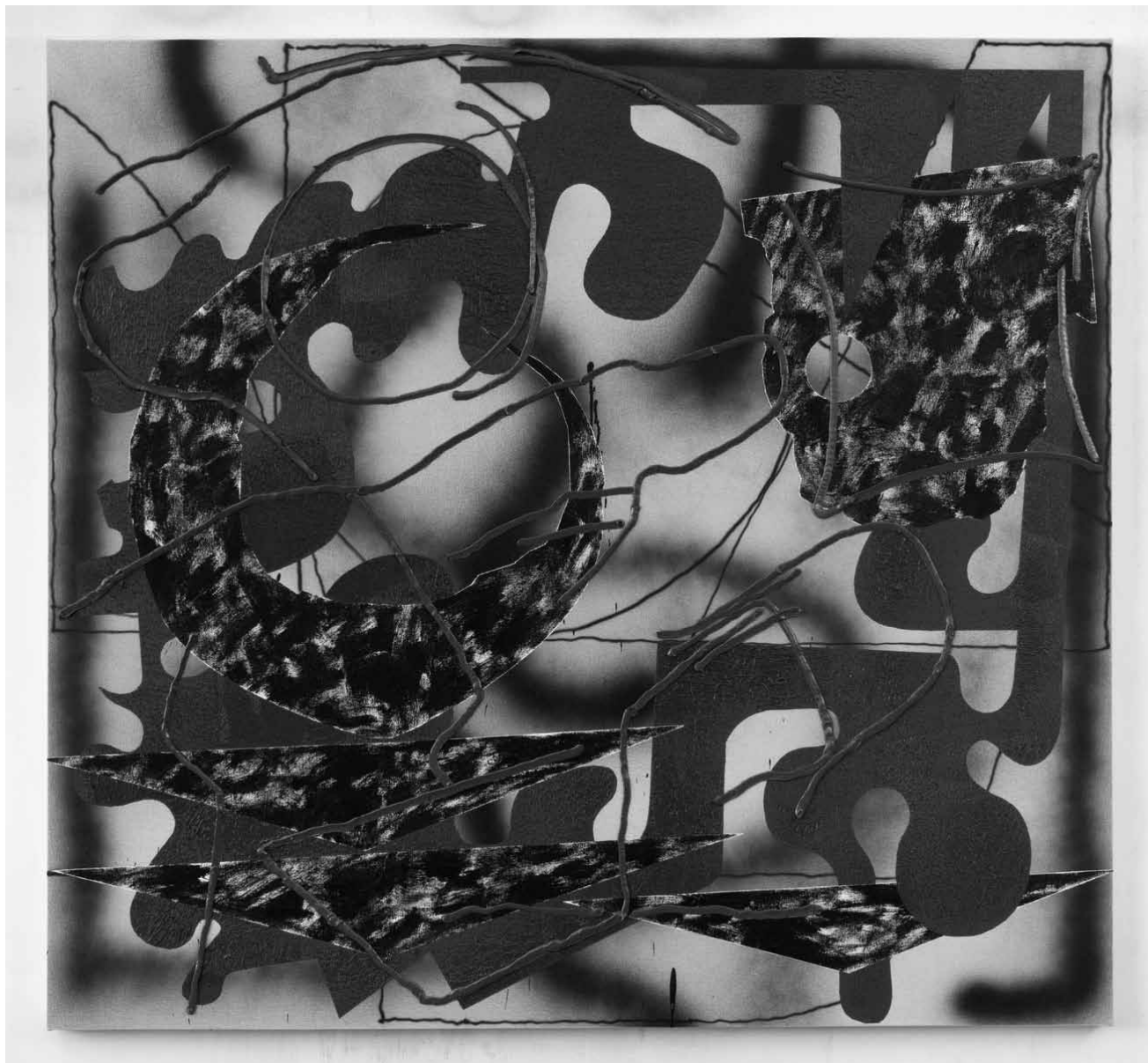
« Comsicomics » - les tableaux à plusieurs couches de l'artiste américaine Trudy Benson seront à admirer à la galerie Bernard Ceysson entre le 4 juin et le 30 juillet.

70, route d'Esch), jusqu'au 10.6, lu. - sa. 9h30 - 18h30, di. 14h - 18h.