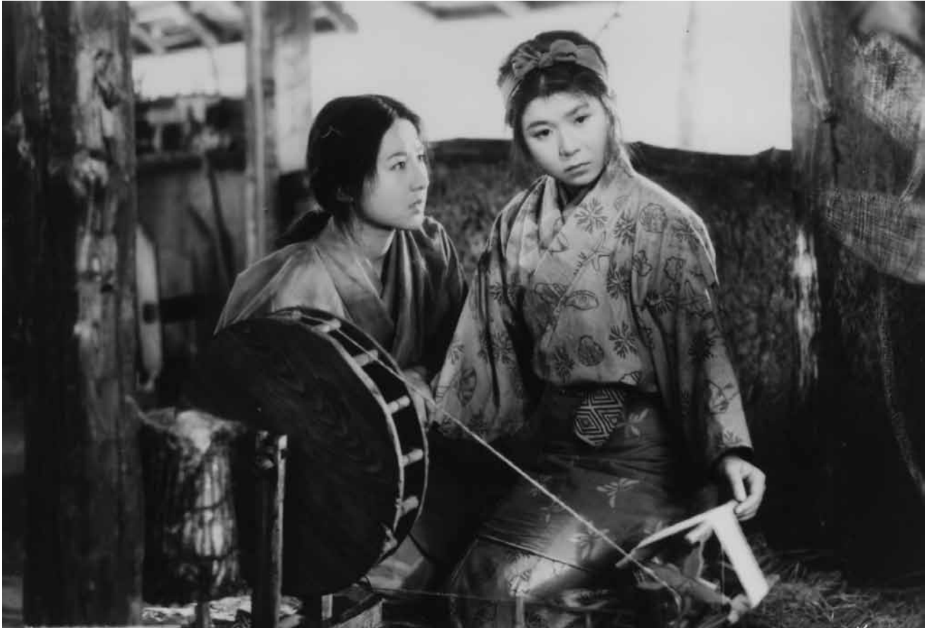
Selon Roger Ebert le meilleur film japonais de tous les temps - une affirmation que l'on pourra vérifier le vendredi 3 juin, lorsque « Sansho Dayu » passera à la Cinémathèque.

À la fin de l'ère Heian, deux enfants, le fils et la fille d'un gouverneur exilé, sont séparés de leur mère et vendus comme esclaves à un seigneur cruel et corrompu, l'intendant Sansho.