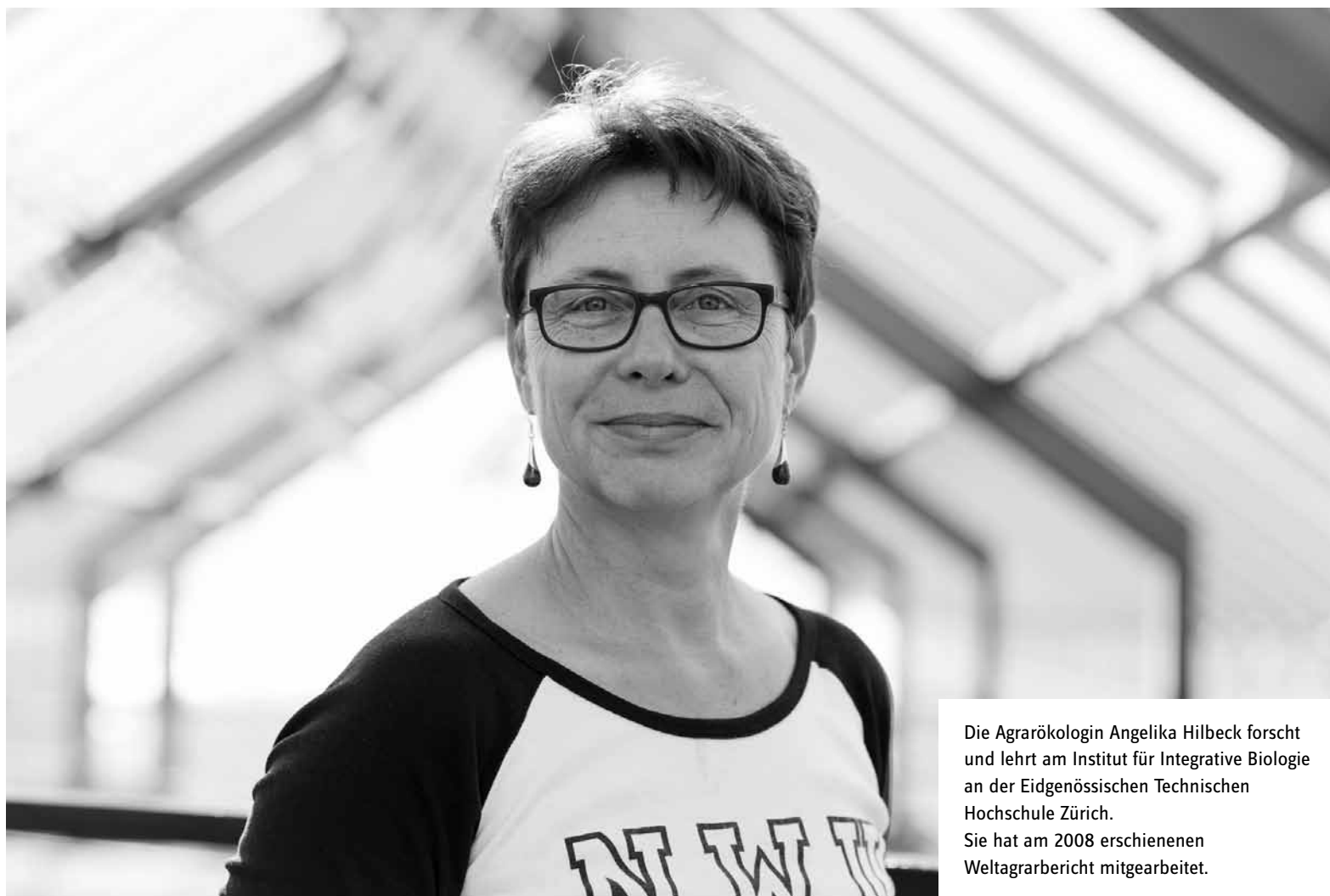
Die Agrarökologin Angelika Hilbeck forscht und lehrt am Institut für Integrative Biologie an der Eidgenössischen Technischen Hochschule Zürich. Sie hat am 2008 erschienenen Weltagrarbericht mitgearbeitet.