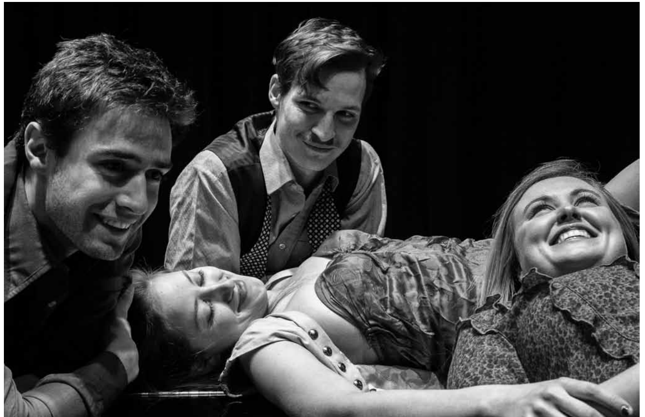
Klassiker scheinen es den Machern vom Kaleidoskop-Theater angetan zu haben: „Liebelei“ von Arthur Schnitzler, an diesem Samstag, dem 28. und Sonntag, dem 29. Mai sowie vom 2. bis zum 4. Juni auf Schloss Bettembourg.

Festival du cinéma russe pour l'enfance et la jeunesse, cérémonie d'ouverture suivie de la projection du film « Nous ne pouvons pas vivre sans l'espace » de Konstantin Bronzit, centre culturel et scientifique de Russie, Luxembourg, 19h.