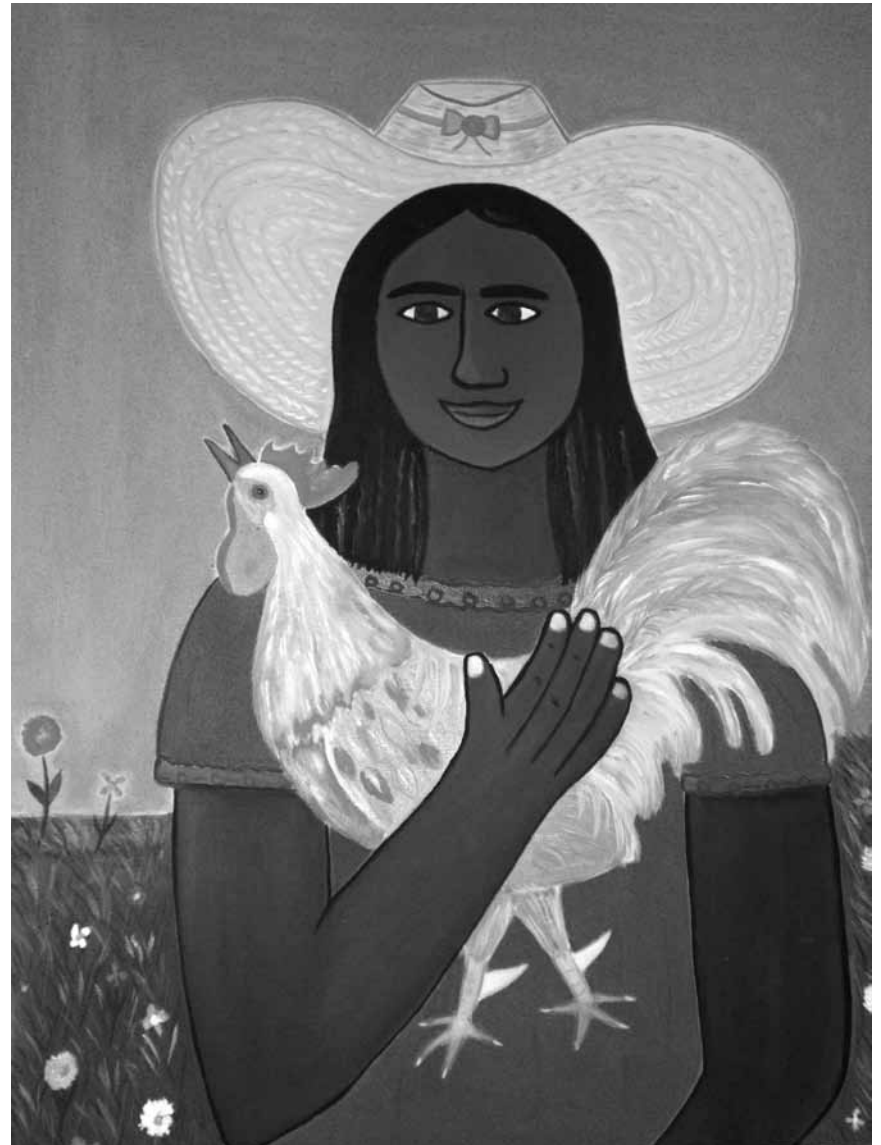
Pelly Aroche nous fait découvrir toute la beauté mystique de l'île de Cuba - à la galerie Peinture à Luxembourg jusqu'à la fin de l'année.