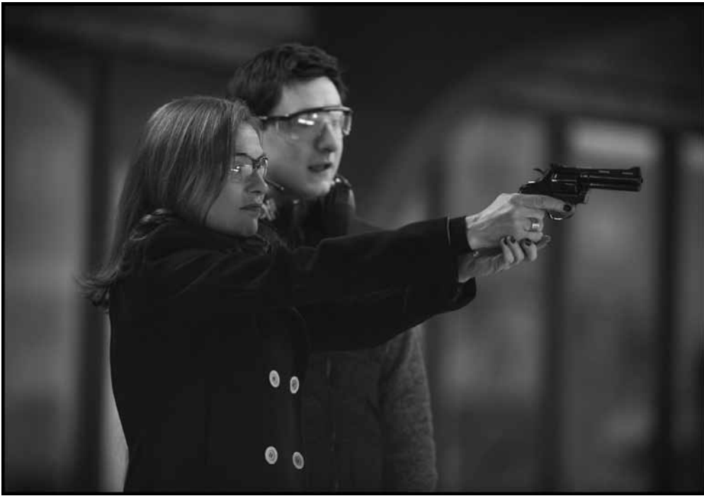
« Elle » s'entraîne déjà.