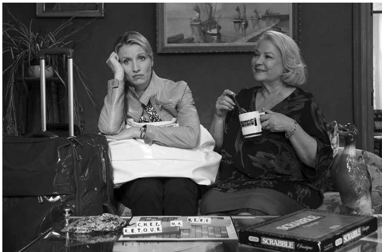
À quarante ans, Geneviève est trop vieille pour être de la « Generation What ». Et pourtant, pour elle aussi c'est « Retour chez ma mère » - nouveau à l'Utopolis Kirchberg.

✖ Les nostalgiques de la comtesse de Ségur éprouveront un certain plaisir à retomber en enfance.