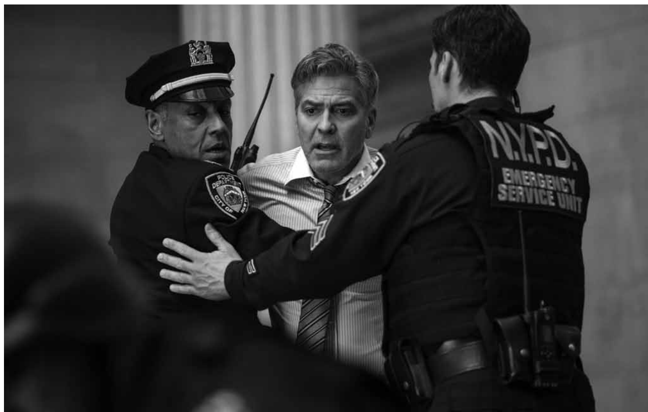
Jodie Foster, toujours efficace derrière la caméra, s'attaque dans « Money Monster » à la prise en otage en direct d'un financier de haut vol. Nouveau aux Utopolis Kirchberg et Belval.

Michèle fait partie de ces femmes que rien ne semble atteindre. À la tête d'une grande entreprise de jeux vidéo, elle gère ses affaires comme sa vie sentimentale : d'une main de fer. Sa vie bascule lorsqu'elle est agressée chez elle par un mystérieux inconnu. Inébranlable, Michèle se met à le traquer en retour. Un jeu étrange s'installe alors entre eux. Un jeu qui, à tout instant, peut dégénérer. Voir article ci-contre.