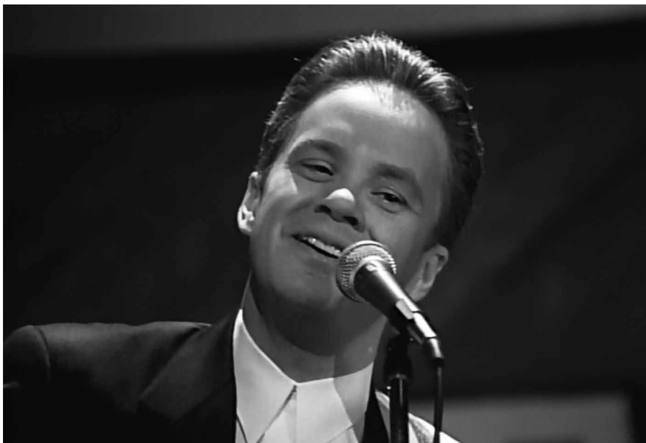
Le Coluche à la sauce américaine : « Bob Roberts », jeudi à la Cinémathèque.

en apparence, mais qui se déroule pendant une époque mouvementée.