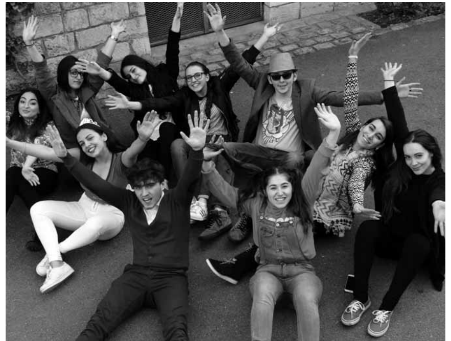
Un autre monde est-il possible ? Oui, mais peut-être pas ici : « J'ai quitté la terre », spectacle de jeunes, les 3 et 4 juin au Théâtre d'Esch-sur-Alzette.