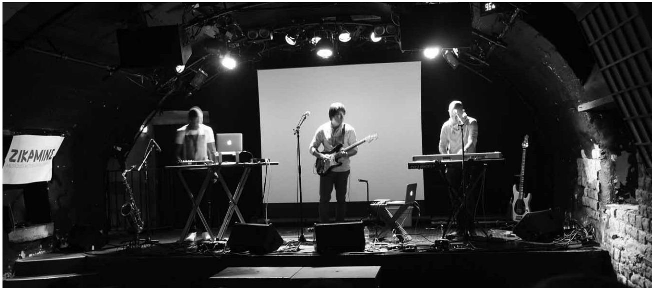
La nouvelle génération de l'electropop à la luxembourgeoise : Quantum Dot.