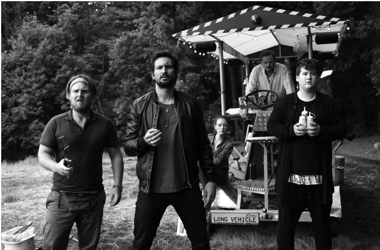
Gähn! Wie „Hangover“ nur im deutschen Wald: „Männertag“ - neu in den Sälen.

révolution et inversent les règles. Tous ensemble, ils squattent un grand appart', et ce sera désormais aux parents de se déplacer!