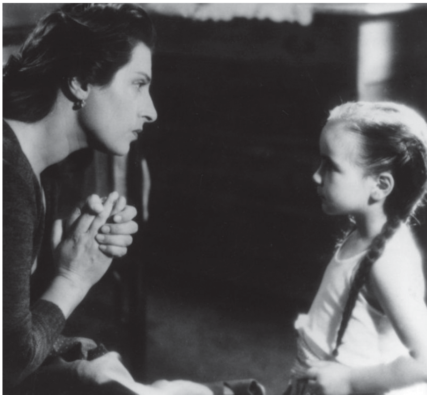
Une ode à l'Italie d'après-guerre et une critique acerbe du monde du cinéma : « Bellissima » de Luchino Visconti, vendredi à la Cinémathèque.

Don Pietro. Mais la maîtresse de Manfredi va tous les dénoncer aux Allemands.