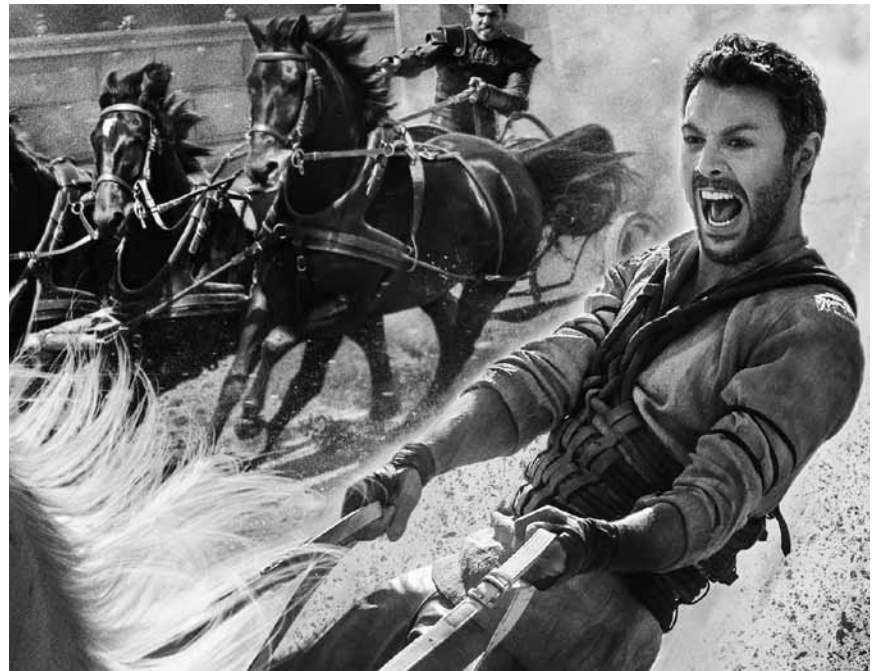
Auch im alten Rom war Geschwisterliebe nicht immer einfach: „Ben Hur“ - wiederaufgelegt antiker Schinken, neu im Utopolis Belval und Kirchberg.