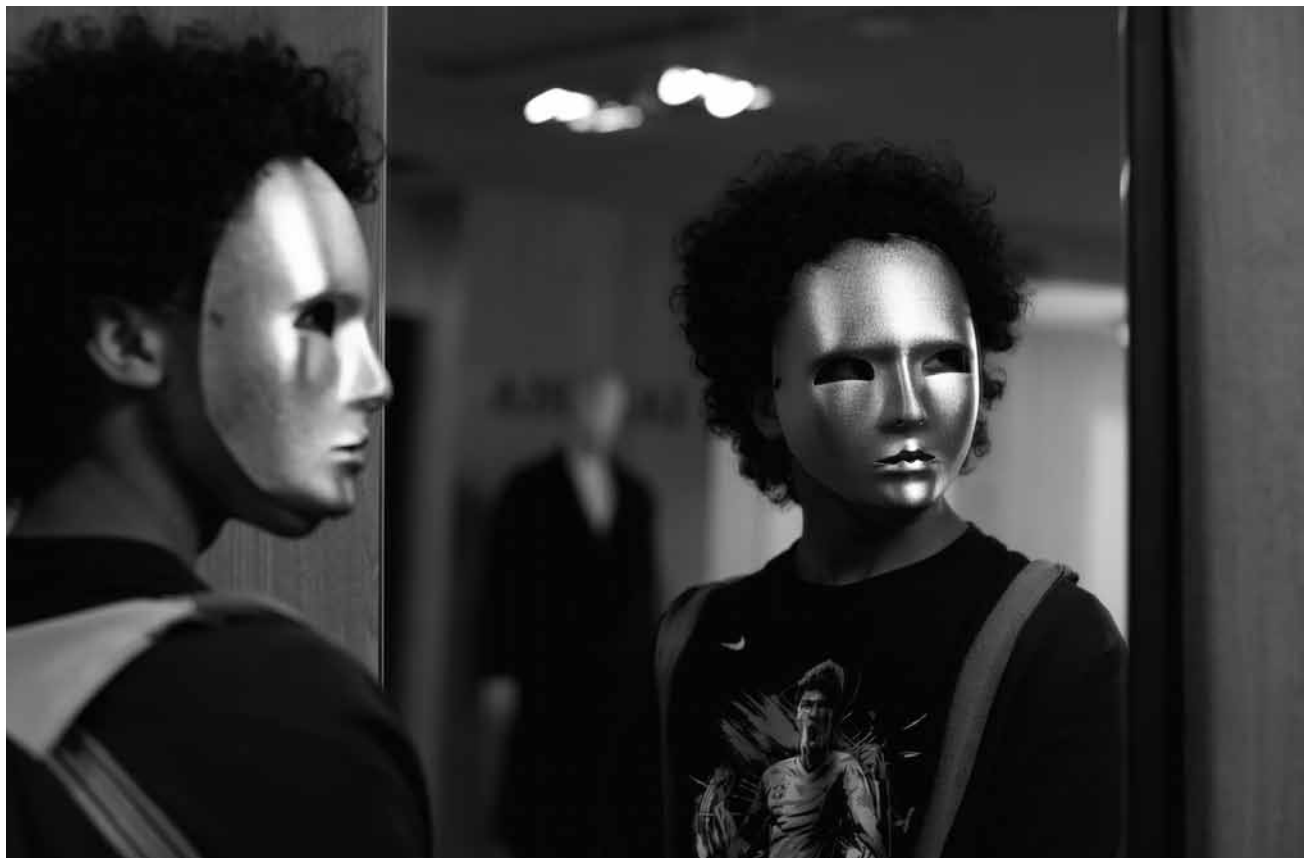
Après « Saint Laurent », Bertrand Bonello retourne au grand écran avec le mystérieux et envoûtant « Nocturama » - nouveau à l'Utopia.