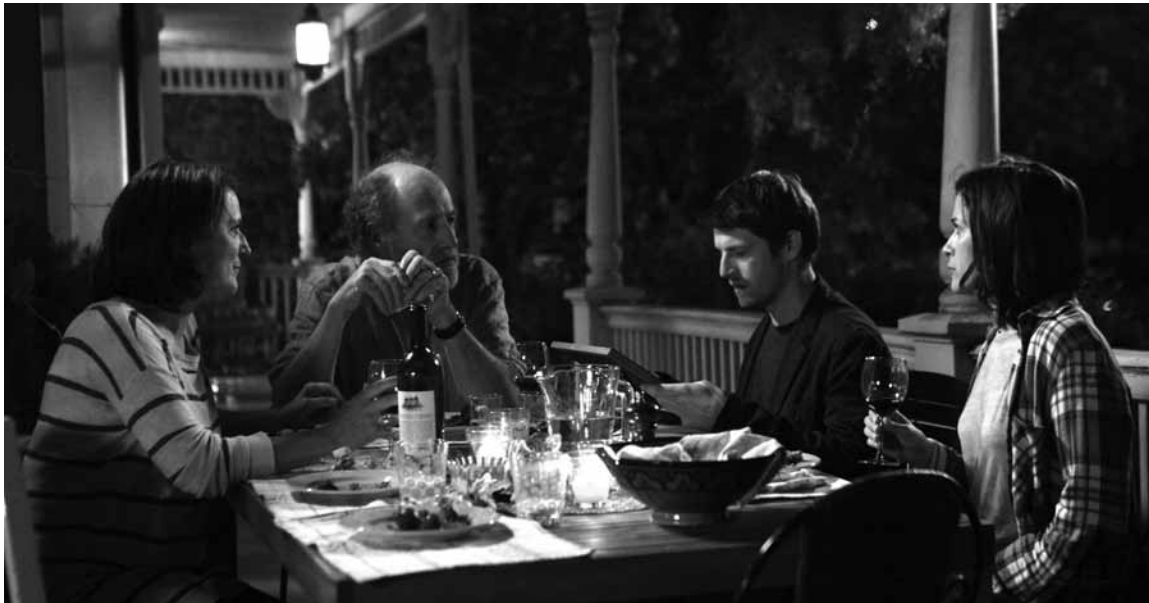
Un secret de famille enfoui ressurgit de l'autre côté de l'Atlantique.