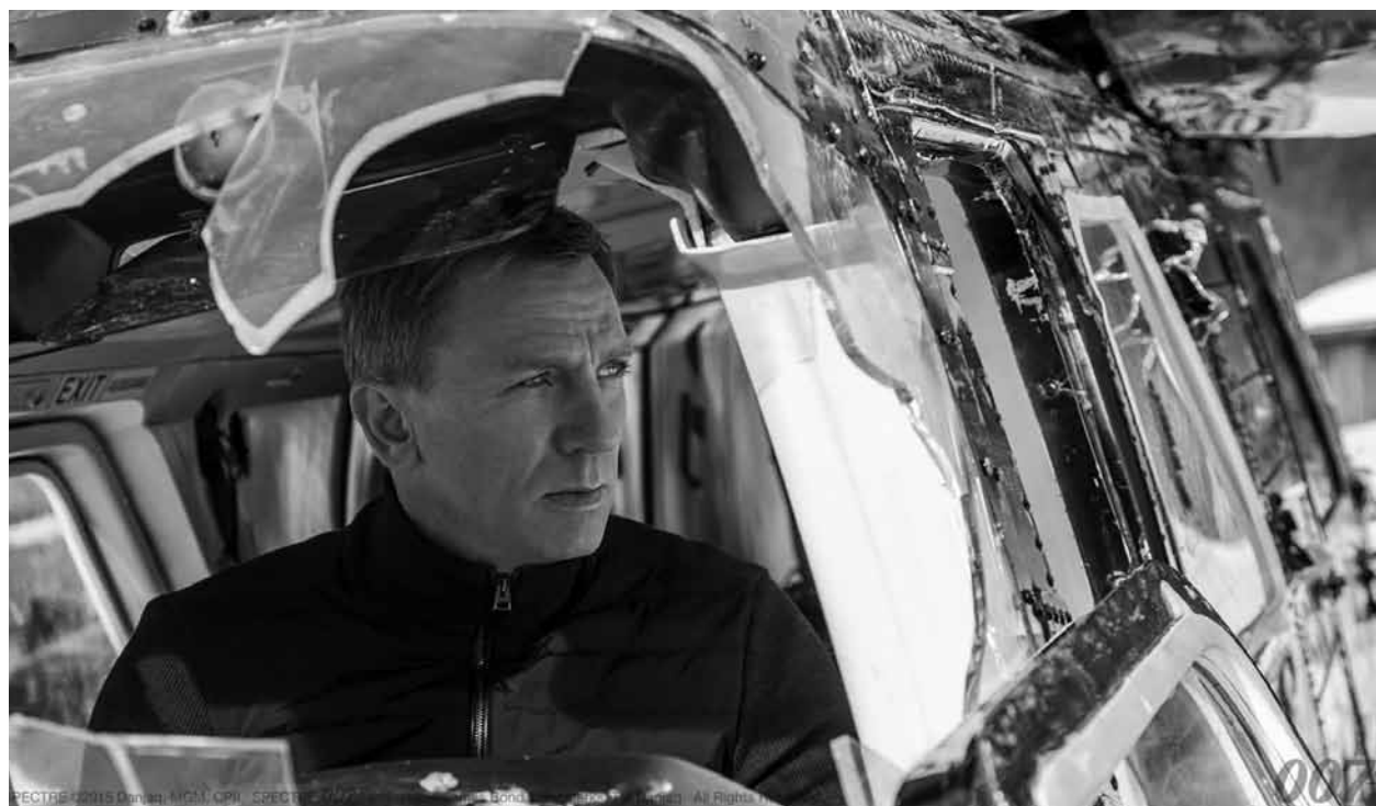
Im Auftrag Ihrer Majestät jagt 007 auch Gespenster: „Spectre“ - am Sonntag im Open Air Kino in Diekirch.

James Bond. 007 ist gerade wieder auf einer nicht genehmigten Solo-Mission unterwegs, in Mexiko City, nachdem er eine kryptische