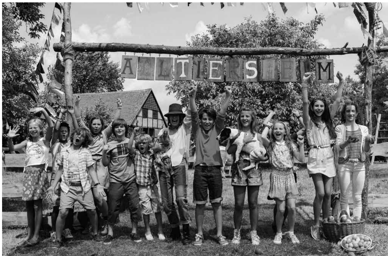
Auch Kinder mögen es manchmal leicht ... „Conni & Co“ - neu in den Sälen.

Ove macht jeden Morgen seine Kontrollrunde in seiner Einfamilienhaussiedlung: Er registriert unrechtmässig geparkte Autos, räumt Fahrräder weg und überprüft Mülltonnen auf korrekte Abfalltrennung. Aber hinter dem Gegrummel des Rentners verbirgt sich eine traurige Geschichte. Seit dem Tod seiner geliebten Frau Sonja sieht er keinen Sinn mehr im Leben. Nun plant er - ganz konkret und pragmatisch - selbst zu sterben. Als aber nebenan neue