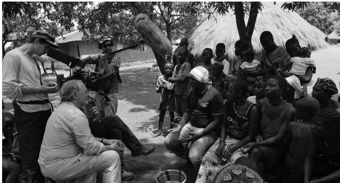
Ein leider wenig beachteter und doch tragischer Aspekt der Globalisierung: „Landraub“ - am Montag in der Cinémathèque.

Thule liegt im obersten Norden Grönlands, Tuvalu ist ein kleiner Inselstaat im pazifischen Ozean. Trotz riesiger Entfernung und Gegensätzlichkeit, sind die beiden Orte durch ein gemeinsames Schicksal eng miteinander verbunden: Während in Thule das Eis immer mehr zurückgeht und zu Meerwasser wird, steigt in Tuvalu der Meeresspiegel mehr und mehr an.