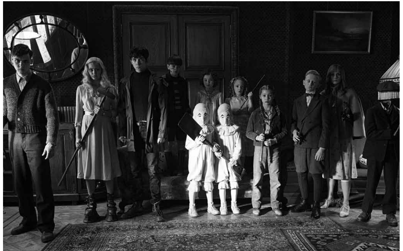
Hat sich Regisseur Tim Burton etwa nach Hogwarts verirrt? „Miss Peregrine's Home for Peculiar Children“ wird die Antwort liefern - neu im Utopolis Kirchberg und Belval.

Beatrice est une mythomane bavarde au comportement excessif. Donatella est une jeune femme tatouée, fragile et introvertie. Ces deux patientes de la Villa Biondi, une institution thérapeutique pour femmes sujettes à des troubles mentaux, se lient