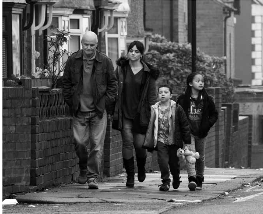
Ken Loach ist zurück und der marxistische Altmeister verzückt nun sogar die luxemburgische Diözese (die den Film extra promotet hat) - „I, Daniel Blake“, neu im Utopia.

Gabrielle a grandi dans la petite bourgeoisie agricole où son rêve d'une passion absolue fait scandale. À une époque où l'on destine d'abord les