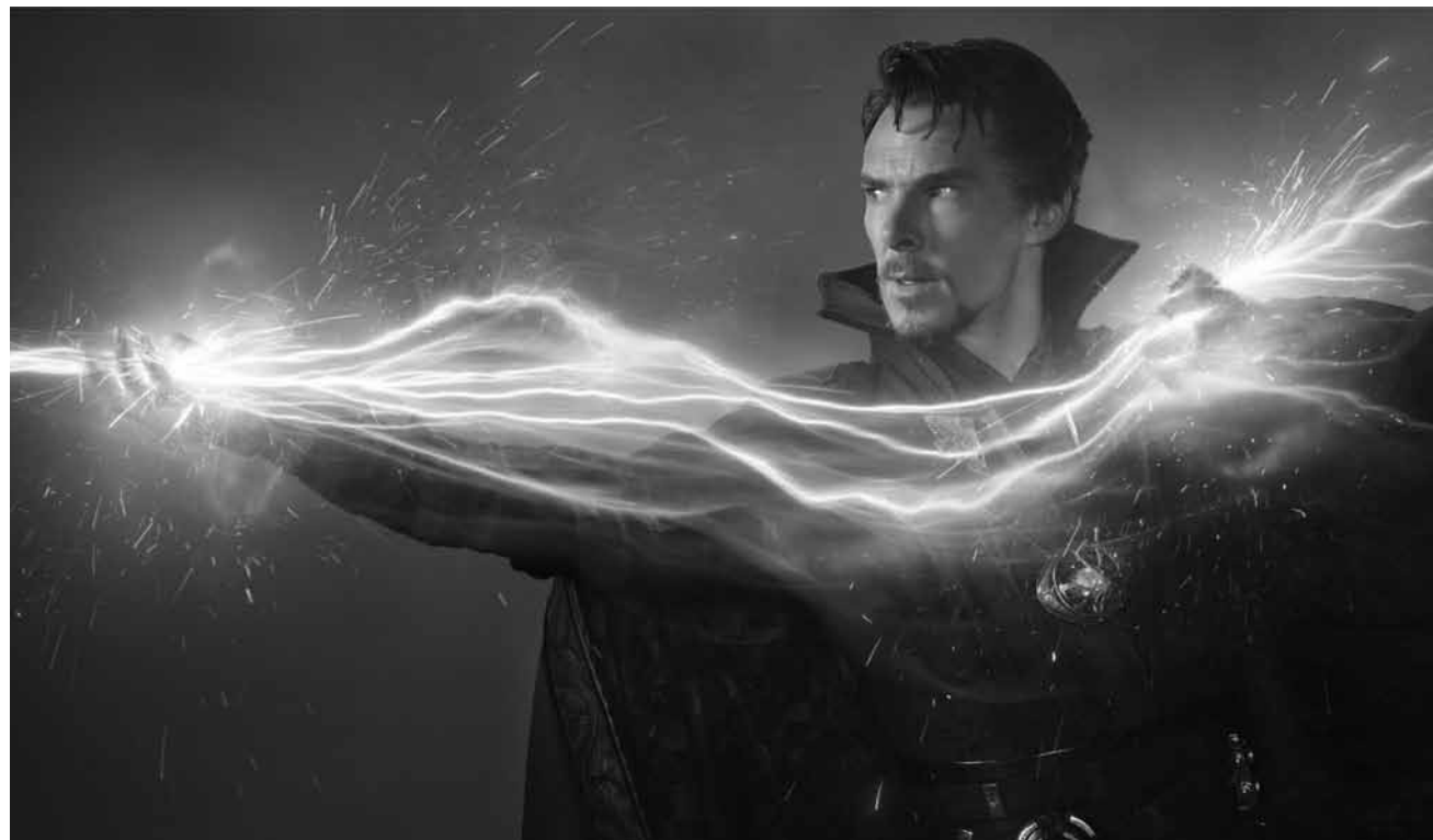
Das Marvel-Universum expandiert schon wieder: „Doctor Strange“ - neu in fast allen Sälen.

Doctor Stephen Strange ist ein arroganter Neurochirurg, der seiner Tätigkeit nach einem Autounfall nicht mehr nachgehen kann. Bei der Einsiedlerin The Ancient One in Tibet