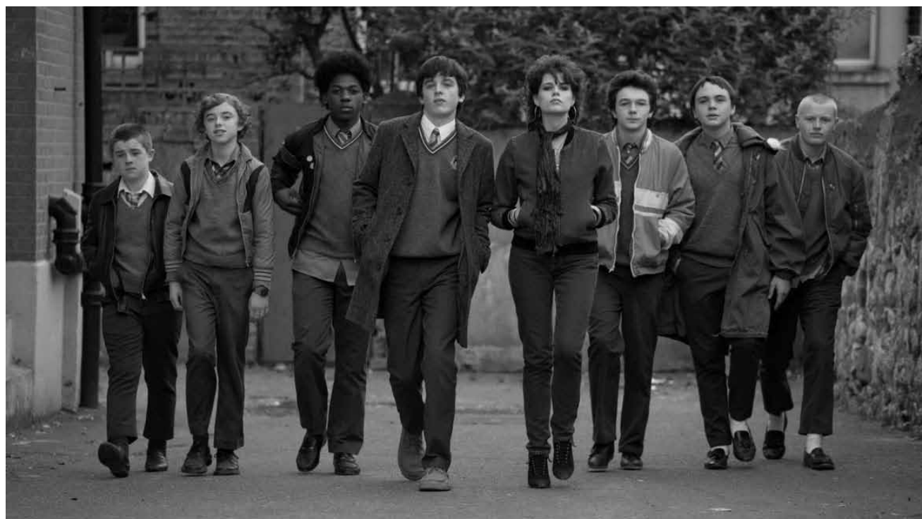
Jaja, Singen hilft gegen alles - sogar gegen soziale Misere - zumindest im Film : „Sing Street“ - neu im Utopia.

François Gautier est radin ! Économiser le met en joie, payer lui provoque des suées. Sa vie est réglée dans l'unique but de ne jamais rien dépenser. Une vie qui va basculer en