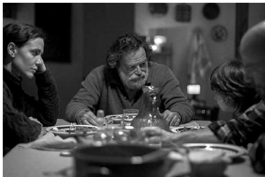
Un enfant disparaît, puis revient... il ne reste que les doutes : « In fondo al bosco » - au Starlight dans le cadre du Festival du film italien de Villerupt.