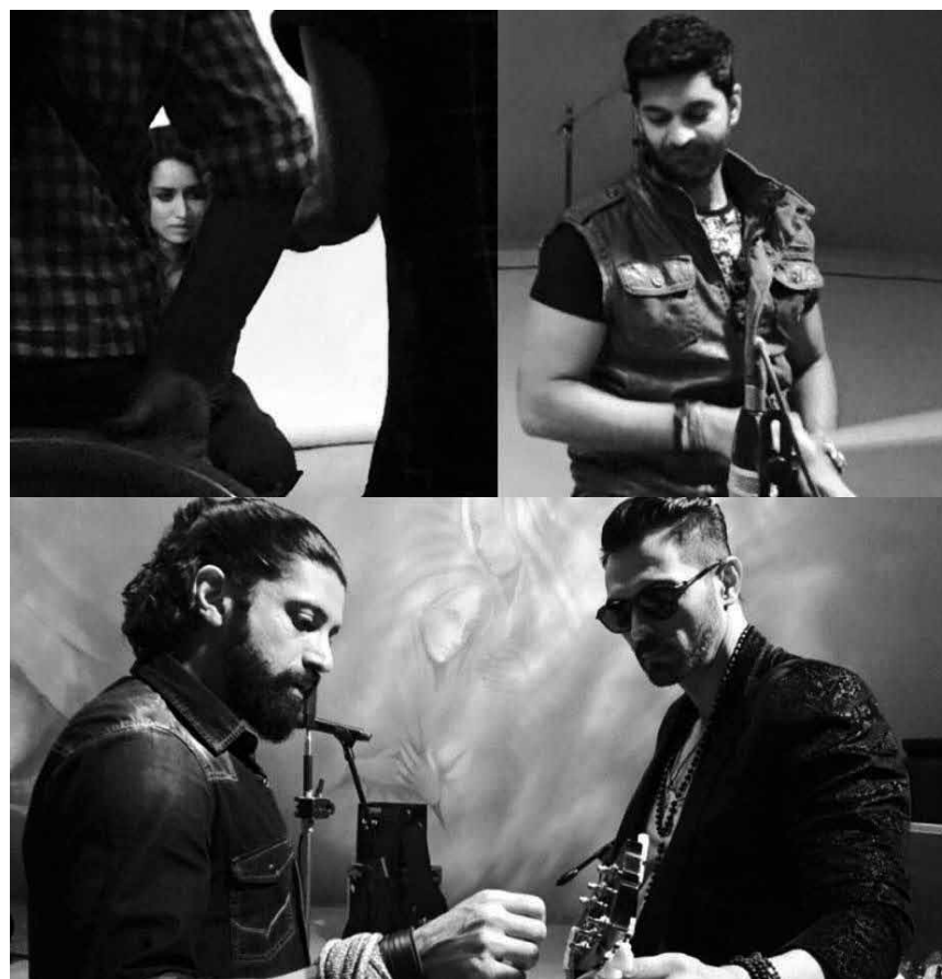
It's like „The Voice India“ - but it's also a movie: „Rock On 2“ - at Utopolis Belval.