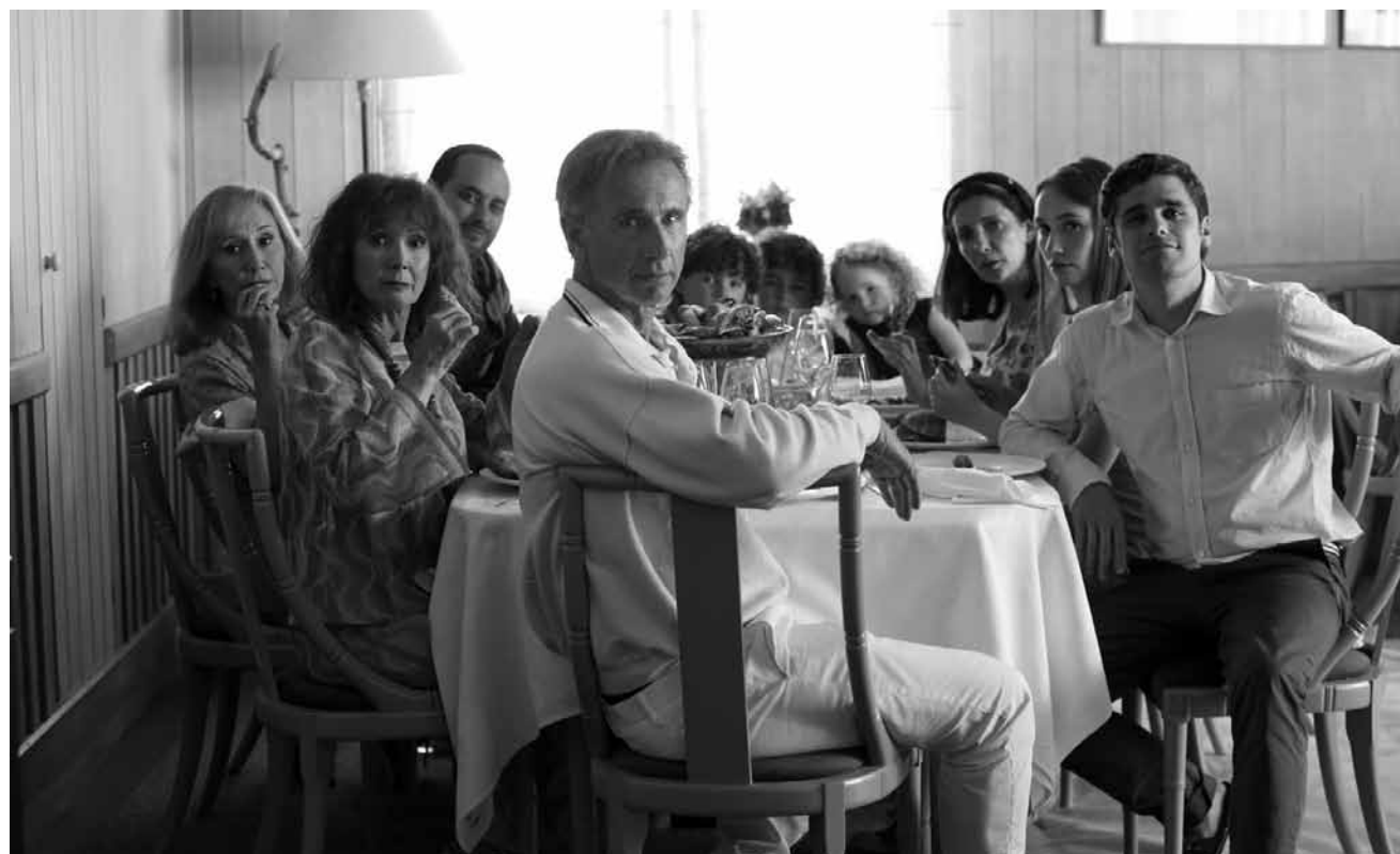
Bon, une dernière comédie beauf avant la fin de l'année : « Ma famille t'adore déjà », nouveau à l'Utopolis Kirchberg.

Der Vater von Alex arbeitet im Sicherheitsgeschäft - sehr praktisch, wenn man wie Alex ein Dieb ist. Das Insiderwissen hilft die teuren Sicherheitssysteme reicher Leute zu überwinden. Alex ist auf diesen Diebestouren nicht allein: Rocky begleitet ihn, um sich und ihrer kleinen Tochter ein besseres Leben zu ermöglichen. Dritter im Bunde ist Money, Rockys Freund. Ein Kick der besonderen Art steht dem Trio bevor, als es in das Haus eines Kriegsveteranen einsteigt, der nach dem Unfalltod seines einzigen Kindes ein großes Schmerzensgeld bekommen haben soll. Der Veteran ist blind, was kann also schiefgehen? Nun, eine Menge.