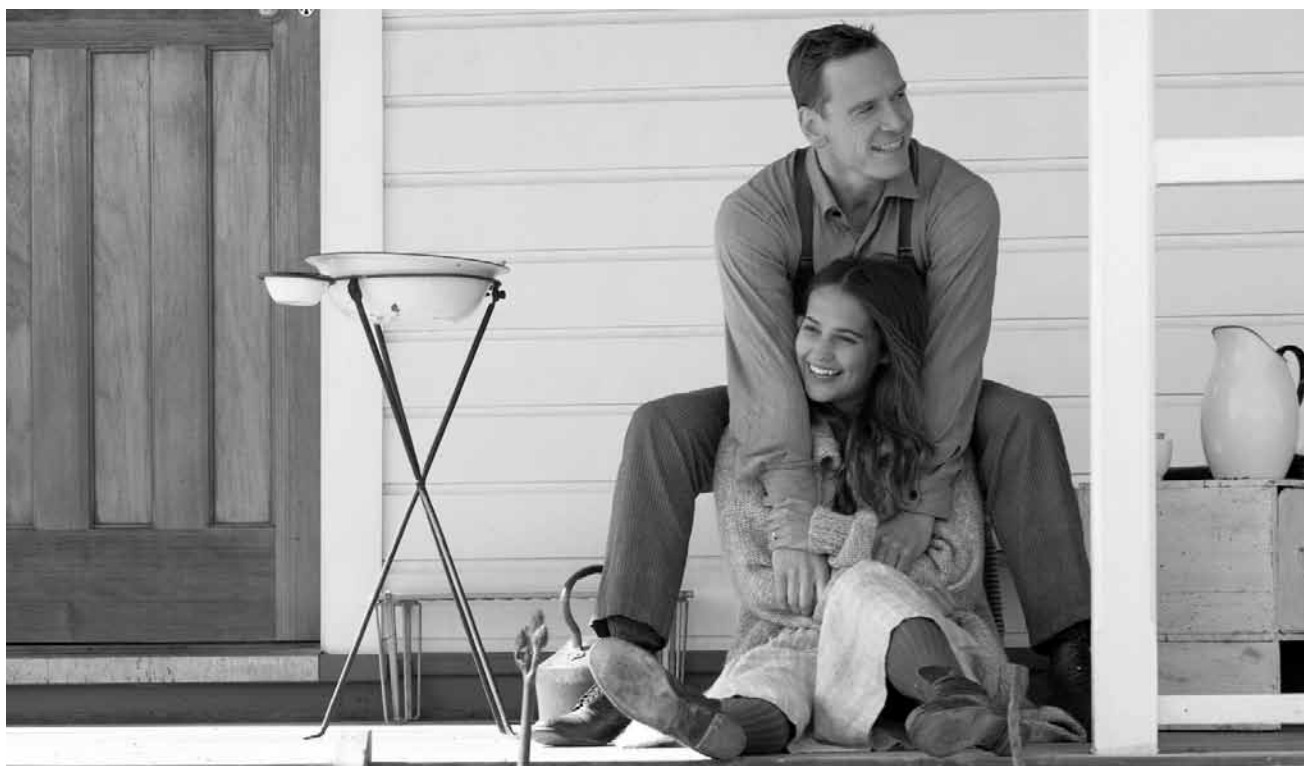
Melodrama um Weltkrieg, Fehlgeburt und andere Lügen: „The Light Between Oceans“, neu im Utopia und Utopolis Kirchberg.