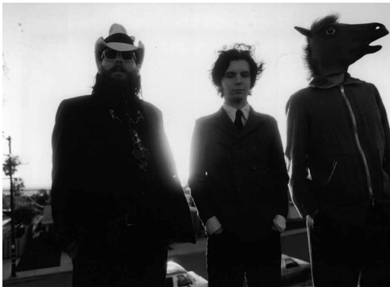
Malgré leur nom de guerriers, les gars de « The Black Heart Procession » sont plutôt soft et surtout cultissimes - le 11 mars aux Rotondes.

Toutes les informations sont disponibles sur www.lifelong-learning.lu .