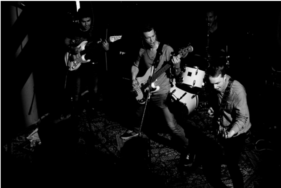
Auf dem Weg nach oben: All the Way Down.