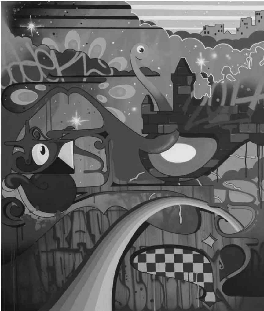
Sader introduira le printemps au Parc merveilleux à Bettembourg - du 1er avril au 1er mai.

(place de la Résistance, tél. 54 84 72), Esch-sur-Alzette, ma. - di. 14h - 18h.