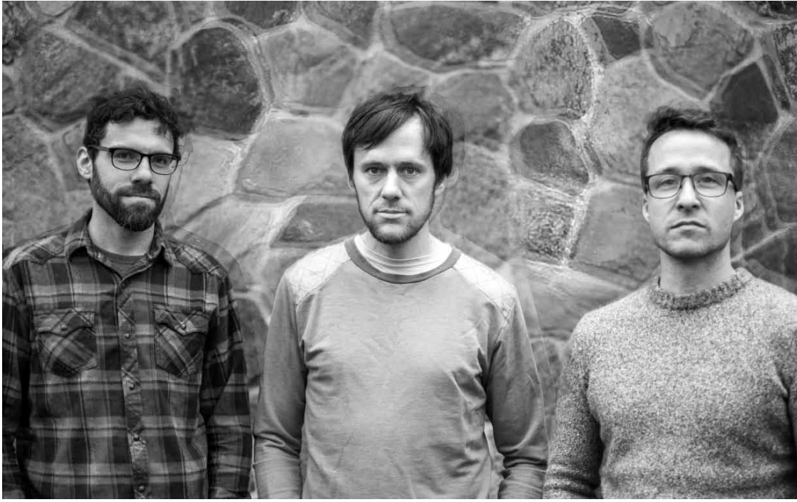
Psychédélicques, même sur la photo : Pick a Piper.