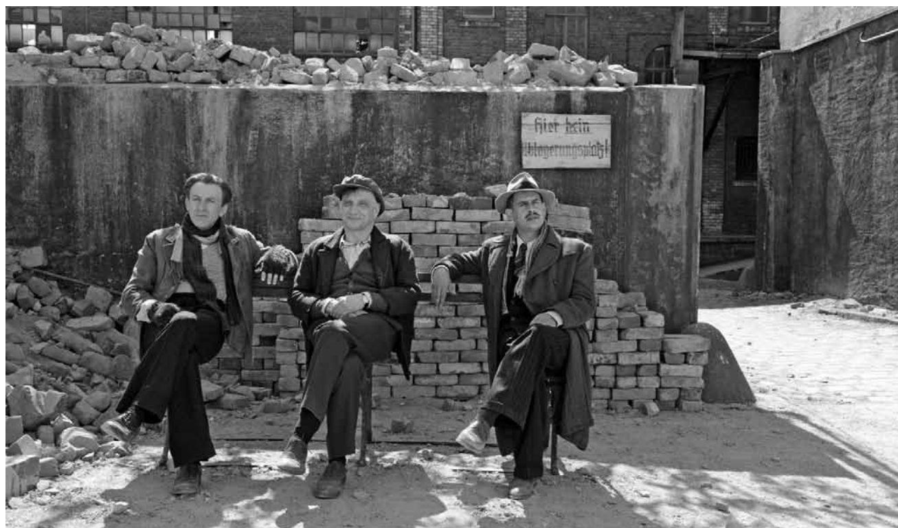
Die luxemburgisch-belgische-deutsche Koproduktion „Es war einmal in Deutschland ...“ ist alles andere als märchenhaft - neu im Kinepolis Kirchberg

USA 2017 von und mit Dax Shepard. Mit Michael Peña und Vincent D'Onofrio. 100'. O.-Ton, fr. + nl. Ut. Ab 16.