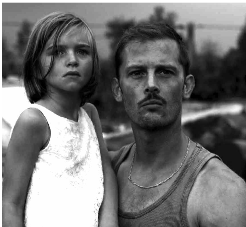
Dans « Orpheline », plusieurs biographies de femmes vont se croiser pour n'en faire qu'une à la fin - nouveau à l'Utopia.

Nathalie est joaillière et vient de s'installer à Paris pour un nouveau travail et une nouvelle vie avec ses deux fils. Mais la direction de la bijouterie change soudainement d'avis et lui annonce que le poste ne sera pas pour elle. Nathalie veut protéger ses enfants et décide de ne rien leur dire. De ce mensonge vont naître d'autres mensonges de part et d'autre. L'engrenage commence.