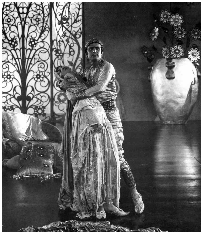
Quand Bagdad était encore intacte : « The Thief of Bagdad » film muet de 1924 réalisé par Raoul Walsh, sera mis en musique par Carl Davis à la Philharmonie les 12 et 13 mai.

Desperado , tribute to The Eagles, Trifolion, Echternach , 20h. Tél. 47 08 95-1.