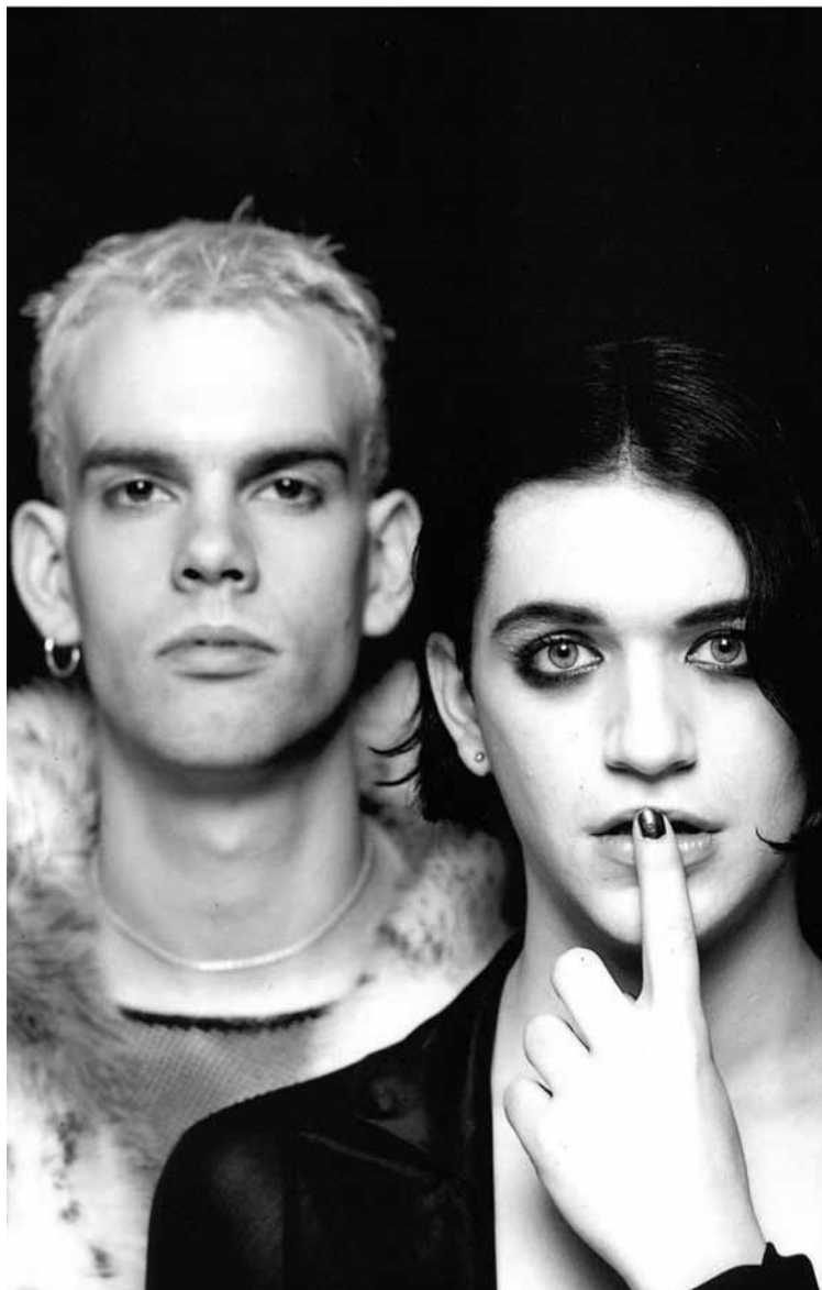
Sie sind alt und brauchen das Geld: Placebo.

wurden verfeinert, das Songwriting erweitert und die von Molko verfassten Texte wurden von den Jugendlichen aufgesogen, als seien sie das ganz neue Testament. „A friend in need is a friend indeed, a friend with breasts and all the rest, a friend who's dressed in leather“ singt er in „Pure Morning“, das auch das Album einläutet. Es sind vor allem die hochemotionalen und sehr persönlichen Texte, die „Without You I'm Nothing“ zu einem Evergreen machten.