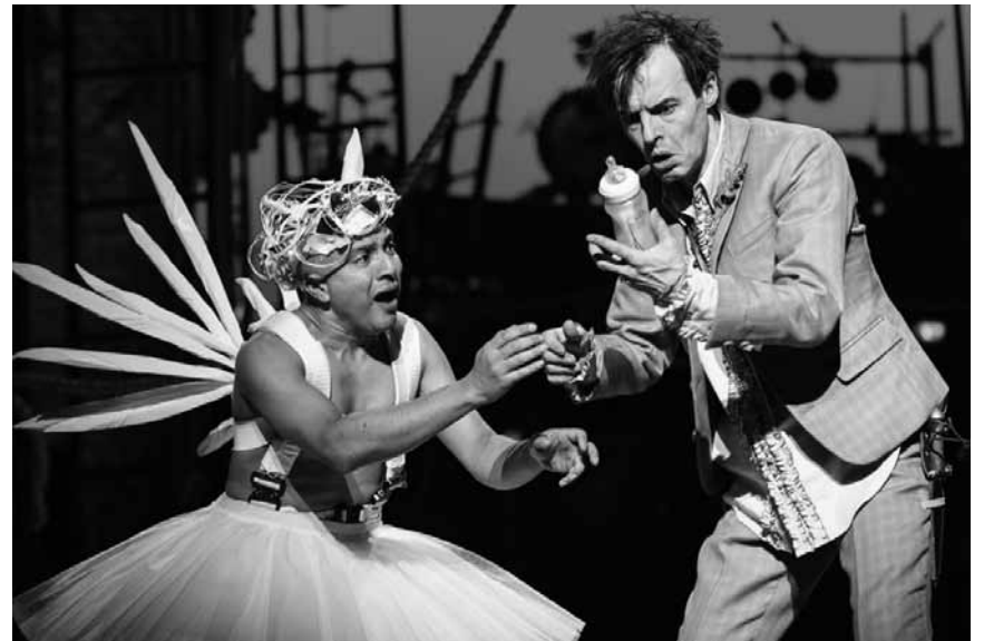
"Peter Pan" is back ... maybe because he never really went away: The play directed by Sally Cookson will be shown at the Utopia on June 10th at 6.30 pm.

Der fremde Planet, den die Crew des Kolonisationsraumschiffs Covenant erforscht, wirkt paradiesisch: Doch bald schon merken die Entdecker, dass sie auf einem Planeten gelandet sind, der lebensfeindlicher kaum sein könnte.