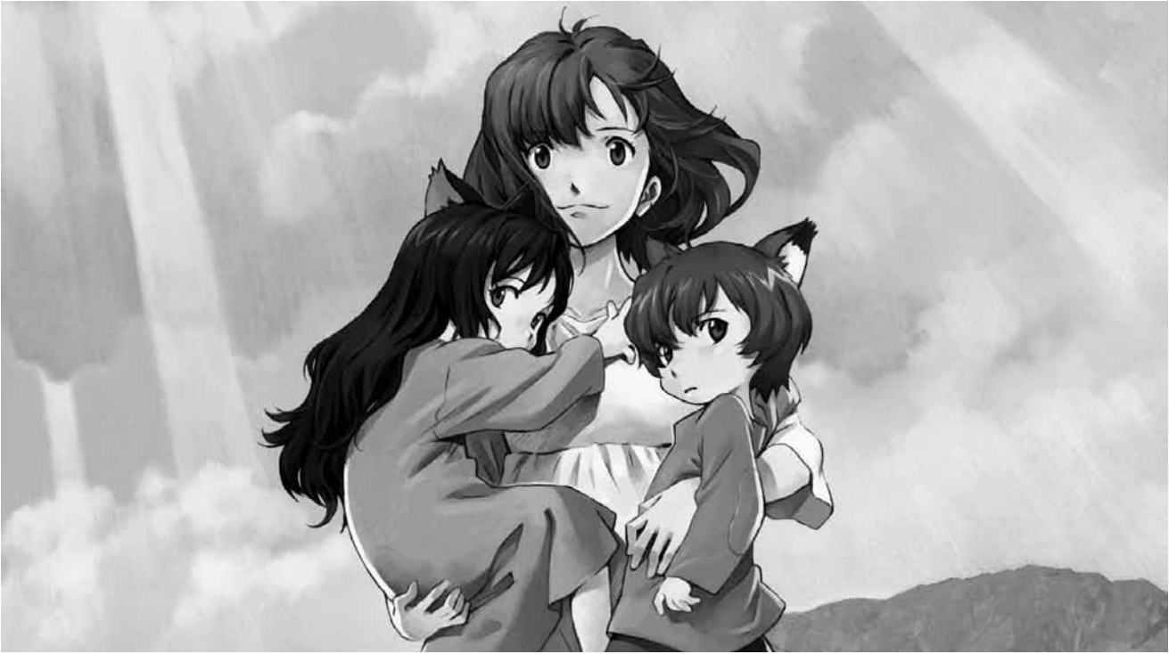
De la difficulté d'expliquer à ses enfants que leur père est en fait un homme-loup : « Ookami kodomo no Ame to Yuki » (« Les enfants loups, Ame & Yuki »), anime de Mamoru Hosoda, dimanche 18 juin à la Cinémathèque.

Mutter auf. Von ihr erfährt er, dass es irgendwo in Montana einen fast dreißigjährigen Sohn geben muss, den er nie gesehen hat. ✖✖ Mancher Feuilletonist begrüßt den Film als spätes Mea Culpa der 68er-Generation. Selbst wenn diese Deutung Wenders' Intention entspricht bleibt als Fazit: netter Versuch. (Gilles Bouché)