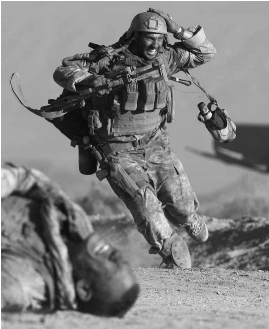
Kriegsfilm mal anders: In „The Wall“ geht es weniger um den geopolitischen Konflikt sondern um ein hinterhältiges Psycho-Spiel - neu im Kinopolis Belval und Kirchberg.

Marie-Francine F 2017 de et avec Valérie Lemerrier. Avec Patrick Timsit et Hélène Vincent. 95'. V.o. À partir de 6 ans.