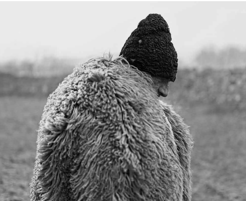
Ist noch lange nicht fertig: Tamas Dezso: „Notes for an Epilogue" - noch bis zum 30. März 2018 im Schlassgaart in Clervaux.

(montée du Château, tél. 92 96 57), Clervaux, me. - di. + jours fériés 12h - 18h.