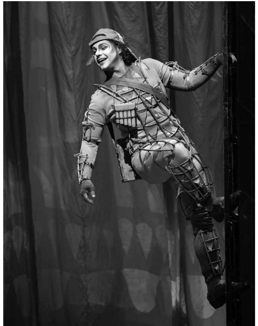
"Die Zauberflöte" - one of the best-known of Mozart's many operas comes live from the Metropolitan Opera of New York - at the Kinepolis Kirchberg and at the Utopia.

The Queen of the Night persuades Prince Tamino to rescue her daughter Pamina from captivity under the high priest Sarastro; instead, he learns the high ideals of Sarastro's community and seeks to join it. Separately, then together, Tamino and Pamina undergo severe trials of initiation, which end