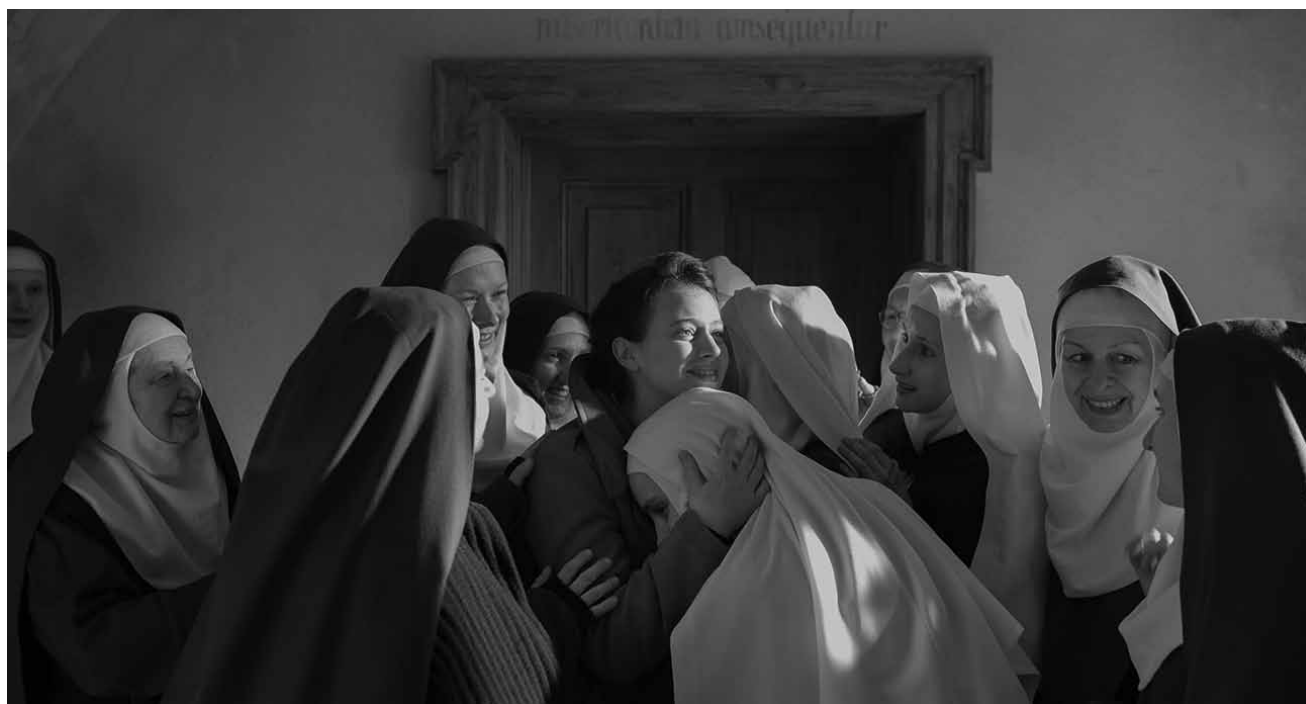
A French Atheist Red Cross worker becomes the only hope for a convent full of nuns who hide their pregnancy after being raped by Soviet soldiers in "Les Innocentes" - Friday at the Cinémathèque.

"The Undesirable" is a unique rarity in the world's cinema, the only surviving silent film by the Hungarian-born Mihály Kertész, who - under the name of Michael Curtiz - became one of the important figures of early Hollywood, known for such classics as "Casablanca" (for which he received an Oscar) or "The Adventures of Robin Hood".