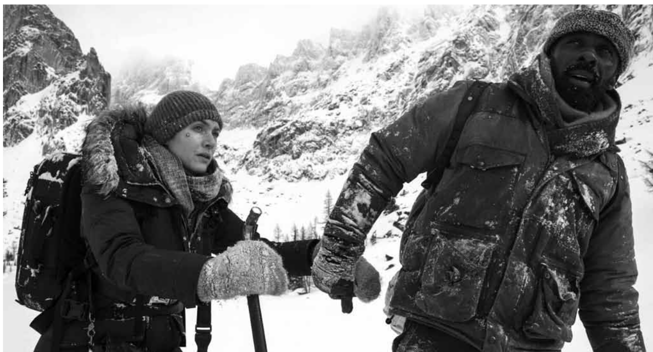
Gefangen in der Eiswüste und dazu noch mit einem komplett Fremden: „The Mountain Between Us“ - neu im Kinopolis Belval und Kirchberg.

vie », elle instaure un ton doux-amer qui sonde efficacement les rapports humains. Finalement, cette modeste réflexion sur la famille emporte l'adhésion surtout grâce à des acteurs attachants. (ft)