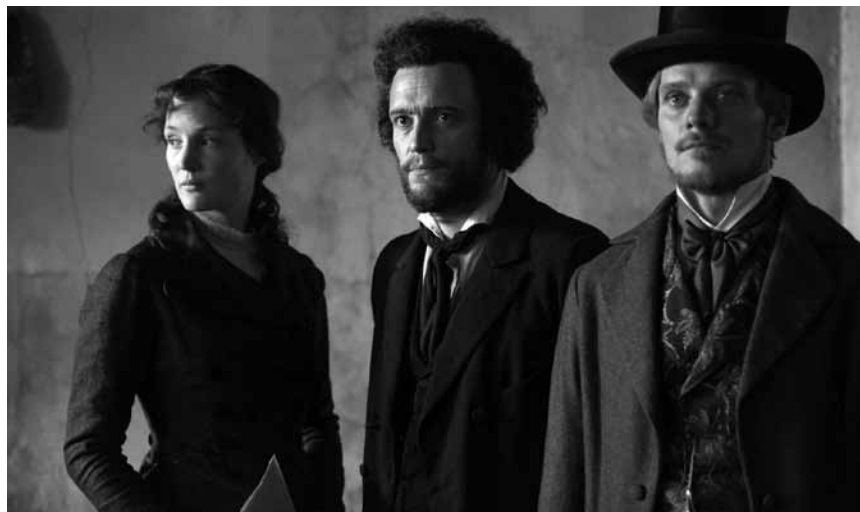
Eine verfilmte Geschichtsunterrichtsstunde, die sicher nicht schaden kann: „Der junge Karl Marx“ - neu im Utopia.

1.000 Joer Buerg Clierf - Land a Leit Blade Runner 2049 Cars 3: Evolution It Kingsman 2: The Golden Circle Sixty8 The Beguiled The Lego Ninjago Movie