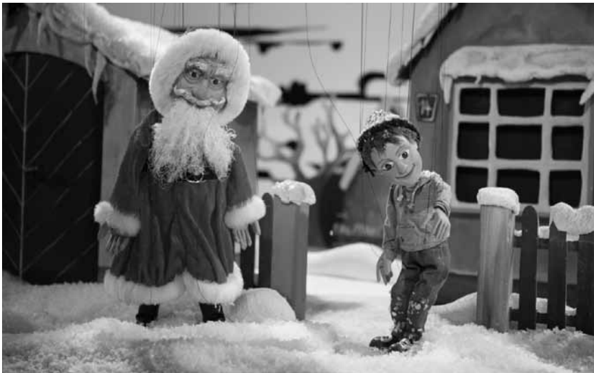
Der Weihnachtsmann startet dieses Jahr mit einer Bruchlandung in die Kinos - „Augsburger Puppenkiste: Als der Weihnachtsmann vom Himmel fiel“, an diesem Sonntag, dem 3.12. im Utopia, Kinopolis Belval und Kirchberg.