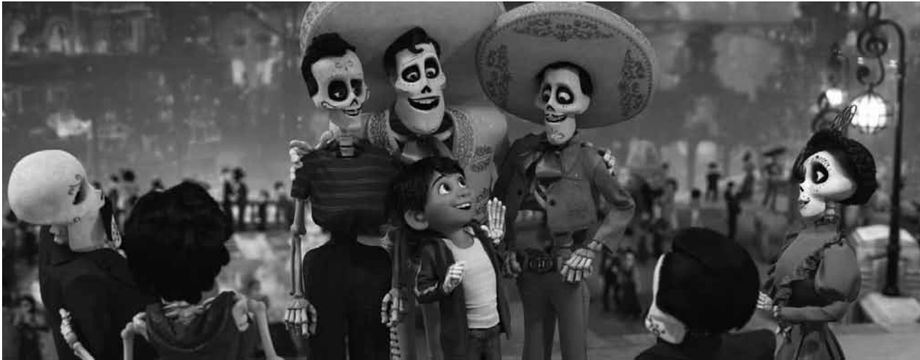
Dass der Tod auch mal knallbunt und quietschlebig sein kann beweist „Coco“, neu in fast allen Sälen.

beendet. Doch vom Ruhestand will der rote Rennwagen nichts wissen, vielmehr steckt er sich ein neues ehrgeiziges Ziel. Er will das Rennen „Florida 500“ gewinnen und den Jungspunden zeigen, dass er immer noch das Zeug zum Sieger hat. Doch vor allem der blitzschnelle Newcomer Jackson Storm ist für Lightning McQueen ein ernstzunehmender Gegner und mit etlichen technischen Spielereien ausgestattet, über die McQueen nicht verfügt. Und so holt er sich Hilfe von der jungen Renntechnikerin Cruz Ramirez: Sie soll ihn trainieren und ihm die neuesten Tricks aus dem Rennzirkus beibringen.