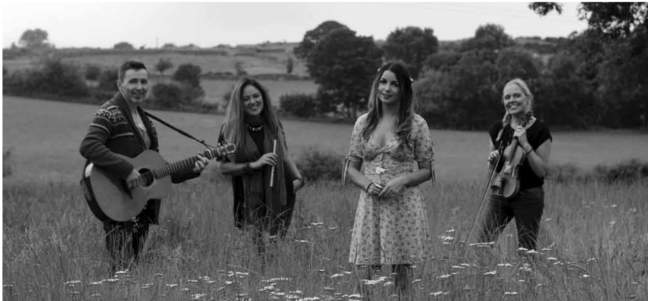
Issu de la famille Sands, une référence dans le folk irlandais, le groupe Na Leanaí innove tout en restant proche de ses racines - le 24 janvier à Neimënster.

Musée d'art moderne Grand-Duc Jean, Luxembourg, 18h30. Tel. 45 37 85-1. www.mudam.lu Registration: www.designfriends.lu