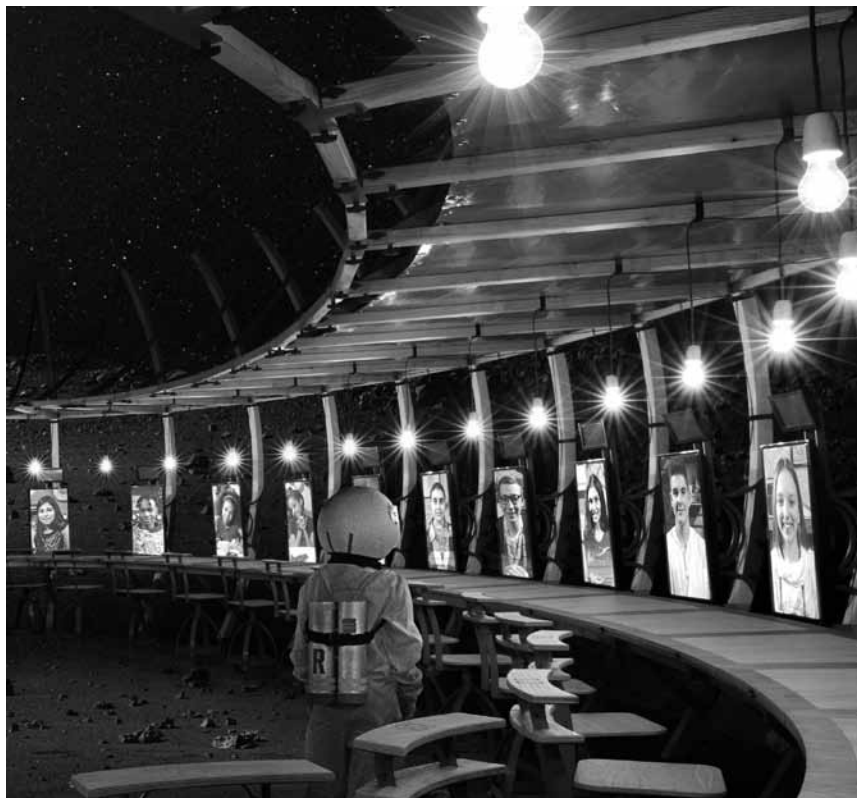
Nach dem Erfolg des Dokumentartheaterstücks „Perhaps all the Dragons...“ kommt nun die kinderfreundliche Version „Remember the Dragons...“ in die Rotondes – am 28. Januar.