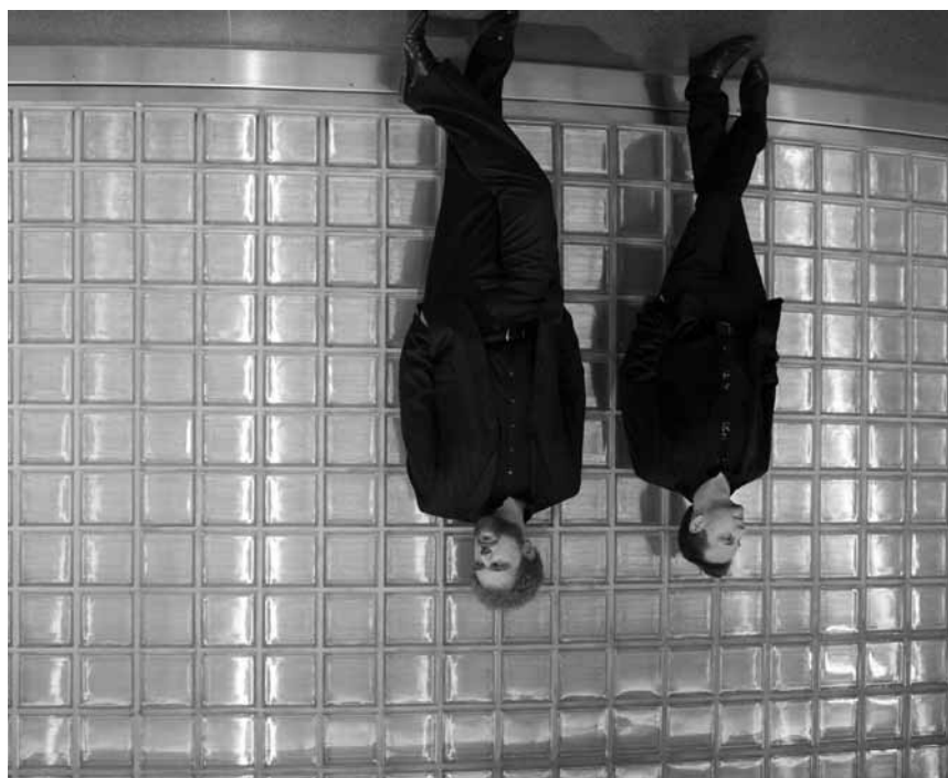
Einen Musikabend mal umgedreht erleben kann man an diesem Sonntag, dem 21. Januar im Kulturhaus Niederanven mit „Encore Bis Zugabe“.