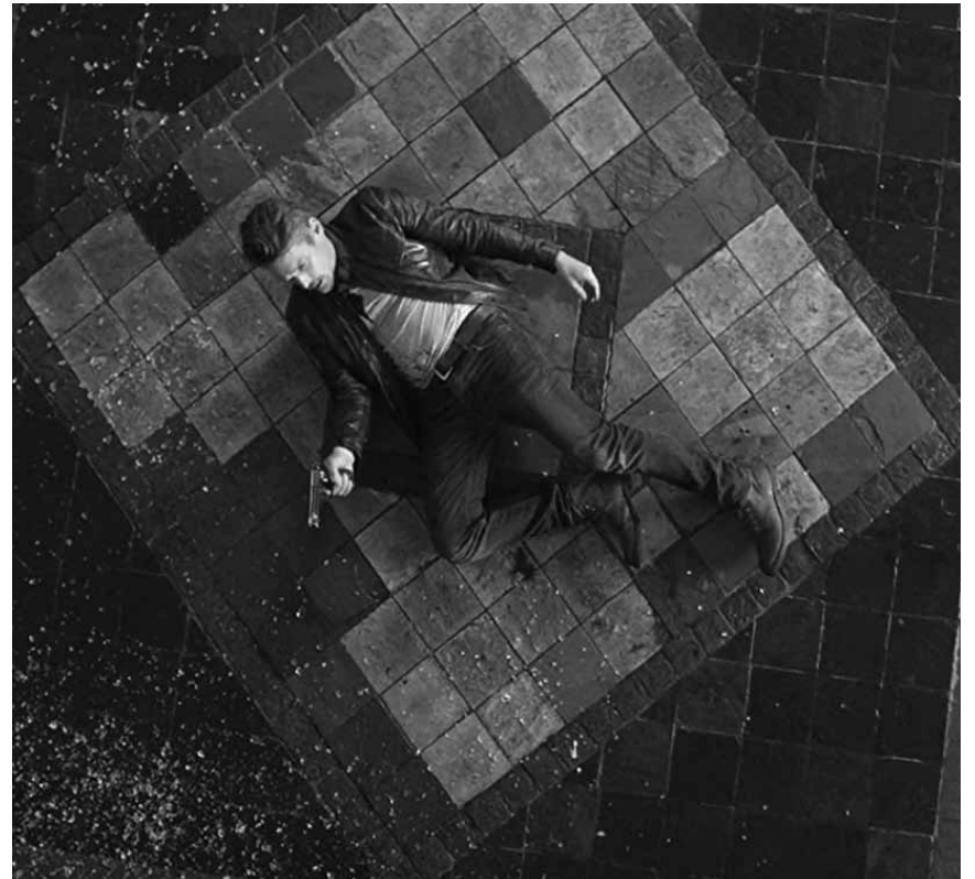
Auch 2018 gibt es im Kino noch genügend unnötige Ballereien mit dürftigen Drehbüchern: „24 hours to live“ - neu im Kinepolis Belval.

✖✖✖ Der Film zeigt die Ohnmacht, den Schmerz und die tiefe Trauer einer einzelnen Frau gegenüber willkürlicher Gewalt von rechts und