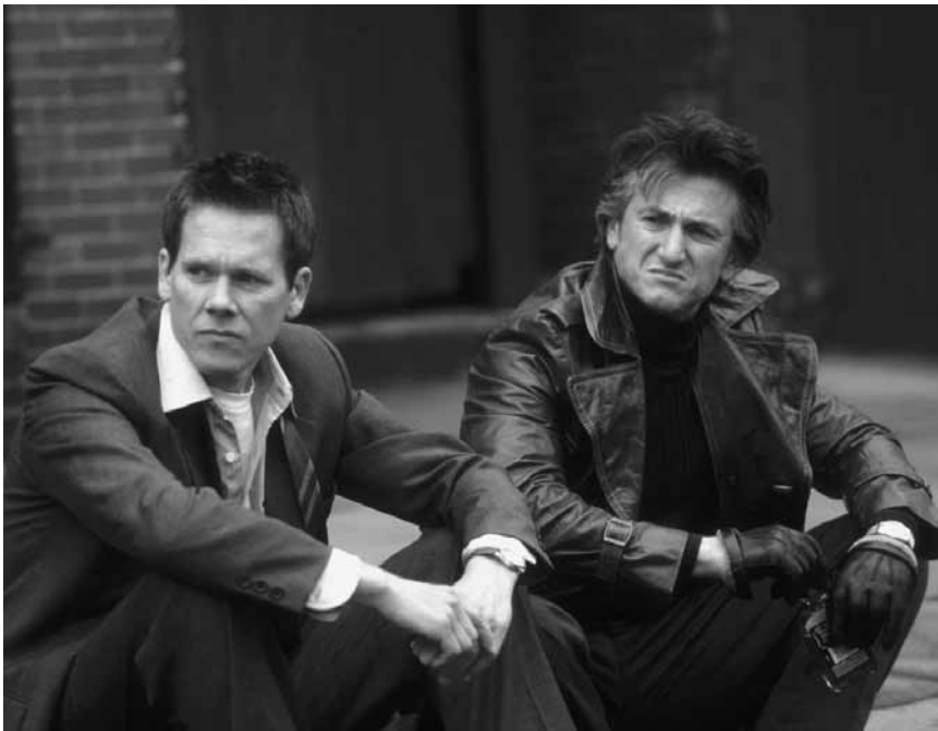
Eine Geschichte über Freundschaft, Traumata und Vergangenheitsbewältigung: „Mystic River“ - am Sonntag, dem 28. Januar in der Cinémathèque.

Gus, Harry und Archie, drei Männer im besten Alter, leben mit ihren Gattinnen in New Yorker Vororten. Der Tod eines gemeinsamen Freundes bringt die Männer wieder näher zusammen und sie gönnen sich einen richtigen Männerausflug. Als sie jedoch schließlich in London landen, müssen sich die drei mit ihrer eigenen Sterblichkeit auseinandersetzen und entscheiden, wie sie den Rest ihres Lebens verbringen wollen.