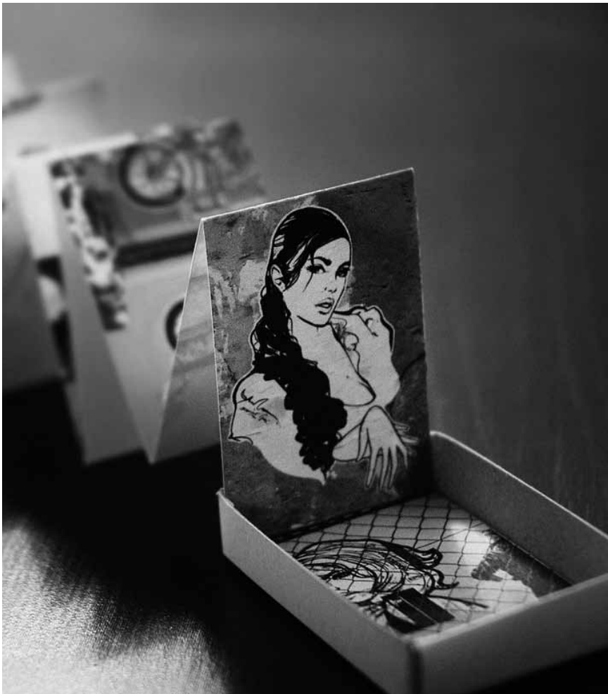
La « 5e Biennale du livre d'artiste » proposera de belles découvertes au public - à l'espace Beau Site d'Arlon jusqu'au 11 février.

(pl. de la Résistance. Tél. 54 84 72), Esch-sur-Alzette, ma. - di. 14h - 18h. Fermé jusqu'au 12.1 et du 16.4 au 4.5.