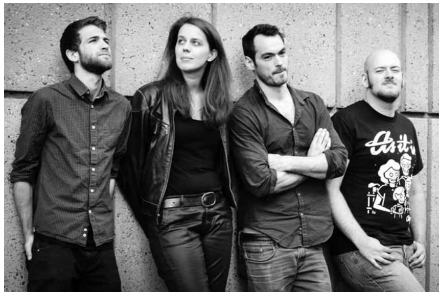
Etwas Spezielles nicht nur für Liebhaber*innen musikalischer Kuriositäten: We Stood Like Kings plays Koyaanisqatsi – zu erleben am 25. Januar im Gudde Wëllen.