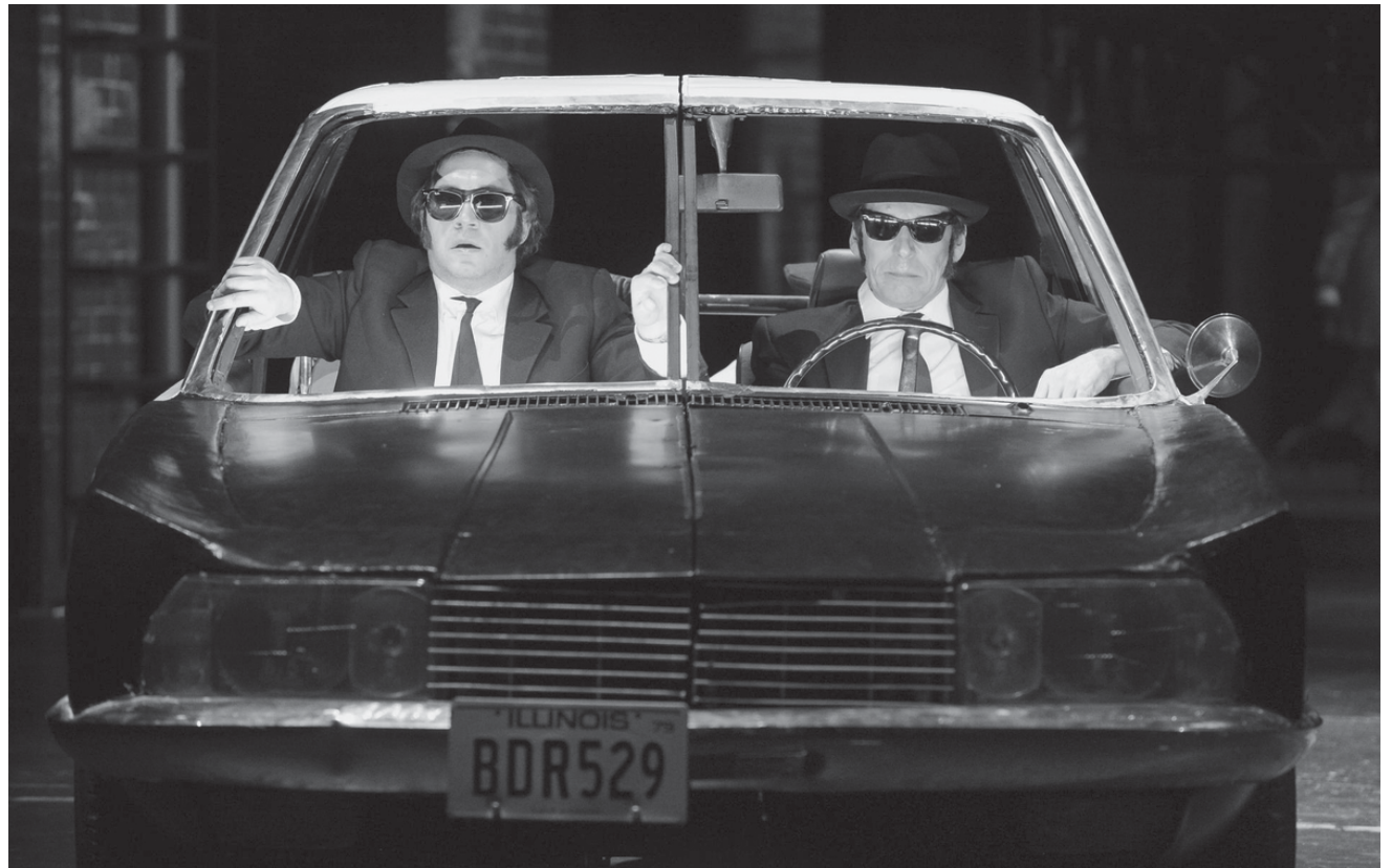
Ein Zeitsprung zurück in die 1980er-Jahre: Die Blues Brothers swingen am 19., 20., 23. und am 26. Januar im Staatstheater Saarbrücken.

Reds, projection du film de Warren Beatty (USA 1981. 195'. V.o. + s.-t. D'après le roman « Ten Days that Shook the World » de John Reeds), introduction par