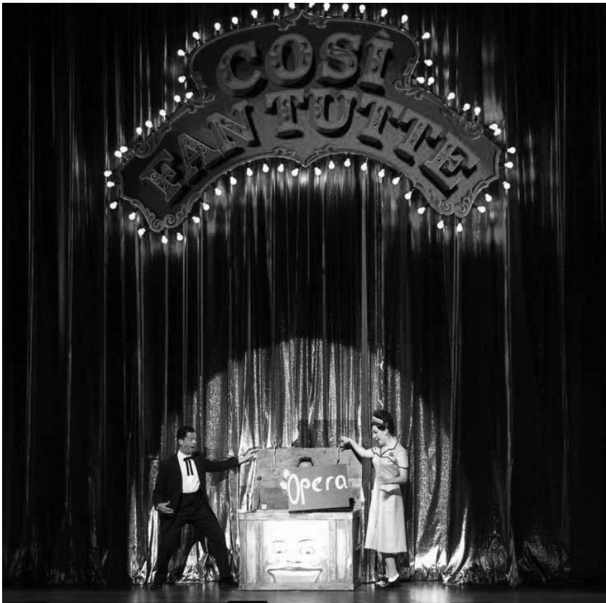
A tale of love, jealousy and philosophy made immortal by Mozart's music: "Così fan tutte", live from the Metropolitan Opera in New York - this Saturday at the Utopia, Kinopolis Belval and Kirchberg.