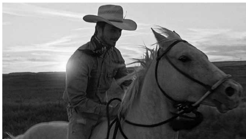
Ein verunglückter Rodeo-Reiter muss sich neu erfinden: „The Rider“ - neu im Utopia.

In einer dystopischen Zukunft verbringen die meisten Menschen