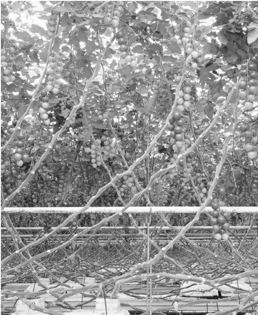
Am dritten Tage erschuf der Herr ... wohl Gewächshäuser – zumindest wenn es nach dem deutschen Fotografen Henrik Spohler geht: Seine Fotos „The Third Day“ sind noch bis zum 29. September 2019 im Schlossgaart in Clerf zu sehen.