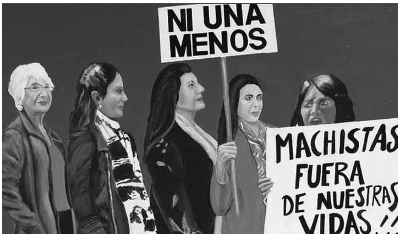
„La marche des femmes“ wird noch bis zum 22. April im „Neimënster“ gezeigt.