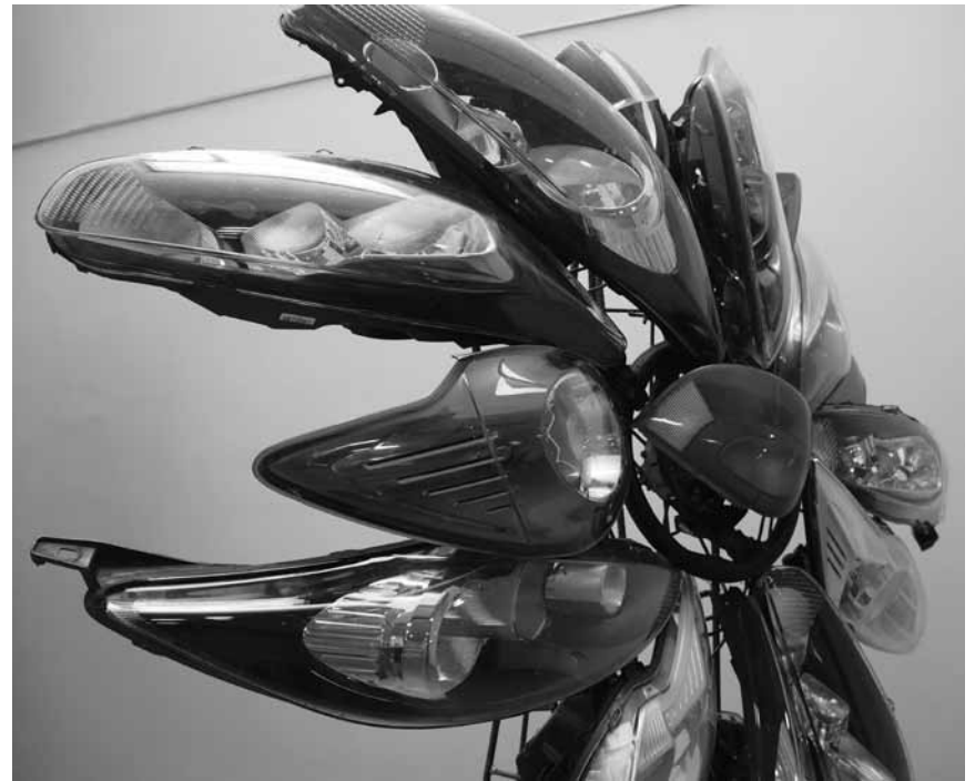
Paraît que ça tourne rond à l' espace Beau Site d'Arlon : « Rouages », exposition collective encore jusqu'au 20 mai.