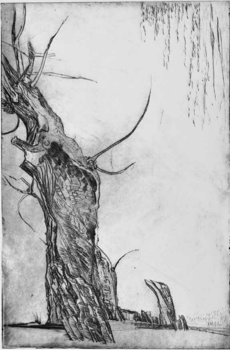
Ein Urgestein der Trierer Kunstszene stellt aus: Waltraud Jammers' „Lust an der Zeichnung“ ist vom 27. April bis zum 28. Juni im SWR Studio Trier zu sehen.